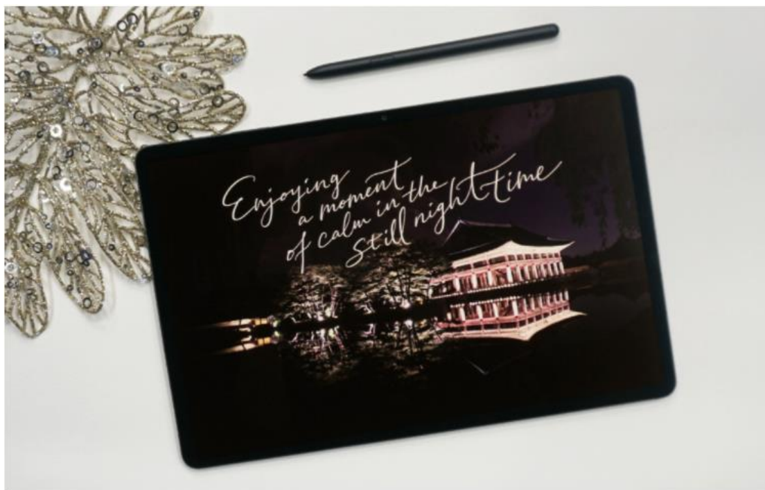
Jinwook O 攝於韓國首爾 ( Seoul, Korea ) / 2015 年 5 月