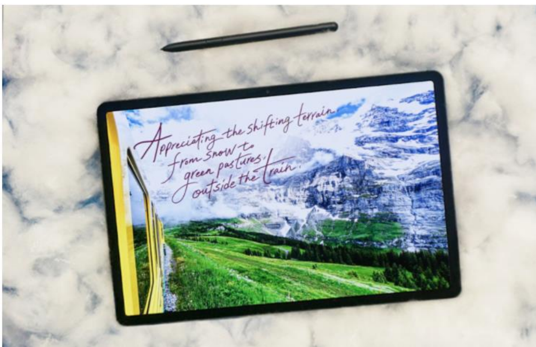
Youngjin Joo 攝於瑞士因特拉肯 ( Interlaken, Switzerland ) / 2018 年 6 月