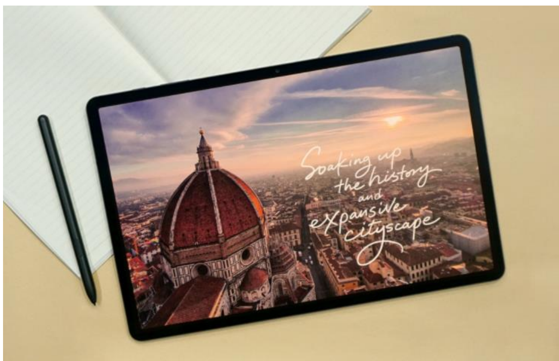
Giyeon Ko 攝於義大利佛羅倫斯 ( Florence, Italy ) / 2020 年 1 月