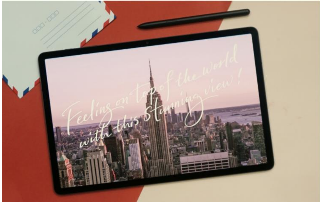
Jaehyeon Cheon 攝於美國紐約州紐約市 ( New York, USA ) / 2018 年 7 月