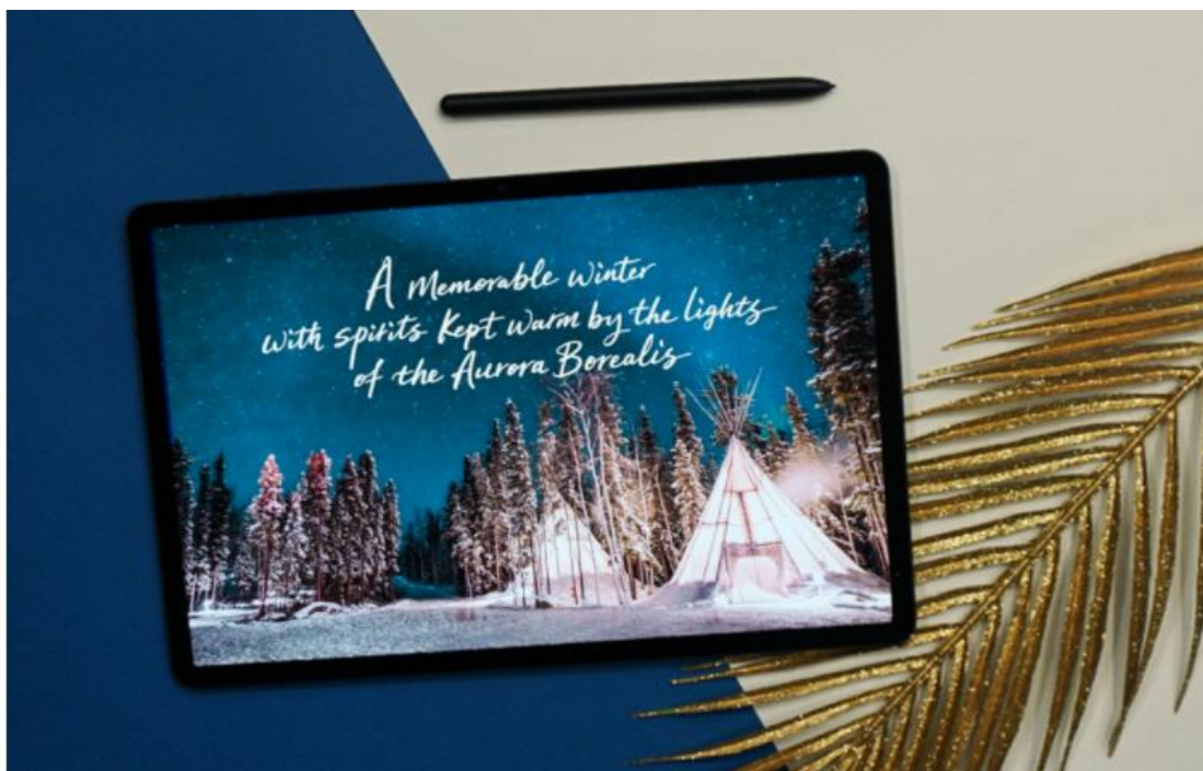
Jaehyeon Cheon 攝於加拿大黃刀鎮 ( Yellowknife, Canada ) / 2017 年 12 月