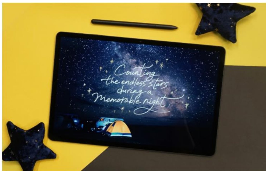
Daehyuk Choi 攝於蒙古巴彥扎格 ( Bayanzag, Mongolia ) / 2019 年 7 月