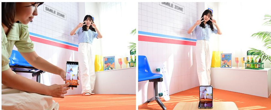
▲ 使用 Galaxy S23 Ultra ( 左 ) 和 Galaxy Z Flip5 ( 右 ) 拍攝全身照

使用 Flex 模式的廣角鏡頭仰拍，是使主角身型更顯修長的理想選擇。用戶可將 Galaxy Z Flip5 置於被攝者前方的地板上，接著調整 Flex Window 以尋找最佳取景角度。