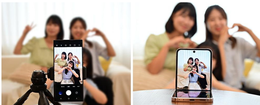
▲ 以架設在三腳架上的 Galaxy S23 Ultra ( 左 ) 和 Galaxy Z Flip5 ( 右 ) 拍攝合照