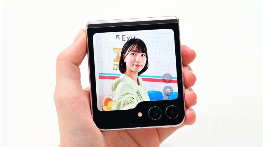
▲ 利用「Quick View」檢視照片