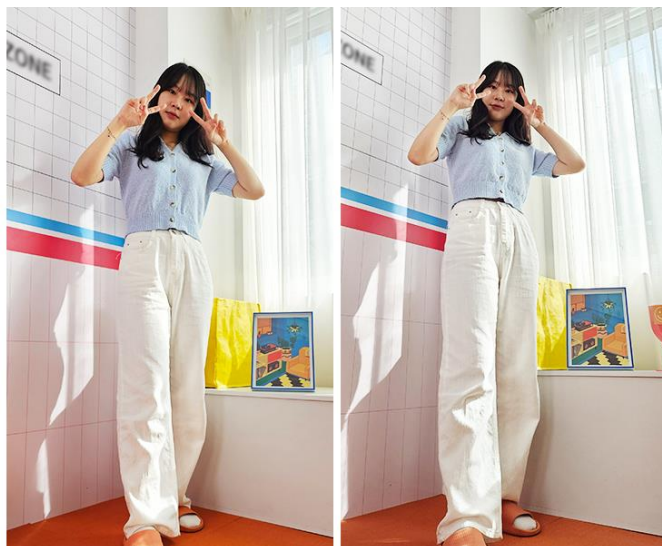
▲ 以 Galaxy S23 Ultra ( 左 ) 和 Galaxy Z Flip5 ( 右 ) 拍攝的照片