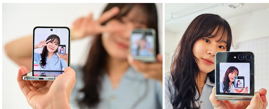
▲ 利用「雙螢幕預覽」對鏡自拍 ( 左 ) 與成像 ( 右 )

用戶可利用 Galaxy Z Flip5 的「雙螢幕預覽」功能，將智慧型手機螢幕面向鏡子，對著鏡中的自己拍攝，大玩時下最夯的對鏡自拍，跟上社群媒體的流行腳步。