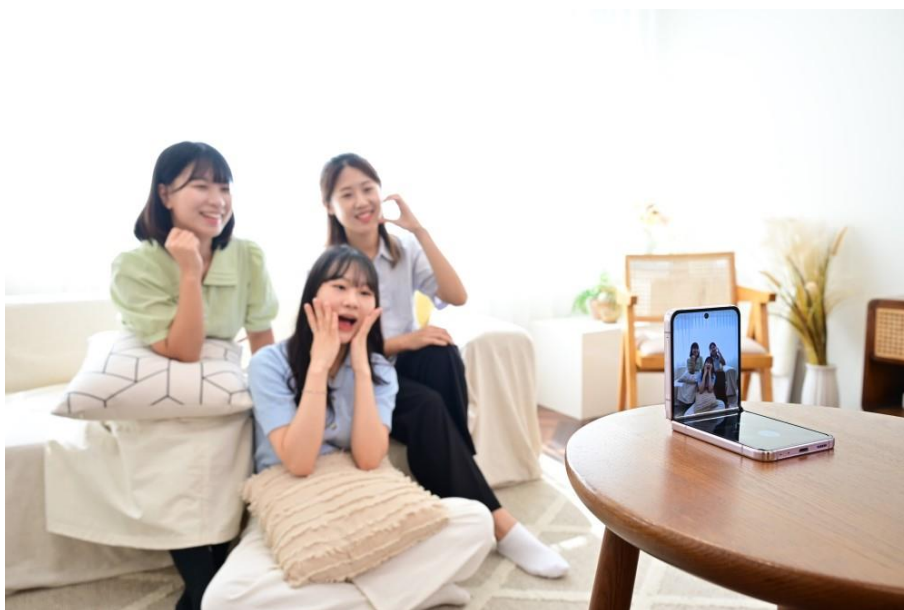
▲ Galaxy Z Flip5 顛覆以往體驗，讓合照變得簡單