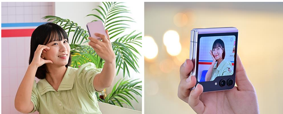
▲ 得益於 Galaxy Z Flip5 搭載的 FlexCam 和 Flex Window，拍攝高畫質自拍照變得再簡單不過

為確保照片每處細節皆細膩如畫，其 3.4 吋的 Flex Window 讓用戶能直接啟動倒數計時模式、動態照片、長寬比設定等小工具。