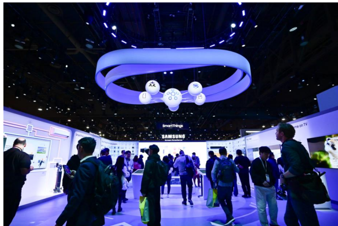
▲與會者湧入 SmartThings 展區一探究竟