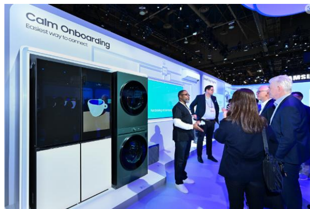
▲與會者全神貫注地聆聽 SmartThings Calm Onboarding 介紹，該技術導入無縫、自動裝置互聯技術，減少用戶在設置過程中所花費的時間。