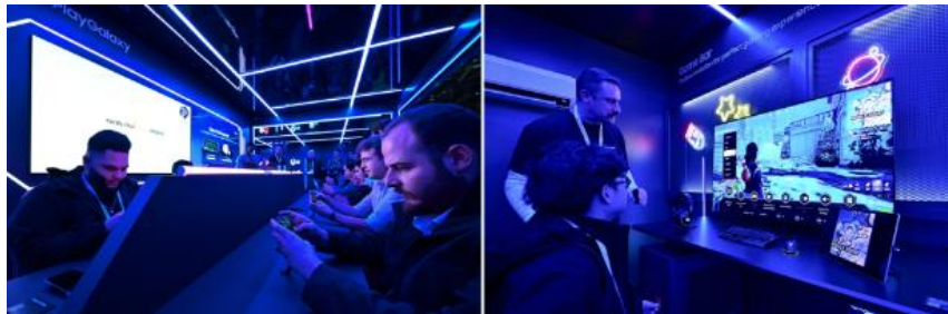
▲（左起）與會者參加 SmartThings 展區現場挑戰賽。與三星裝置上的 AI Auto Game Mode 等功能搭配使用，SmartThings 可營造完美的環境氛圍，讓用戶極致沉浸於遊戲世界。