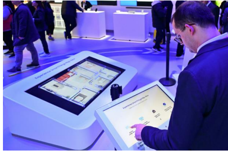
▲與會者實測 SmartThings 的 3D Map View，了解該設計如何讓用戶透過獨特的居家配置，輕鬆查看、操控裝置與家電的運作情形。3D Map View 將於今年 3 月上線。