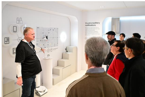
▲在 SmartThings Family Care 的助力下，每當摯愛的親人需要協助時，用戶將會收到通知。此功能已延伸應用於更多電器和空間，不論摯愛的親人位於家中何處，皆可獲得貼心的協助。