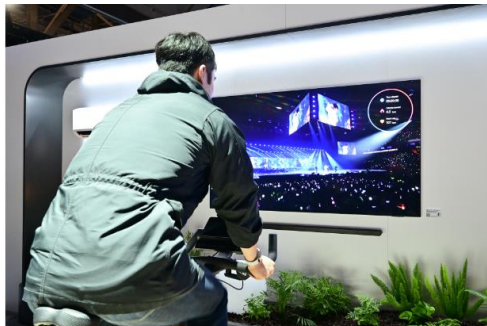
▲三星智慧顯示器和 Galaxy 穿戴式裝置之間的無縫串聯性，讓正在螢幕上觀看節目的用戶，也能即時瀏覽運動數據，例如心率和燃燒的卡路里。