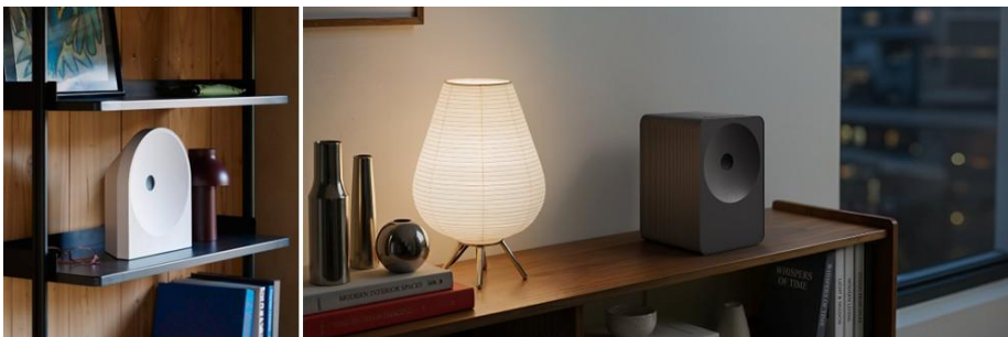
▲ Music Studio 5 (左) 與 Music Studio 7 能自然融入多元居家空間，串聯聲音與空間，在既有使用體驗中加入更多功能應用

我希望透過設計傳達一種本質而內斂的優雅，Music Studio 以能自然融入各種居家空間為出發點，成為陪伴日常生活的經典且耐用之作。在造型設計上，正面採用堅固的金屬網罩，精準包覆揚聲器結構，清楚展現設計的真誠與功能性。