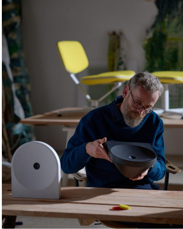
▲ Bouroullec 與三星合作打造 Music Studio 系列產品