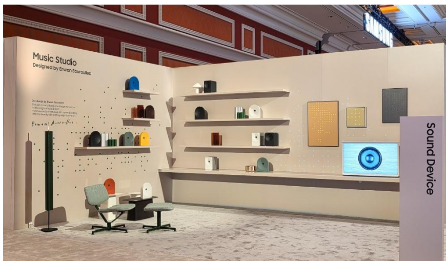
▲ Music Studio Wi-Fi 揚聲器於 The First Look 2026 展出

三星新聞中心專訪法國設計師 Erwan Bouroullec，分享揚聲器設計背後的理念，及與三星的合作歷程。以下內容經整理與編修後呈現，以提升整體閱讀流暢度與理解性。