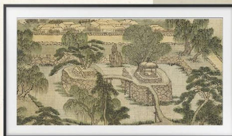
雙島亭 (18 世紀朝鮮王朝) | 鄭敏 (Jeong Seon)

此幅畫作創作素材取自「雙島亭」， 其座落於百花軒花園南方水潭畔。 精細的寫實手法， 使畫中景物栩栩如生， 此幅作品以細膩筆觸勾勒， 淋漓盡致展現鄭敏真景山水畫的精髓。