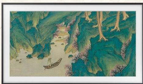
桃花源 (1913) | 安正植 (An Jung Sik)

此幅畫作取材自陶淵明《桃花源記》， 故事講述一漁人偶然發現世外桃源的經歷。 技藝高超，畫風細緻， 色彩運用妙不可言。