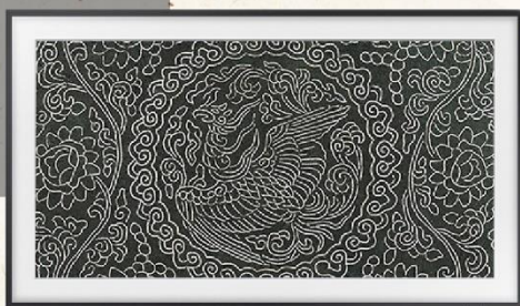
蓋碗 (11-12 世紀高麗王朝) | 國家級寶藏

容器頂蓋中央，雕有一隻騰雲鳳凰， 並以心形密集排列，圍繞成一個圓。 左右兩側綴以四裂葉的捲曲藤蔓， 搭配寓意吉祥的花朵。