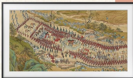
皇家車馬回漢陽 (朝鮮王朝 1795 年) | 金得臣 (Kim Deuk Sin) 等人

此幅畫為八幅屏風畫之一， 描繪 1795 年朝鮮王朝時期， 皇家車馬前往華城的壯大場面。 出行陣仗浩大， 沿著蒼翠山丘呈之字形移動， 吸引百姓駐足圍觀。