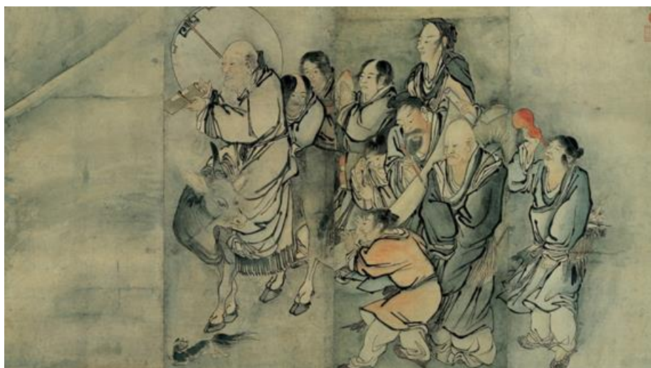
▲ 金弘道 1776 年畫作 - 長生道士 ( 朝鮮王朝 )

Lee 進一步表示：「無論是一張照片、一段文字，亦或聲音呈現，科技讓欣賞者得以近距離一窺藝術創作的每處細節，發掘以往遺漏的細膩巧思。隨著科技持續發展，人們對藝術的鑑賞與體會，將超越過往想像。」