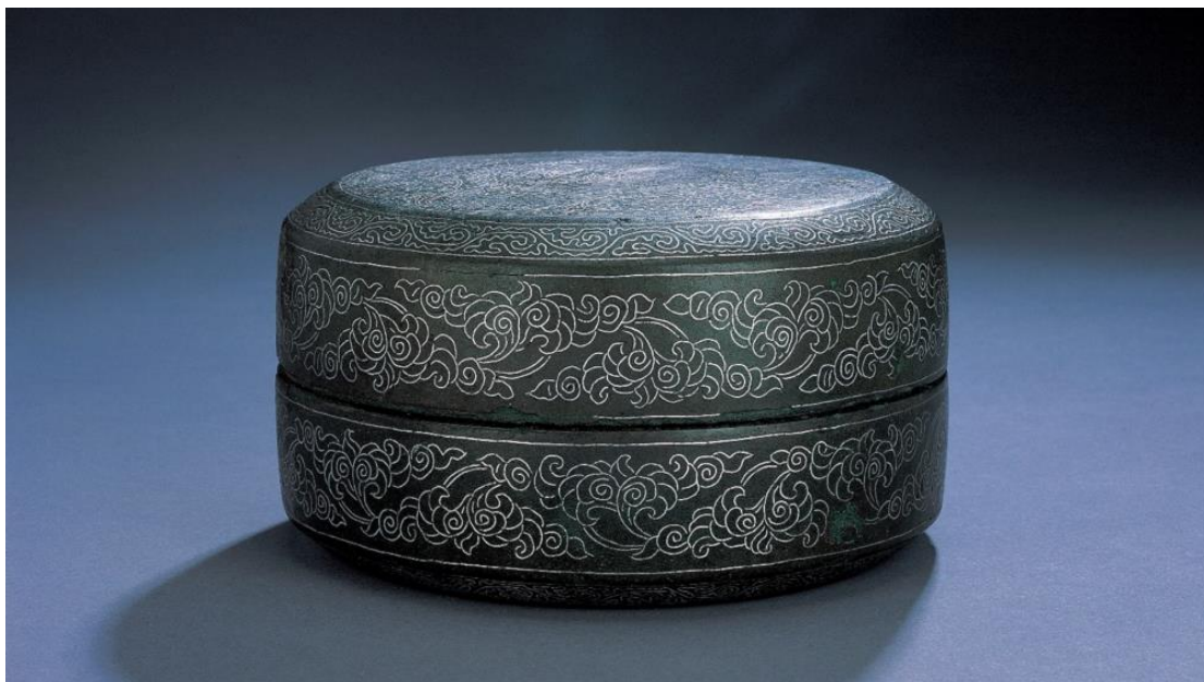
▲ 蓋碗 ( 國家級寶藏 ) - 11 至 12 世紀 ( 高麗王朝 )

館方策展人投注大量心力及時間，挑選一系列能突顯韓國藝術精髓與美學的作品。用戶現可透過 The Frame 美學電視，於自家舒適的環境中，欣賞巧奪天工的金屬雕花、色彩微妙的陶器，以及情感澎湃的畫作。