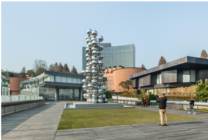
▲ Leeum 三星美術館外觀

2004 年，三星文化基金會於韓國首爾漢南洞設立 Leeum 三星美術館，旨在保存文化資產並將之呈現於世人眼前。美術館由知名建築師 Mario Botta、Jean Nouvel 及 Rem Koolhaas 操刀設計，並以建築美學價值、和諧相容自然環境的設計備受推崇。Leeum 三星美術館積極舉辦各種展覽，典藏豐富令人目不暇給，至今已成為南韓最具代表性、館藏最多元的文化寶庫。而今，Leeum 以廣納百川的收藏而聞名，涵蓋韓國傳統藝術精華作品，以及來自海內外充滿創作生命力的當代創作，展現古今交融與並存。過去十年，美術館亦將數位科技融入展覽中，以令人耳目一新且玩味十足的陳列方式，為歷史古物注入新生命。Leeum 三