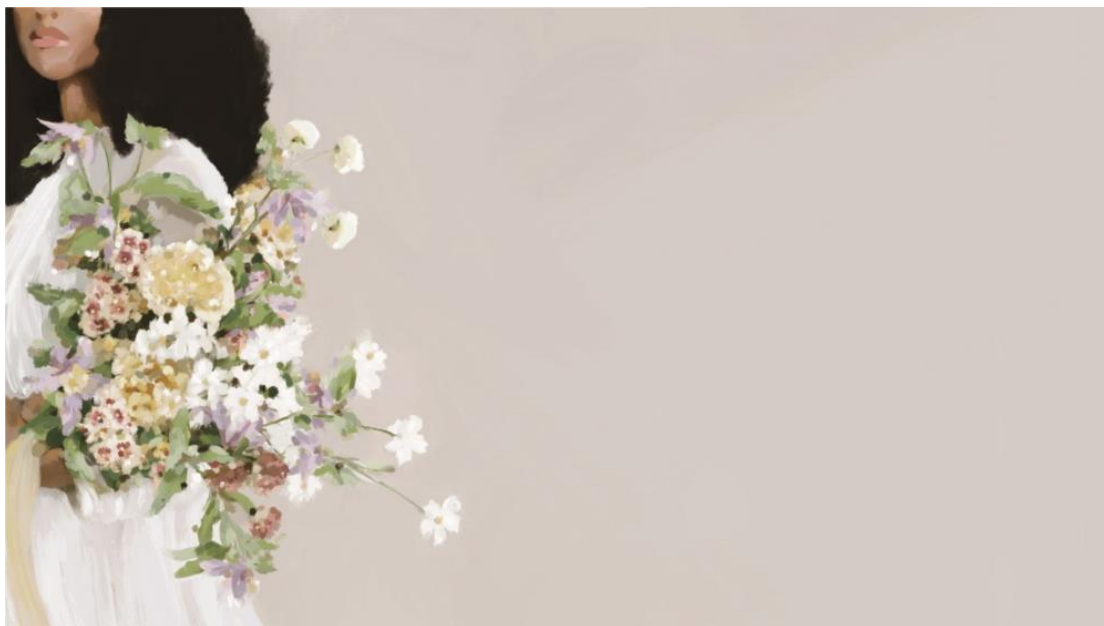
Brandy Brown 的作品《花綵》( Festooned )