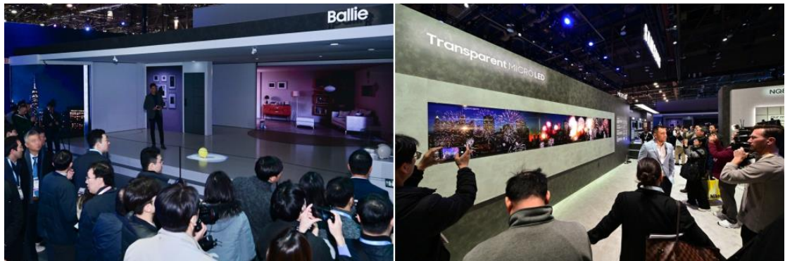
▲ 全新透明 MICRO LED 智慧顯示器與機器人 Ballie 吸引眾人目光