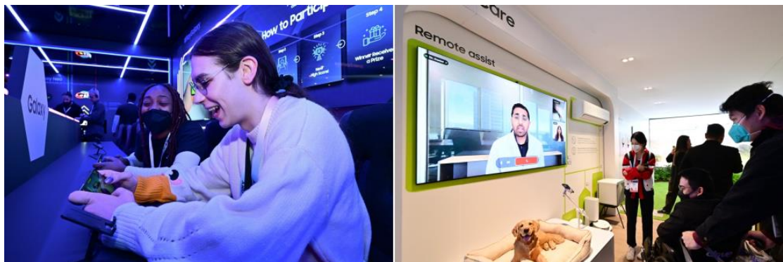
▲ ( 左起 ) 與會者沉浸於身歷其境的遊戲體驗； 與會者測試寵物照護 ( Pet Care ) 等一系列支援 SmartThings 的功能。