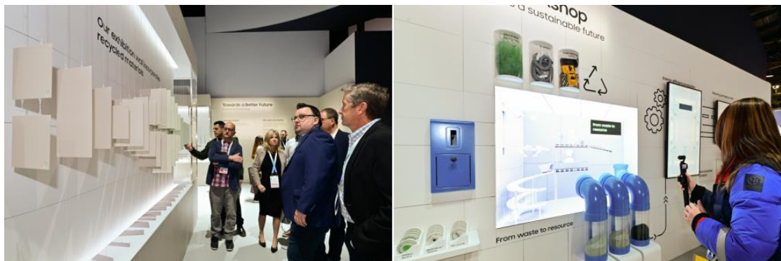
▲ 與會者在循環工作坊（Circular Workshop）檢視三星在永續發展上的詳細成果