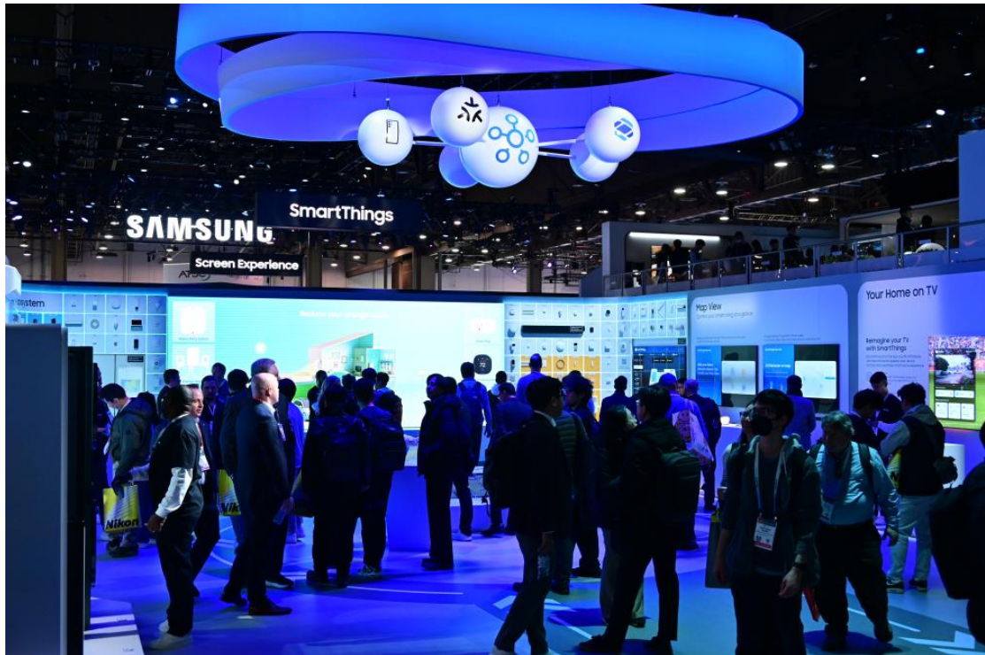
▲ SmartThings 區盛況