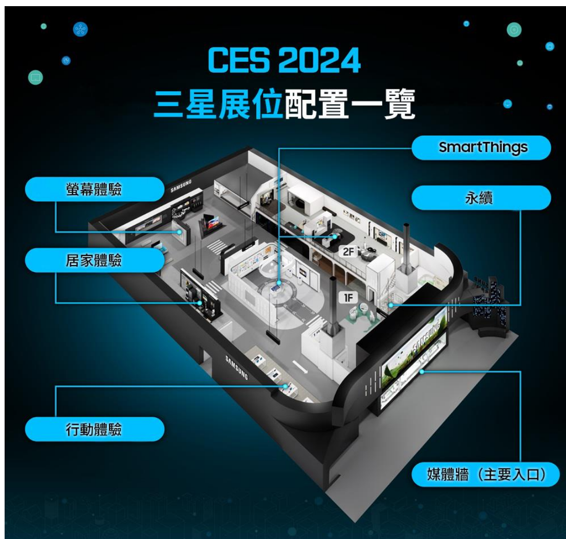
▲ 三星於 CES 2024 展位設置永續區、SmartThings 區、螢幕體驗區、居家體驗區及行動體驗區，展示全方位創新成果