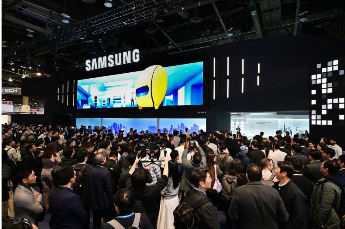
▲ 觀眾聚集在展位入口，於超大型 MICRO LED 顯示器 The Wall 觀賞三星最新發布的 AI 願景