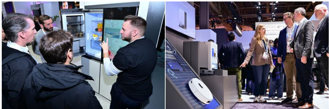
▲ 三星員工向與會者詳細解說 Bespoke 家電運作原理