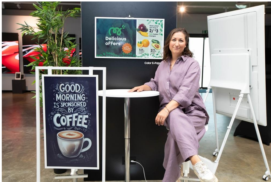
▲ 三星 Color E-Paper 以超低功耗與輕巧設計，打造兼具永續與靈活應用的新世代數位看板選擇

零售與企業客戶對三星 Color E-Paper 具有高度興趣，其兼具動態數位看板功能與超低功耗設計，適用於路線引導、會議室標示及空間設計等多元情境。Mindnich 表示：「許多客戶在參觀過程中發現了更多潛在應用可能。」