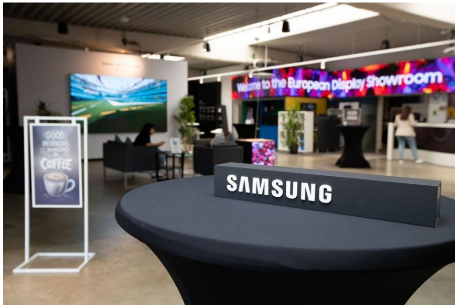
▲ 法蘭克福展示中心打造沉浸式體驗環境，讓客戶能探索三星最新的顯示技術與整合方案

自 2018 年啟用以來，位於法蘭克福的三星展示與培訓中心（法蘭克福展示中心）在該地區的 B2B 策略中扮演關鍵角色。該中心最初聚焦於 LED 技術，如今已發展成為全方位互動中心，重點展示三星的最新創新成果，涵蓋 The Wall、Cinema LED Onyx、Color E-Paper、Spatial Signage、各種 AI 解決方案，以及用於數位看板的雲端原生 CMS—VXT。