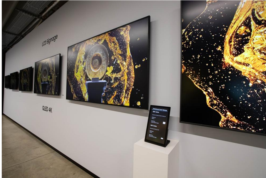
▲ 三星 4K 大型商用顯示器系列，涵蓋 32 吋至 98 吋多元尺寸，於法蘭克福展示中心並排展出

零售與企業客戶對三星 Color E-Paper 具有高度興趣，其兼具動態數位看板功能與超低功耗設計，適用於路線引導、會議室標示及空間設計等多元情境。Mindnich 表示：「許多客戶在參觀過程中發現了更多潛在應用可能。」