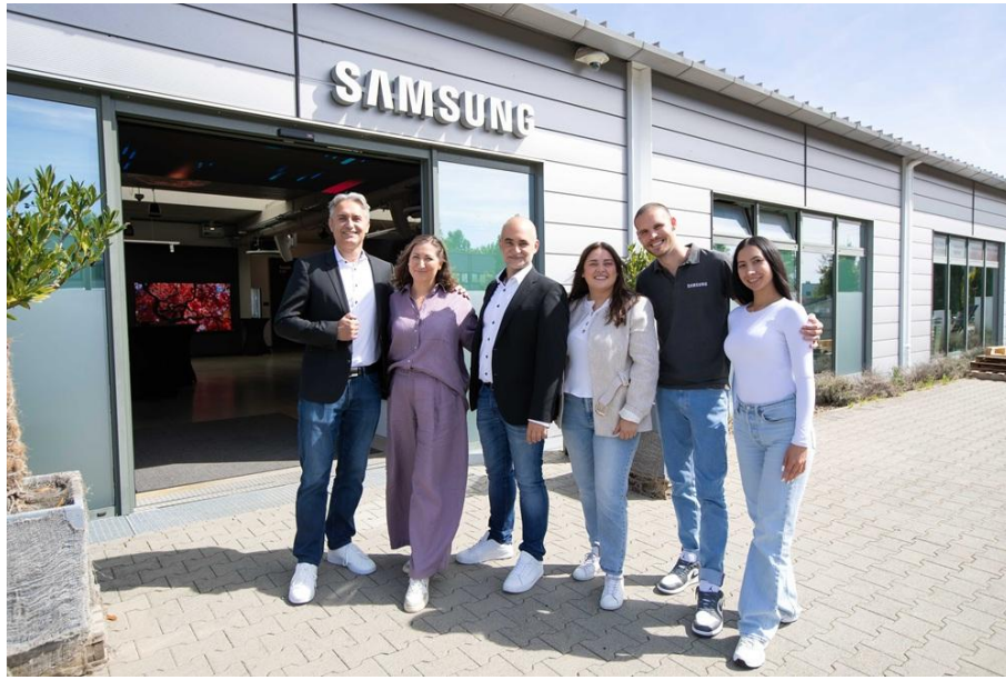
▲ 三星團隊代表於德國法蘭克福歐洲顯示器展示暨培訓中心前合影

與客戶前來進行專案討論、產品簡報，或單純探索可行方案，也讓我們能率先觀察新產品在客戶間的實際反應。」