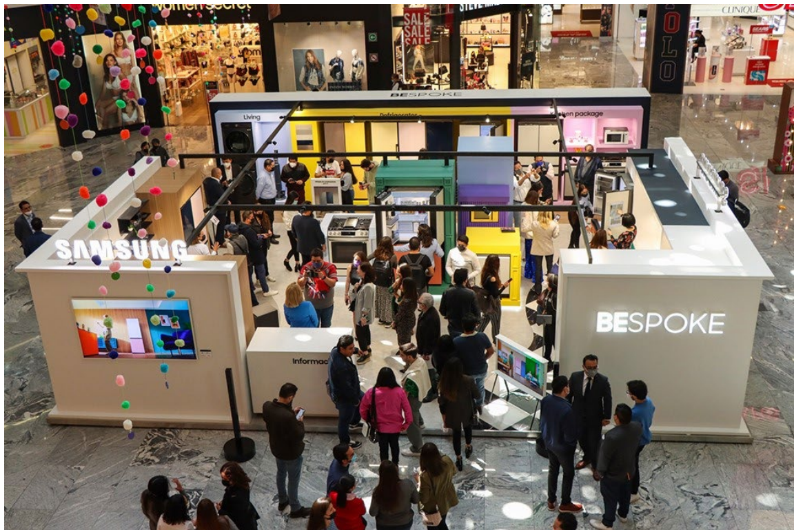
▲墨西哥 Bespoke Home 首間旗艦館的現場來賓，可獲得冰箱、洗衣機等各種 Bespoke 產品的一站式體驗。