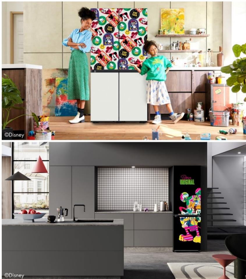
▲三星 Bespoke 迪士尼系列的各種設計