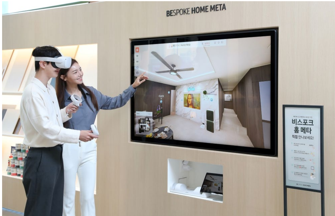
▲ 韓國消費者可透過 Bespoke Home Meta 服務體驗 Bespoke 產品。

韓國消費者可透過 Bespoke Home Meta 服務，展開虛實合一的 Bespoke 產品體驗。三星於韓國推出嶄新的 Home Meta 服務，此為一項基於元宇宙的 3D 體驗，讓用戶在高相似度的住家環境內，挑選欲體驗的 Bespoke 設計品味系列產品。用戶可透過此項虛擬服務，指定欲體驗的確切機型和顏色、瀏覽店內未陳設的產品，模擬這些電器在住家的應用情形。