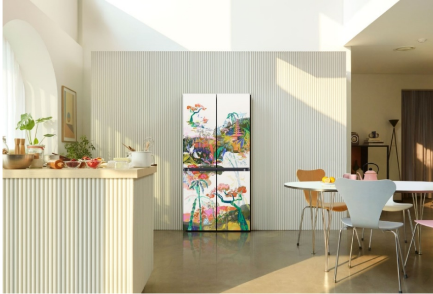
▲三星 Bespoke 4-Door Flex™ 冰箱，採用出於插畫家 Rachel Ajeng 之手的「Reimagine Indonesia」設計

為慶祝印尼獨立 77 周年，三星與兩位印尼籍插畫家 Kathrin Honesta 和 Rachel Ajeng 攜手合作，推出 Bespoke 冰箱和 AirDresser 限量聯名設計款，提供消費者三種不同選擇，包括：Kathrin Honesta 的「Butterfly Garden」與「Timun Mas」，以及 Rachel Ajeng 的「Reimagine Indonesia」。這些設計突顯印尼的種族和文化多元性，使印尼消費者在家欣賞名家藝術之餘，亦以自己的印尼根源為傲。