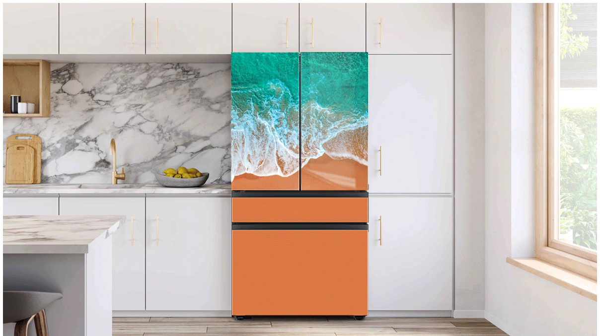
▲ MyBeBespoke 客製設計面板讓用戶依據個人喜好，為家中 Bespoke 冰箱披上繽紛色彩。