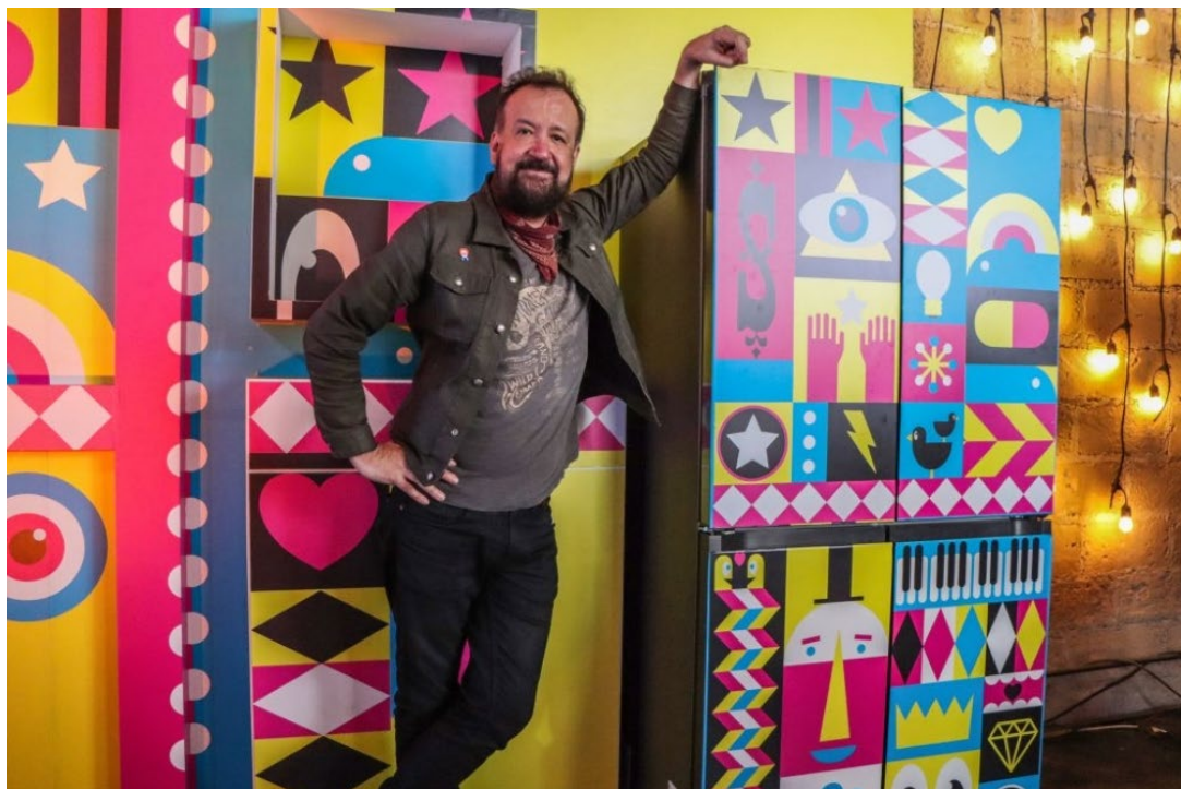
▲從簡單大方的色彩，到鮮艷搶眼的設計，墨西哥當地消費者可透過 Bespoke 設計品味系列家電，享受耳目一新的家居設計。