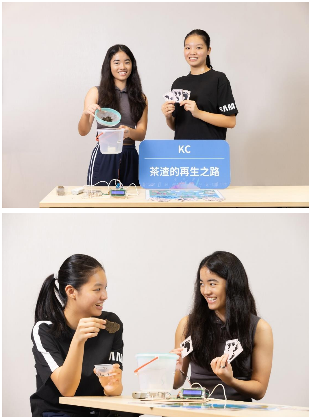
▲ KC 的茶渣的再生之路藉由向手搖飲店回收廢棄茶渣後製成吸油紙，達到水質優化的作用

境問題，才能讓生活變得更舒適宜居。在考慮核能汙染、太陽能、電池回收等題目後，兩人決定從生活中出發，越貼近日常的創新點子可影響的範圍才越寬廣。