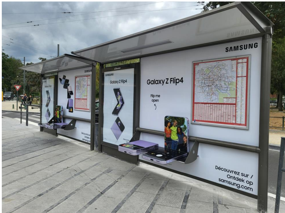
▲ 比利時一處公車亭的 Galaxy Z Flip4 造型座椅

三星在比利時的公車亭裝設 Galaxy Z Flip4 造型座椅，除了達到宣傳效果，還能讓候車乘客坐下休息，既新奇又實用。此創意裝置自 8 月 26 日起在五個地點展示約一個月，包括布魯塞爾精品大道 Avenue Louise 和安特衛普歌劇院所在街道。