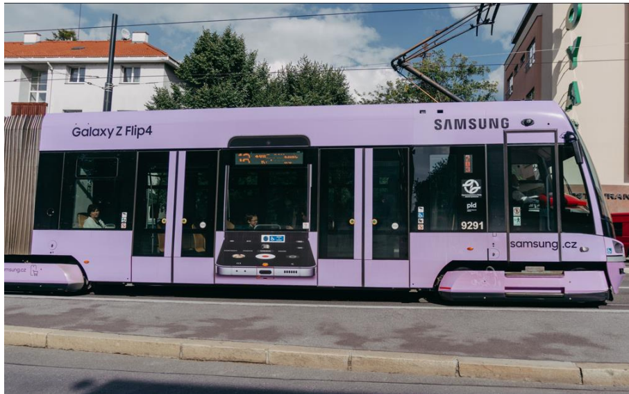
▲ 電車化身移動看板穿梭在捷克布拉格市中心

8 月 22 日起，捷克布拉格市中心出現一台塗著 Galaxy Z Flip4 精靈紫色系的電車，車窗還特別設計成 Z Flip 的 FlexCam，裡頭的乘客就像拍攝畫面的主角。至 2023 年二月底前，不同路線的更多電車亦將換上此限定設計，讓電車不只是大眾運輸工具，更是能有效吸引市民目光的移動看板。