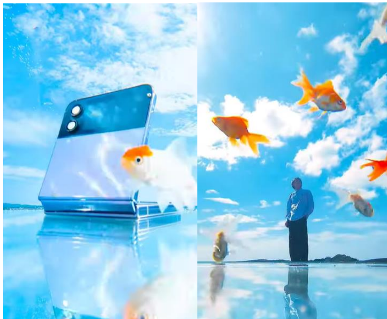
▲ 三星與日本網紅合作，利用 FlexCam 拍出「會飛的金魚」