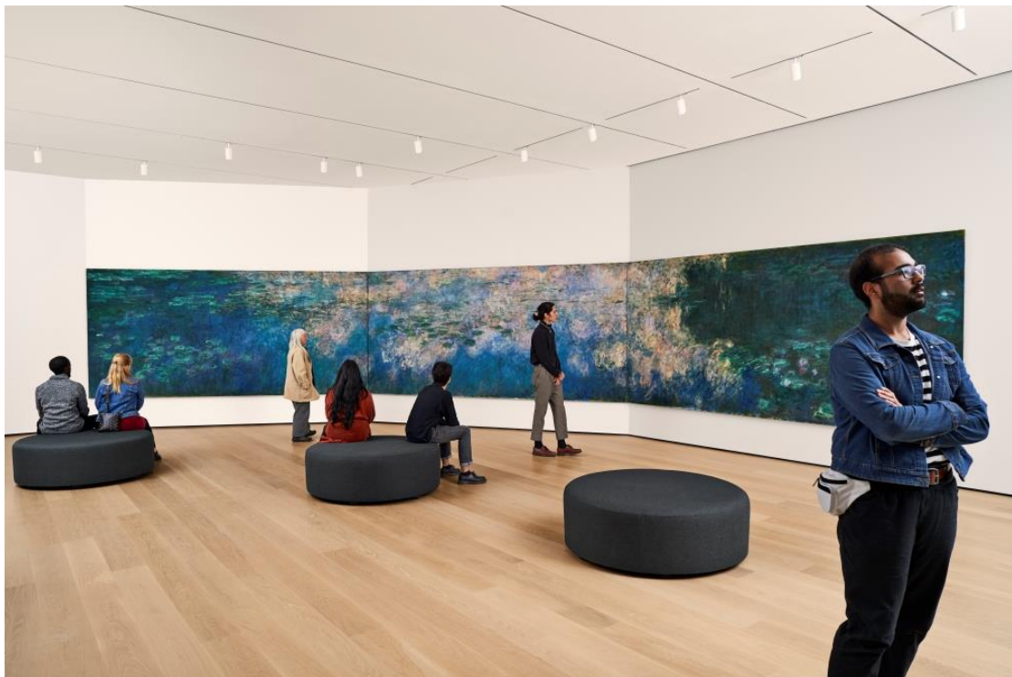
▲五樓藝廊藏品一覽。展出作品：克洛德·莫內 ( Claude Monet ) 《睡蓮》( 1914-26 ) 布面油畫。