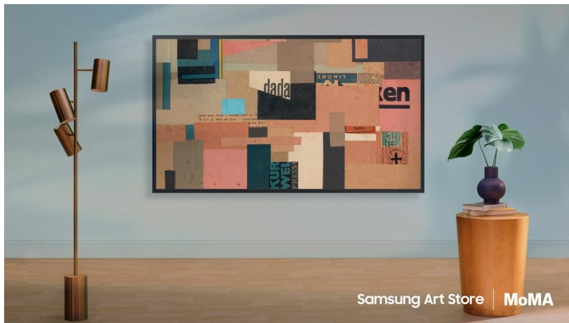
▲ Hannah Höch 《無題 ( Dada)》( 局部) ( 1922) 於三星 The Frame 展示。

三星藝術市集獨家支援 The Frame ，2024 年新款提供更為完整的藝術和美學體驗。新機型獲得全球色彩權威機構彩通 ( Pantone ) (註一) 的 ArtfulColor 認證，成為世界第一且唯一榮獲此殊榮的藝術顯示器。The Frame 呈現自然逼真的視覺效果，即便置於藝廊也能完美融入，彷彿懸掛在牆上的畫作。該系列提供 32 到 85 吋不等的尺寸選項，且邊框 (註二) 可替換成各式顏色和設計，讓用戶依照個人獨特的風格和裝潢品味，以前所未有的多樣化方式自訂 The Frame。