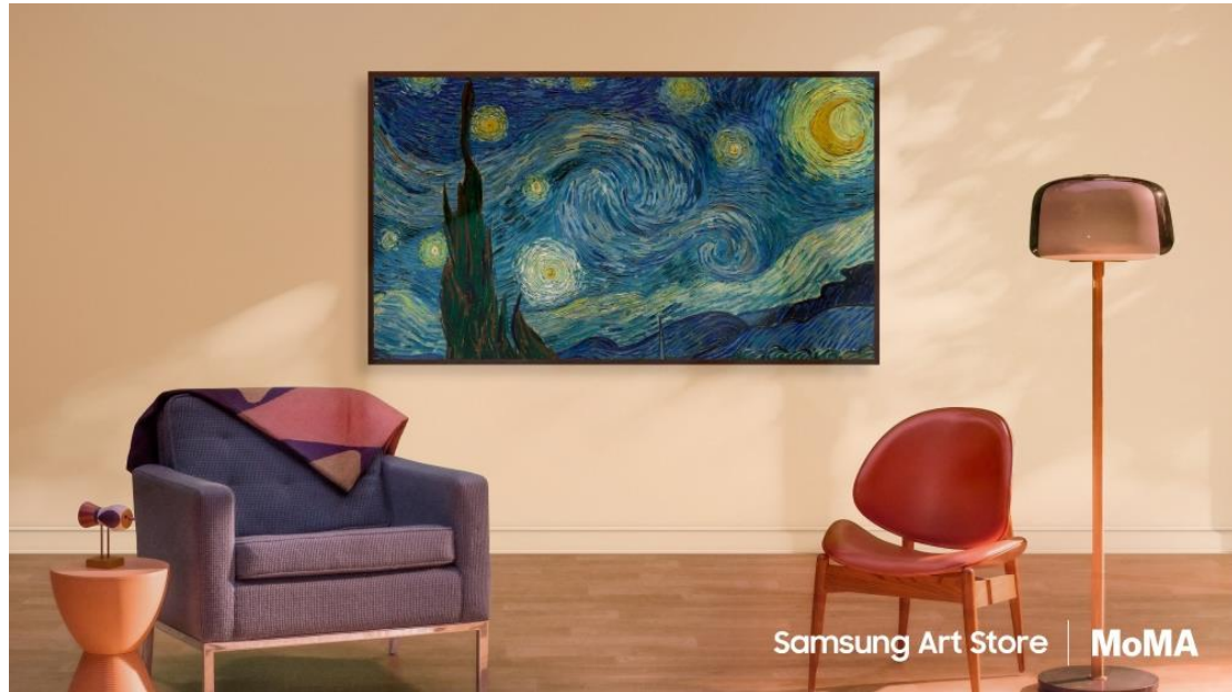
▲文森·梵谷《星夜》(局部)(1889)於三星 The Frame 展出。

芙烈達·卡蘿 (Frida Kahlo) 和喬治亞·歐姬芙 (Georgia O'Keeffe) 等眾多現代藝術博物館 (MoMA) 的名家藝術館藏，現以 4K 超高解析度登上 The Frame