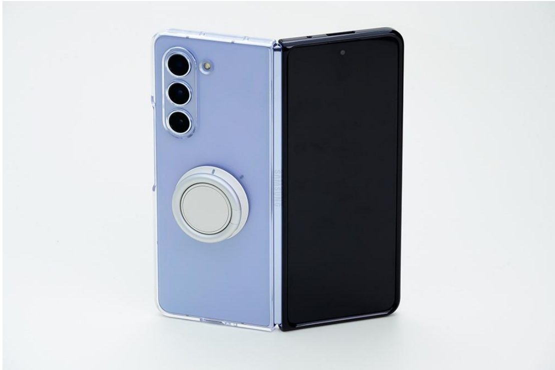
▲ Galaxy Z Fold5 透明多功能保護殼外殼。

部分用戶喜歡用簡單的外殼大方展示裝置本色，Galaxy Z Fold5 透明多功能保護殼即為不二之選，透明設計盡顯 Galaxy Z Fold5 原機風采。