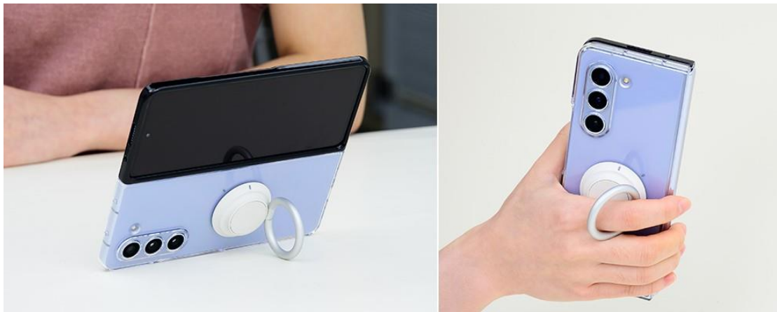
▲ Galaxy Z Fold5 透明多功能保護殼可變換各種配件。

部分用戶喜歡用簡單的外殼大方展示裝置本色，Galaxy Z Fold5 透明多功能保護殼即為不二之選，透明設計盡顯 Galaxy Z Fold5 原機風采。