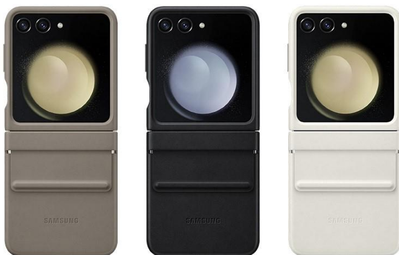
▲ Galaxy Z Flip5 純素皮革保護殼提供亞麻灰、幻影黑和奶霜白三款配色。

Galaxy Z Flip5 純素皮革保護殼與 Galaxy Z Fold5 款同樣採用植物性皮革製成，設計經久耐用。雅緻外殼融合玉米和再生塑膠材料 (註五) 等生物及植物來源，令 Galaxy Z Flip5 質感加倍、歷久彌新。全覆蓋式設計完整包覆 Galaxy Z Flip5 標誌性轉軸，使其使用過程中獲得充分防護。