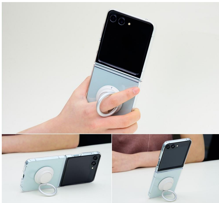
▲ Galaxy Z Flip5 透明多功能保護殼使用實例。

使用 Galaxy Z Flip5 透明多功能保護殼可輕鬆秀出 Galaxy Z Flip5 的絕美原色：薄荷綠、曜石灰、奶霜白或薰衣紫。Galaxy Z Flip5 透明多功能保護殼以回收材質 (註六) 打造，完美襯托裸機原色，擄獲眾人目光。