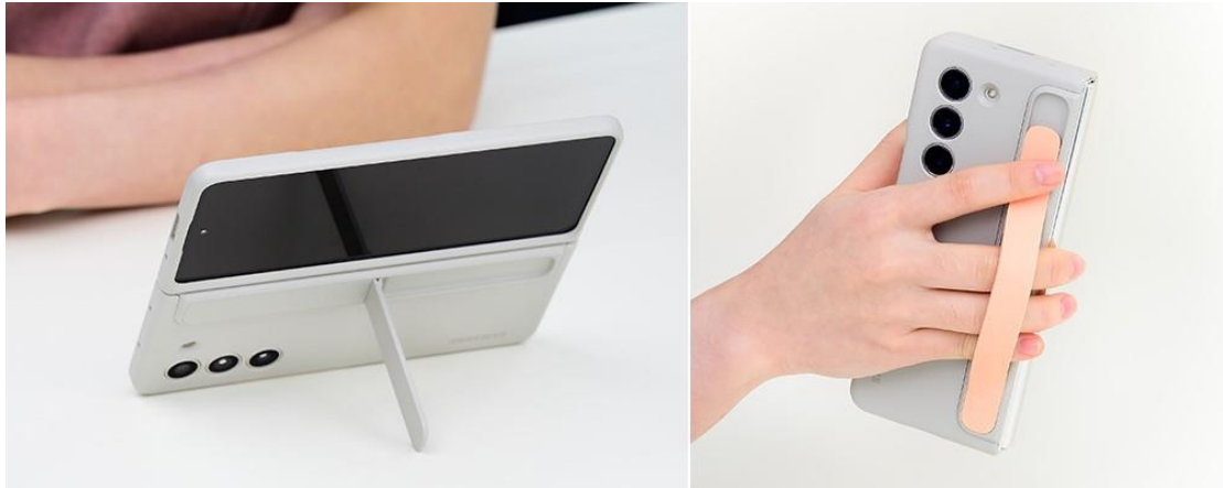
▲ Galaxy Z Fold5 立架式保護殼（附指環帶）能靈活搭配支架（左）或指環帶（右），便攜性十足。

支架能解放雙手、創造舒適的 Galaxy Z Fold5 觀賞體驗，隨附指環帶可將手機安全牢握，攜帶更方便。