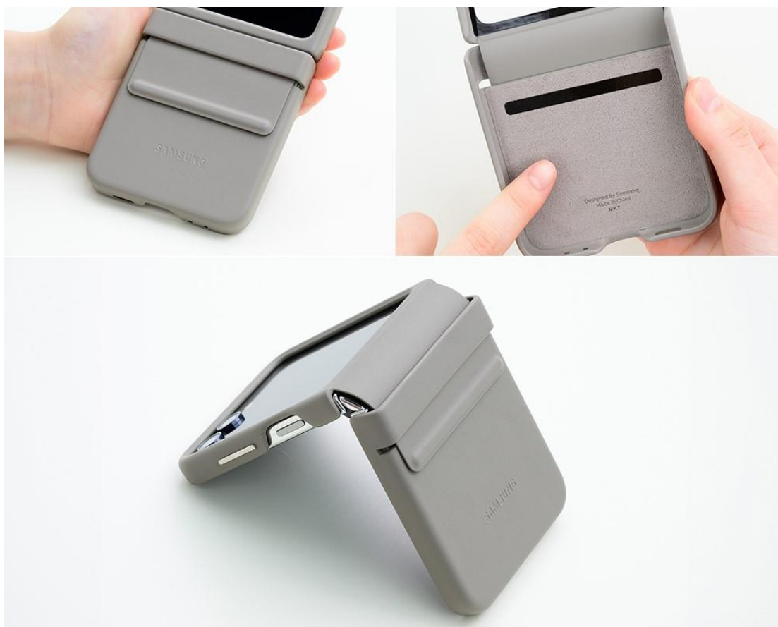
▲ Galaxy Z Flip5 純素皮革保護殼觸感滑順（左上），內襯（右上）則牢牢固定機身，轉軸處亦完整包覆（下），無論開闔皆保護到位。

Galaxy Z Flip5 純素皮革保護殼與 Galaxy Z Fold5 款同樣採用植物性皮革製成，設計經久耐用。雅緻外殼融合玉米和再生塑膠材料 (註五) 等生物及植物來源，令 Galaxy Z Flip5 質感加倍、歷久彌新。全覆蓋式設計完整包覆 Galaxy Z Flip5 標誌性轉軸，使其使用過程中獲得充分防護。