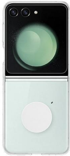
▲ Galaxy Z Flip5 透明多功能保護殼外殼。

使用 Galaxy Z Flip5 透明多功能保護殼可輕鬆秀出 Galaxy Z Flip5 的絕美原色：薄荷綠、曜石灰、奶霜白或薰衣紫。Galaxy Z Flip5 透明多功能保護殼以回收材質 (註六) 打造，完美襯托裸機原色，擄獲眾人目光。