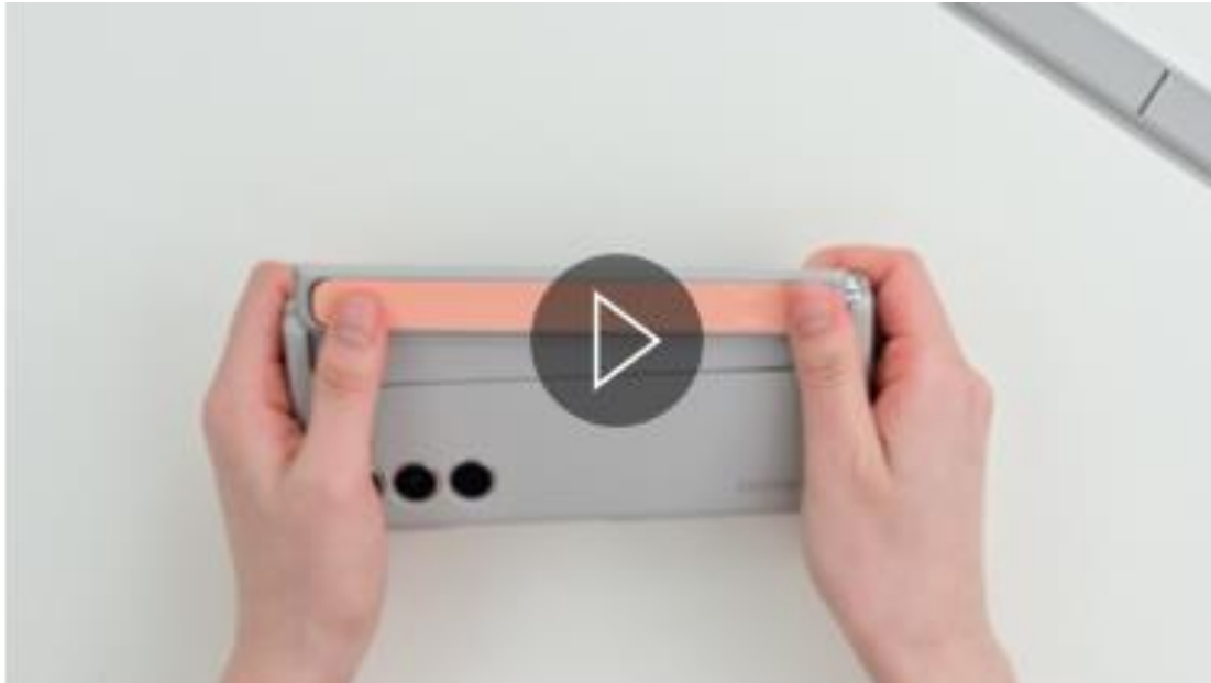
▲ 向上推開支架並將指環帶滑入凹槽，即可簡單拆卸更換。

支架能解放雙手、創造舒適的 Galaxy Z Fold5 觀賞體驗，隨附指環帶可將手機安全牢握，攜帶更方便。