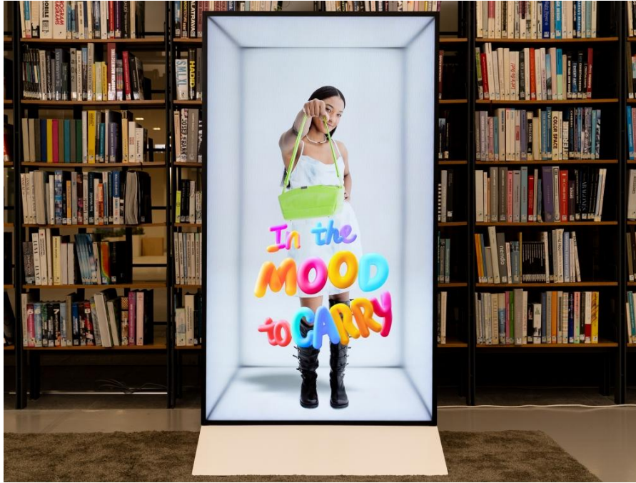
▲ Spatial Signage 解鎖多元且創新的顯示應用體驗

Spatial Signage 的價值不僅在於讓影像呈現立體效果，更於日常生活場域中打造更即時、更具記憶點且更貼近真實感的沉浸式視覺體驗。