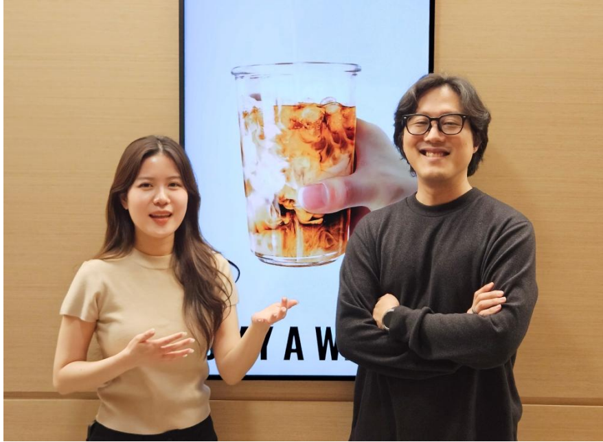
▲ Samsung VXT 可協助使用者製作符合數位看板播放需求的影音內容

Nam 表示：「每當我經過設置 Spatial Signage 的咖啡館時，常會看到人們停下腳步觀看畫面。對於希望以更具吸引力的方式推廣季節限定菜單或活動資訊的咖啡館與連鎖品牌而言，這項技術可提供極具效果的全新選擇。」