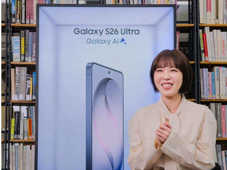
▲ Chung 說明 Spatial Signage 如何體現三星在 3D plate 影像設計及光影與透視處理等面向的設計實力

然而，這項概念實際落實的過程，遠比預期更加複雜，Chung 說明：「一般設計工作通常只需處理單一影像，但 Spatial Signage 則需將影像切割為微米等級的細微區塊，尺寸甚至小於人類髮絲。」設計團隊必須事先預判這些影像區塊在整合後的呈現效果。他進一步指出：「若沒有對光學原理具備深厚理解，便難以完成這項設計。團隊透過持續研究並實際應用相關原理，才得以實現如今呈現的立體景深效果。」