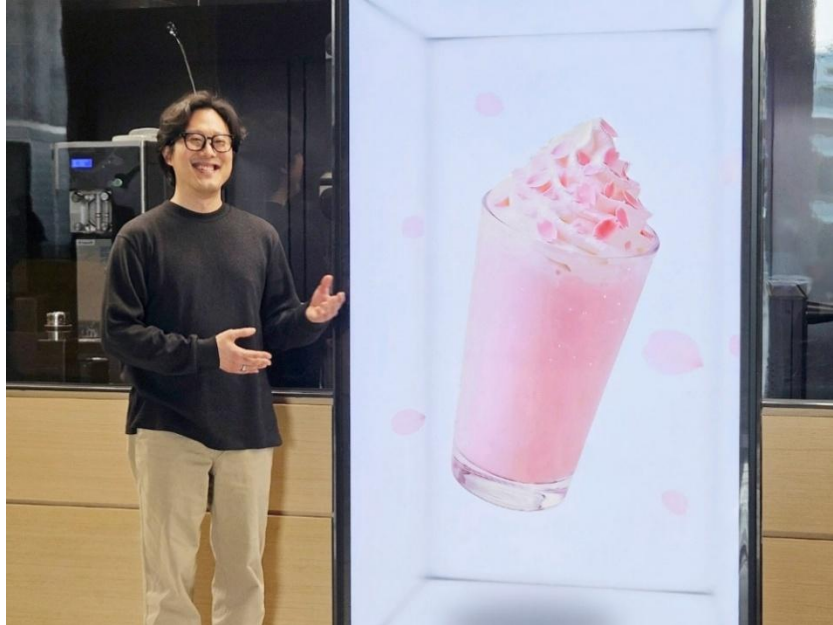
▲ Sun 說明 Spatial Signage 如何打造沉浸式 3D 體驗

他補充表示：「Spatial Signage 可在無需配 3D 眼鏡或大型全像裝置的情況下呈現沉浸式 3D 景深效果，能靈活應用於多元場域，打造差異化視覺體驗，同時亦可降低專用內容製作成本，與既有數位看板系統相容。」