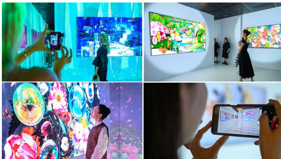
▲ 觀展者於三星 ArtCube 中，透過 MICRO LED 欣賞多幅精選藝術作品。

今年，巴塞爾藝術展香港展會匯聚來自 42 個國家的 240 間藝廊參展，其中逾半數展出作品來自亞洲及亞太地區，展現該地區 多元且充滿活力的文化風貌 。