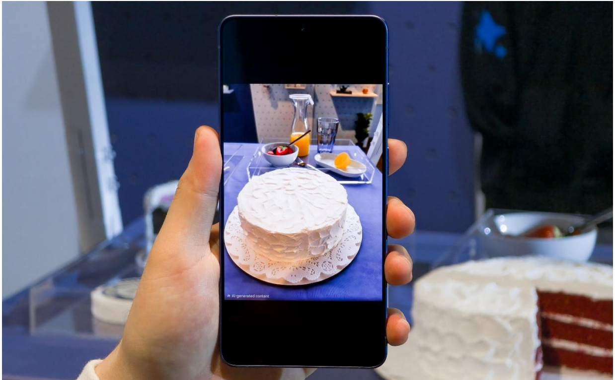
▲ 「相片智慧助理」利用 AI 編輯功能修復影像

「相片智慧助理」已升級進化，不僅能移除多餘物件，還能自然地添加新元素。只需一句指令，AI 便能將被咬過一口的蛋糕恢復原狀，無縫重建未被食用的完美狀態。此外，還能將場景從白天切換到黑夜，或調整服裝細節以符合情境氛圍，讓影像後製編輯變得更快速、更輕鬆。