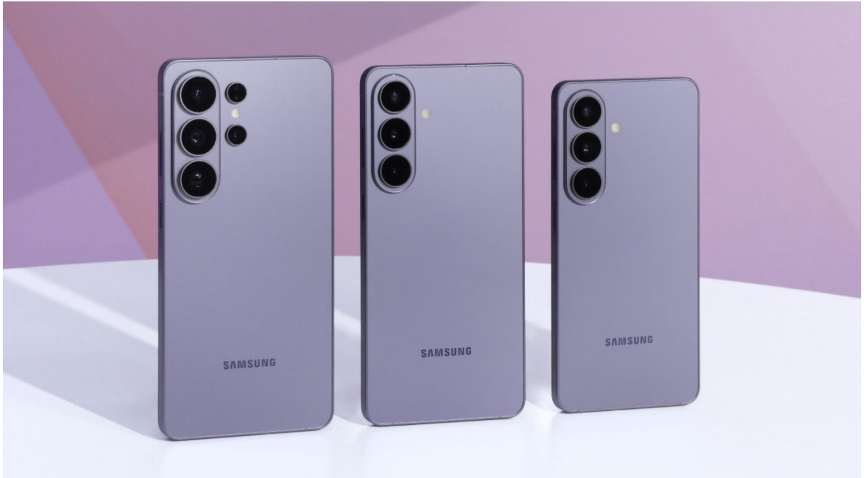
▲Galaxy S26 旗艦系列 ( 左起 ) Galaxy S26 Ultra、Galaxy S26+與 Galaxy S26

輕薄化的機身設計是一大亮點。Galaxy S26 Ultra 厚度較前代減少 0.3 mm，重量為 214 公克。更纖薄的機身規格，在提升便攜性的同時，亦保有穩固舒適的手感。