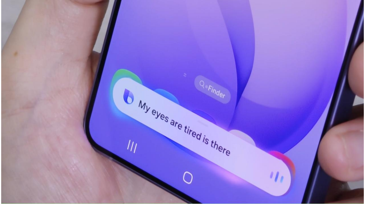
▲Bixby 能解讀使用者的意圖，並立即建議調整相關設定