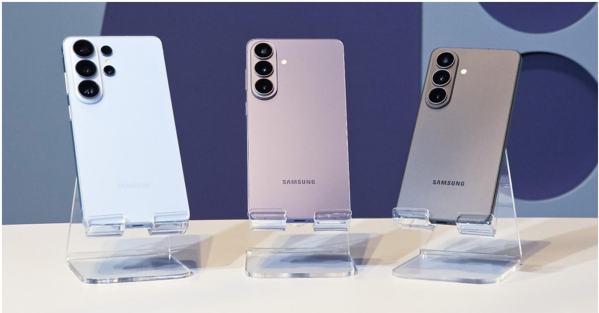
▲Galaxy S26 旗艦系列 ( 左起 ) Galaxy S26 Ultra、Galaxy S26+與 Galaxy S26

在 Galaxy Unpacked 2026 期間，三星新聞中心帶領大家搶先上手 Galaxy S26 旗艦系列。