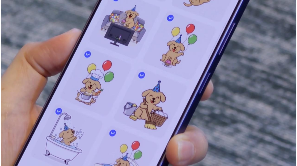
▲「創意工作室」能讓用戶以簡單的文字指令創作影像，並將生成的影像轉化為個人專屬貼圖

從 Galaxy S24 系列推出以來，Galaxy S 系列開創 AI 手機的新紀元。隨著 Galaxy S26 旗艦系列的登場，三星為消費者帶來第三代 AI 手機，提供超乎意圖識別的個人化體驗。Galaxy S26 旗艦系列具備迄今最強悍的效能，與最直覺的 Galaxy AI，寫下行動創新的歷史新頁。