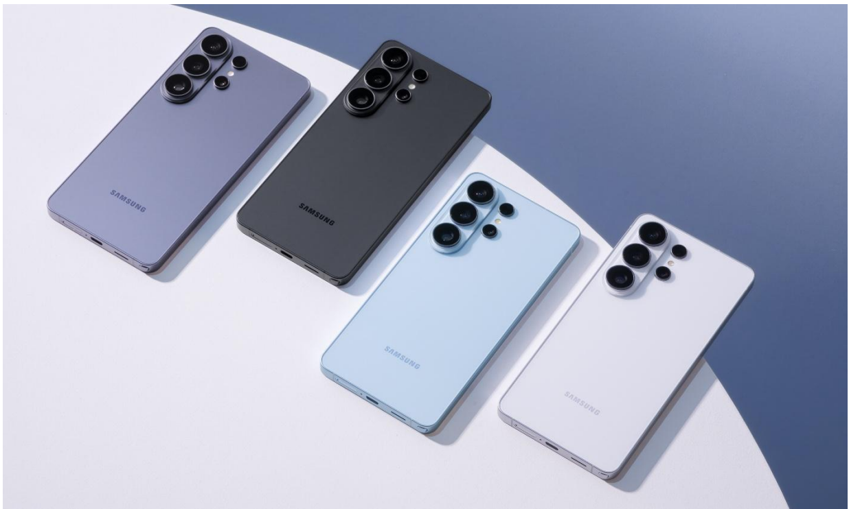
▲Galaxy S26 旗艦系列推出多款配色：漫遊紫、漫遊黑、漫遊藍、漫遊白

輕薄化的機身設計是一大亮點。Galaxy S26 Ultra 厚度較前代減少 0.3 mm，重量為 214 公克。更纖薄的機身規格，在提升便攜性的同時，亦保有穩固舒適的手感。