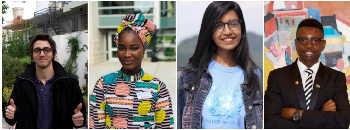
2020 年 Generation17 青年領袖

在這個前所未見的無國界疆域中，身為擅用科技的世界公民，千禧世代與 Z 世代對於催化改革產生驚人影響力，以意志堅定且不屈不撓的樂觀精神，引領氣候變遷與種族正義等議題趨勢，並對政策制定者與企業帶來影響，進而為集體群眾的未來開拓出永續道路。而 Generation17 計畫正是號召全民行動的解決方案。