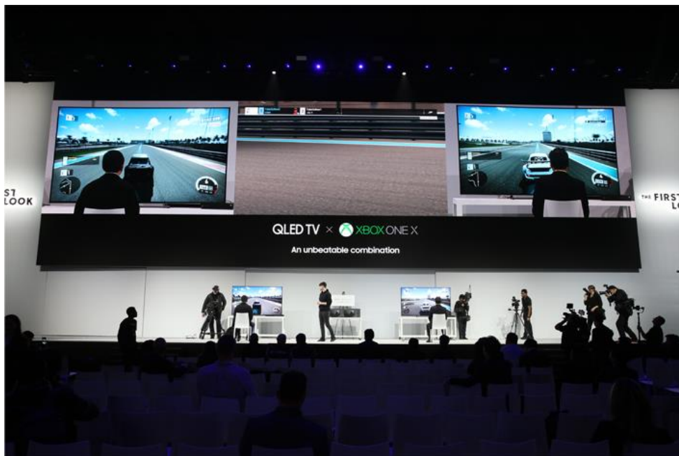
在 XBOX 賽車電競遊戲中，玩家們正面交鋒。QLED 量子電視賦予這款遊戲更身臨其境的感官體驗，此比賽亦在 YouTube 上同步直播。