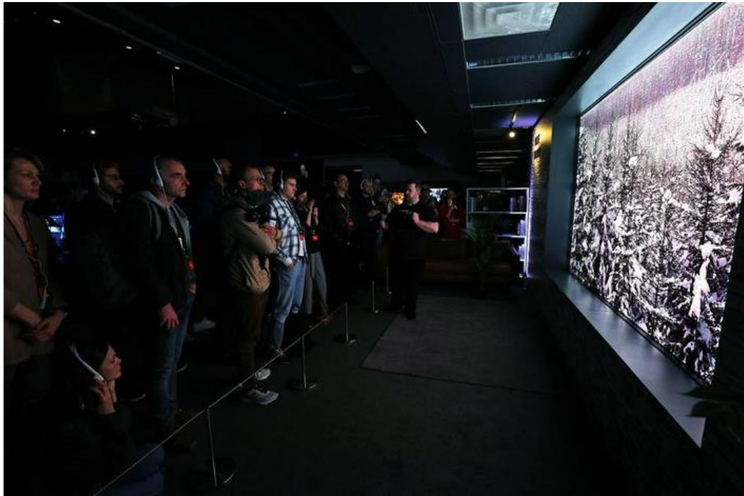
三星 146 吋模組化電視 The Wall，讓參觀者完全沈浸在充滿未來感的寬闊視野中。The Wall 將於今年下半年上市。