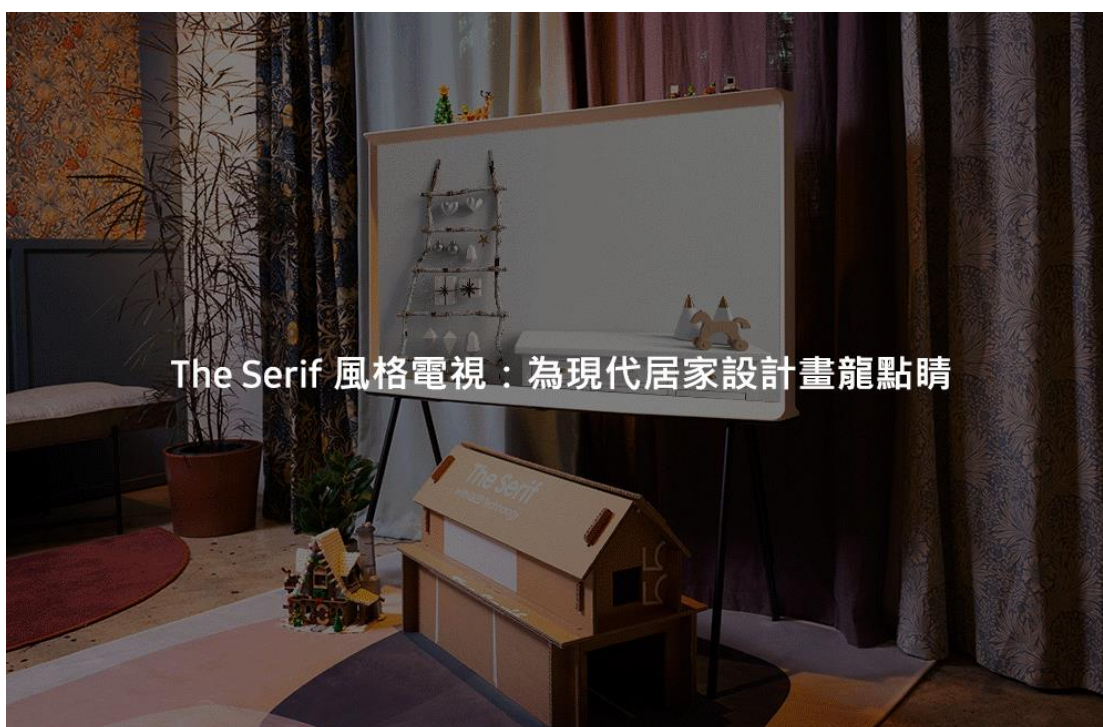
The Serif 風格電視：為現代居家設計畫龍點睛

The Serif 風格電視為法國傢俱設計師 Bouroullec 兄弟聯手設計，獨一無二的「I」襯線字母造型邊框，呈現如家飾般精緻質感。The Serif 風格電視專為喜愛室內設計的消費者打造，吸睛的落地式腳架 (註一) 宛如藝術品，襯托出色不凡的獨特造型。此外，此產品採用全新「環保包裝」設計，其紙箱可改造成小茶几、層架或貓屋等，體現環境永續精神。