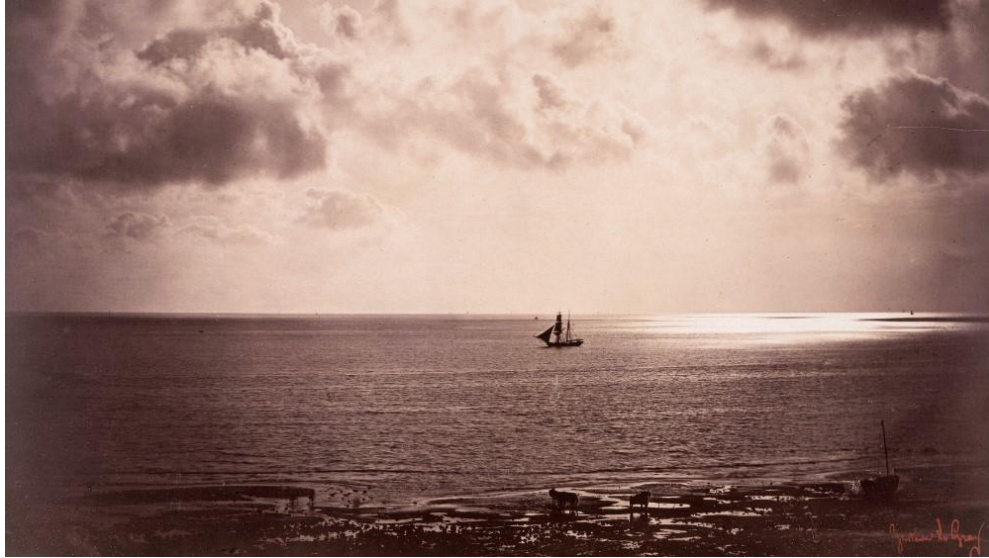
▲ 法國攝影師 Gustave Le Gray ( 1820-84 ) 的作品《The Brig on the Water 水上的雙桅橫帆船》· 攝於 1850 年代