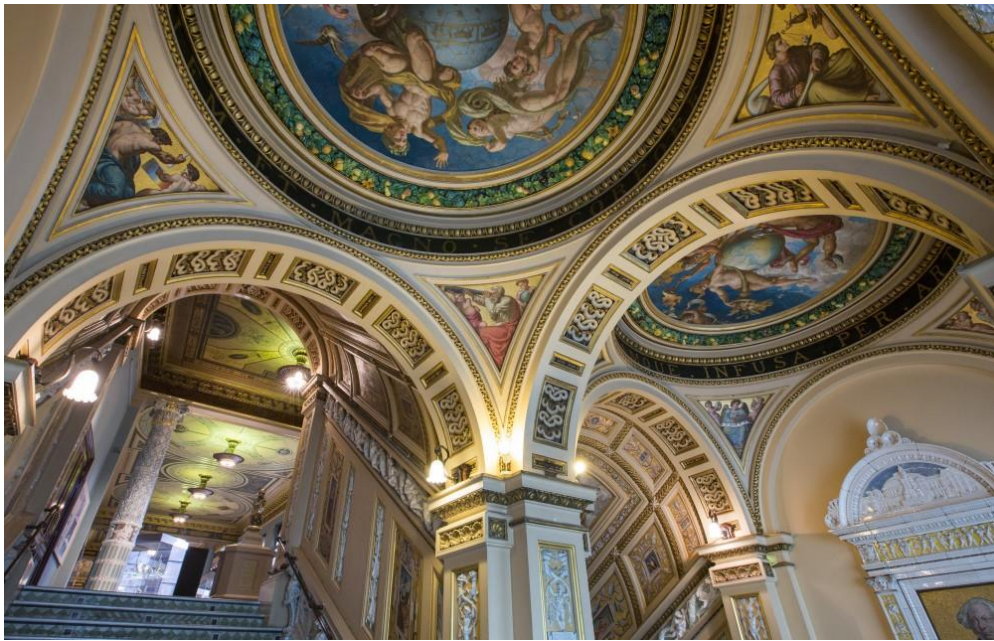
▲ V&A 的陶瓷樓梯