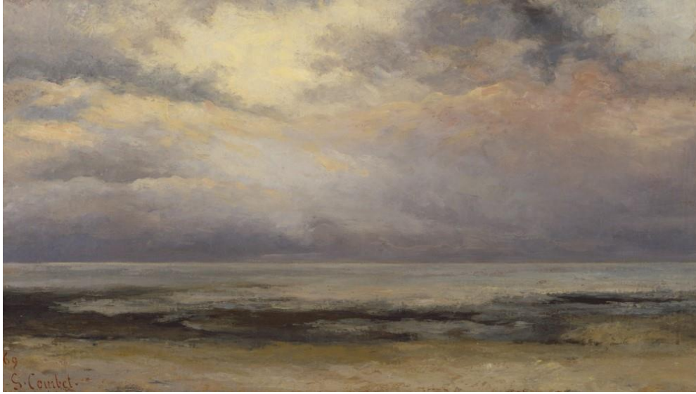
▲ 法國藝術家 Gustave Courbet ( 1819-77 ) 於 1869 年完成的作品《L'immensité 浩瀚》

V&A 推行的授權計劃，如何以博物館使命為基礎，讓藝術走進眾人的生活，並激發璀璨的創意火花？