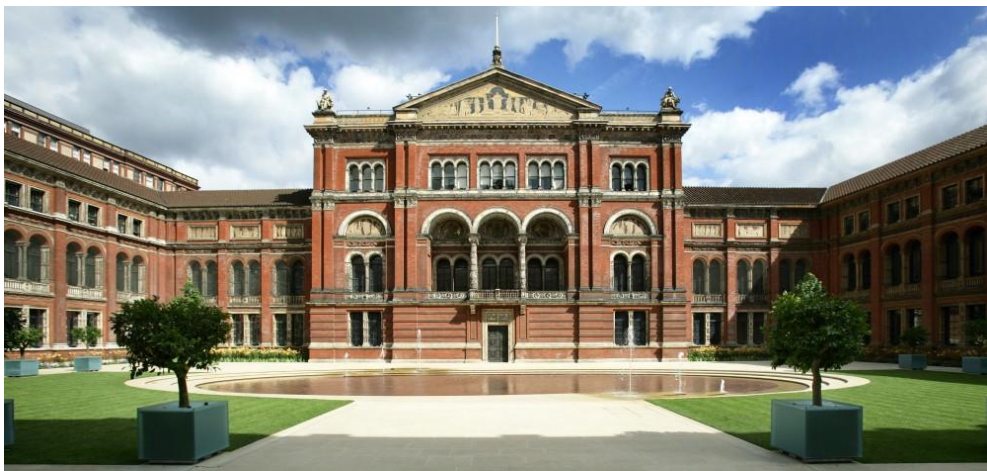
▲ V&A 的約翰·馬德伊斯基花園