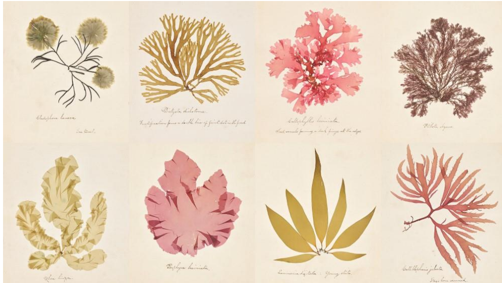
▲ 海藻標本，英國，1878 年

《London by Gaslight 煤氣燈下的倫敦》是 Paul Martin 拍攝的單色照片，以 1896 年晚間的皮卡迪利廣場為主題。這張照片是英國皇家攝影學會的收藏品( Royal Photographic Society Collection )，該學會是 V&A 世界級攝影展覽的重要貢獻者，其部份收藏品展示於本館最新擴建的攝影中心。