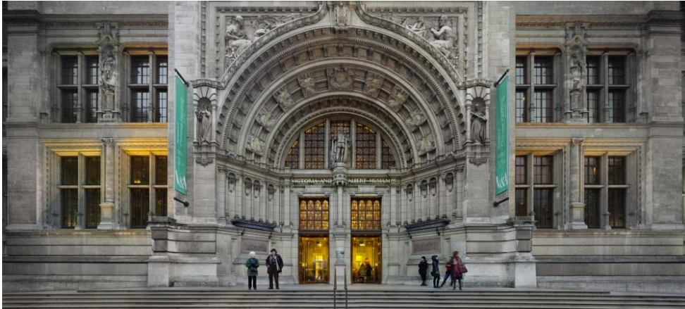
▲ 位於克倫威爾路 ( Cromwell Road ) 上的 V&A 入口處