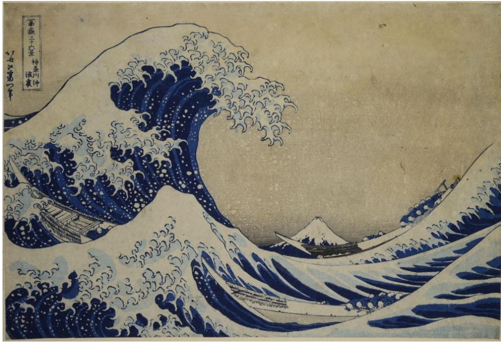
▲ 日本畫家葛飾北齋 ( 1760-1849 ) 的創作《神奈川沖浪裏》· 創作年份約為 1831 年