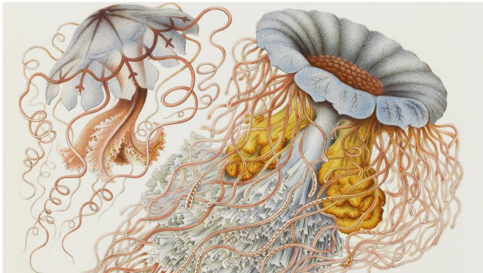
▲ Discomedusae - 水母 · 德國藝術家 Ernst Haeckel ( 1834-1919 ) 於 1899-1904 完成的《自然界的藝術形態》插畫圖鑒