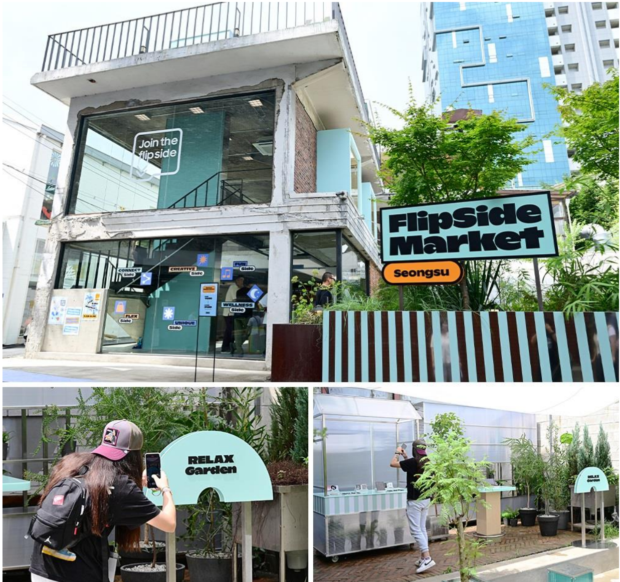
The Unique Side : 輕輕一觸，綻放率性自我