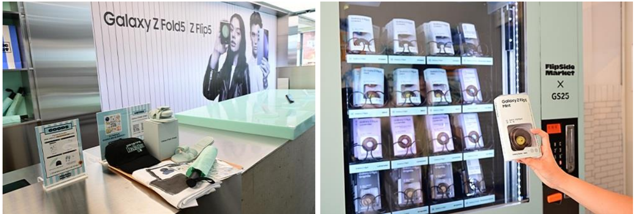
▲店內販售雨傘、拖鞋等摺疊型產品，以及 GS25 甜點與 Kim's Fruits 聯名商品

來賓可至 Flip Side Market DOOR to Seongsu 體驗 Galaxy Z Flip5 和 Z Fold5 的自拍和遊戲功能。此外，亦可買到 GS25 聯名的特製甜點。