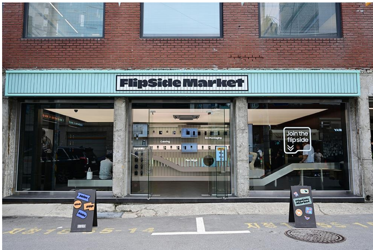
▲ Flip Side Market The Garden