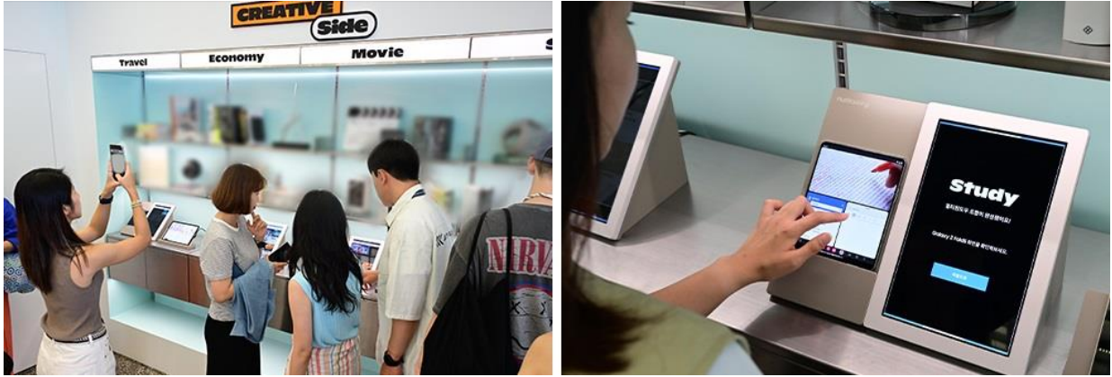
▲ 仿書店的「The Creative Side」專區人潮滿滿，來賓興奮探索 Galaxy Z Fold5 的多工效能