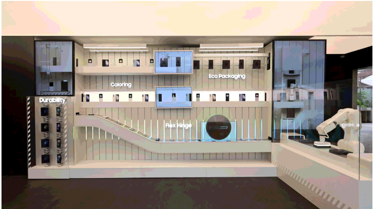
▲位於 Flip Side Market The Garden 入口處的創新巡禮 Innovation Monument

一踏進 Flip Side Market The Garden，最先映入來賓眼簾的是矗立於正中央的「創新巡禮」，它模擬工廠生產線的型態，揭示新型摺疊機的演進。「創新巡禮」致敬了 Galaxy Z Flip 和 Fold 系列背後的創新思維，展示裝置的製造過程，從新型 Flex Hinge 轉軸的應用、耐用性測試到最終推出的新色系，以及環保的可再生包裝。