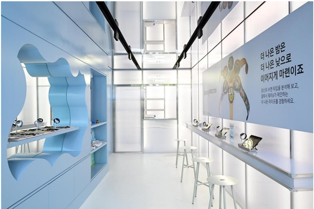
▲ 「The Wellness Side」專區的現場來賓，可一探 Galaxy Watch6 系列的進階睡眠功能

對個人睡眠習慣感到好奇的來賓，可前往「The Wellness Side」專區一探究竟。在來賓了解個人睡眠類型的過程中，該區將重點介紹 Galaxy Watch6 系列的睡眠教練計畫，以及 Galaxy Tab S9 系列的綜合睡眠分析。