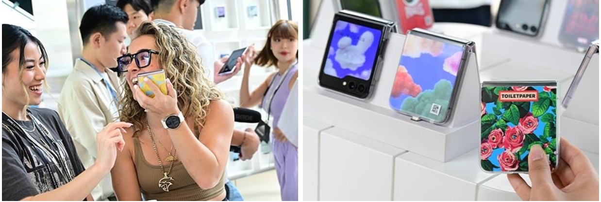
▲來賓開心探索 Galaxy Z Flip5 推出的 NFC 配件 - 主題式感應卡

在 The Unique Side 的一樓和二樓，來賓可利用基於 NFC 技術的全新主題式感應保護殼，為手中的 Galaxy Z Flip5 披上繽紛色彩。來賓挑選其中一款設計，並將更換式 NFC 感應卡貼近機背，封面螢幕將猶如圖案轉印自動變換封面動畫，呼應 NFC 的主視覺設計。用戶可恣意變換主題式感應卡，找出符合自我個性的裝飾配件。