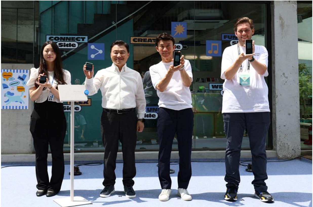
▲三星總裁暨行動通訊 (MX) 事業部負責人盧泰文 ( TM Roh )、副總裁 BongKu Kang、Galaxy 大專支持者與三星會員，現身聖水洞 Galaxy 體驗空間開幕式

Flip Side Market Seongsu 分為三大主題區，座落於聖水洞的三個不同場域。來賓的旅程始於 Flip Side Market The Garden，這裡展示了 Galaxy 摺疊手機的創新巡禮。接著，來賓可前往對面以市集型態打造的主場館 Flip Side Market Seongsu，探索一應俱全的最新 Galaxy 產品。