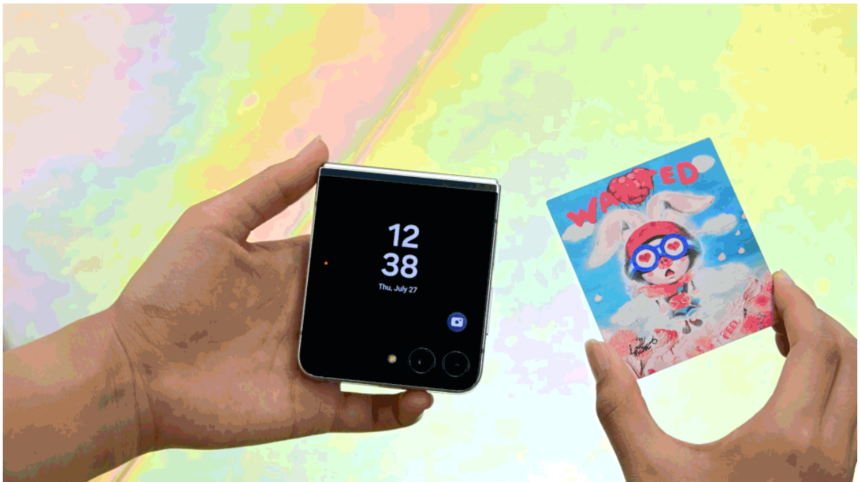
▲將更換式 NFC 感應卡貼近機背上，即可客製個人專屬的 Galaxy Z Flip5