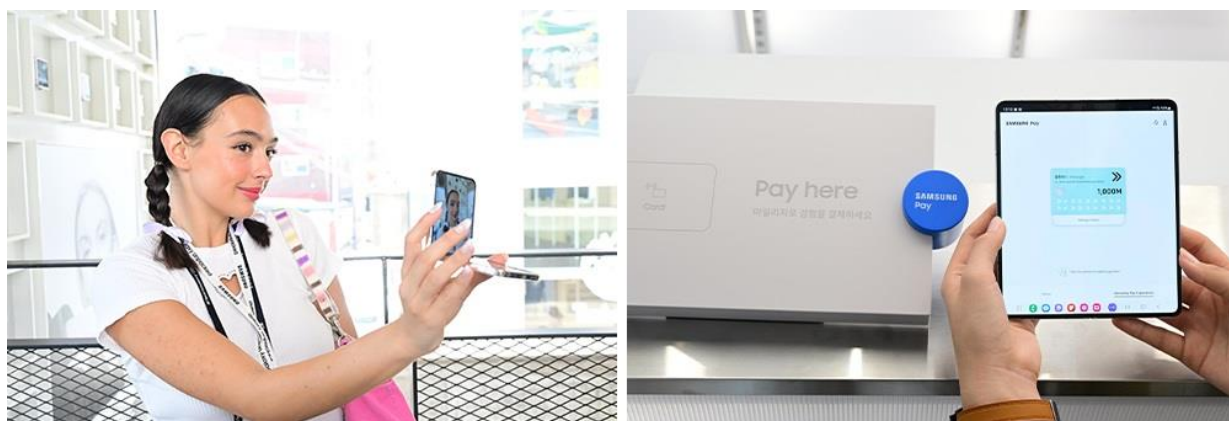
▲來賓以 Galaxy Z Flip5 和 Z Fold5 試用機自拍，並使用 Samsung Wallet 購物

親臨 Flip Side Market The Garden 的來賓，可從色彩繽紛的 Galaxy Z Flip5 或 Z Fold5 之中，挑選自己最喜愛的一款親手試用。亦可利用預載的點數選購各式各樣的方案，體驗 Samsung Wallet 的購物流程。此外，來賓也能以試用機購物。