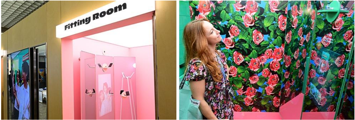
▲親臨 Galaxy Fitting Room 照相亭的來賓，在使用 Galaxy Z Flip5 的封面螢幕拍照時，可預覽鏡頭中的自己，並列印以 1200 萬畫素後置鏡頭拍攝的照片