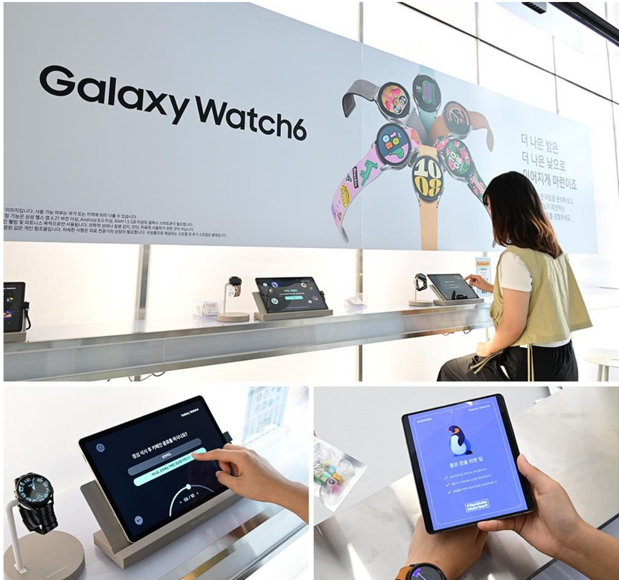
▲ 「The Wellness Side」專區的現場來賓，可藉由填寫問卷調查表， 找出代表其睡眠類型的動物，並獲贈相對應的糖果