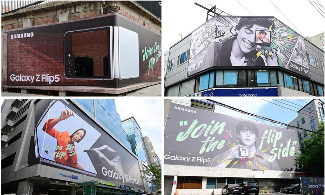
▲ 聖水洞 Galaxy Z Fold5 | Z Flip5 「Join the flip side」活動的視覺宣傳