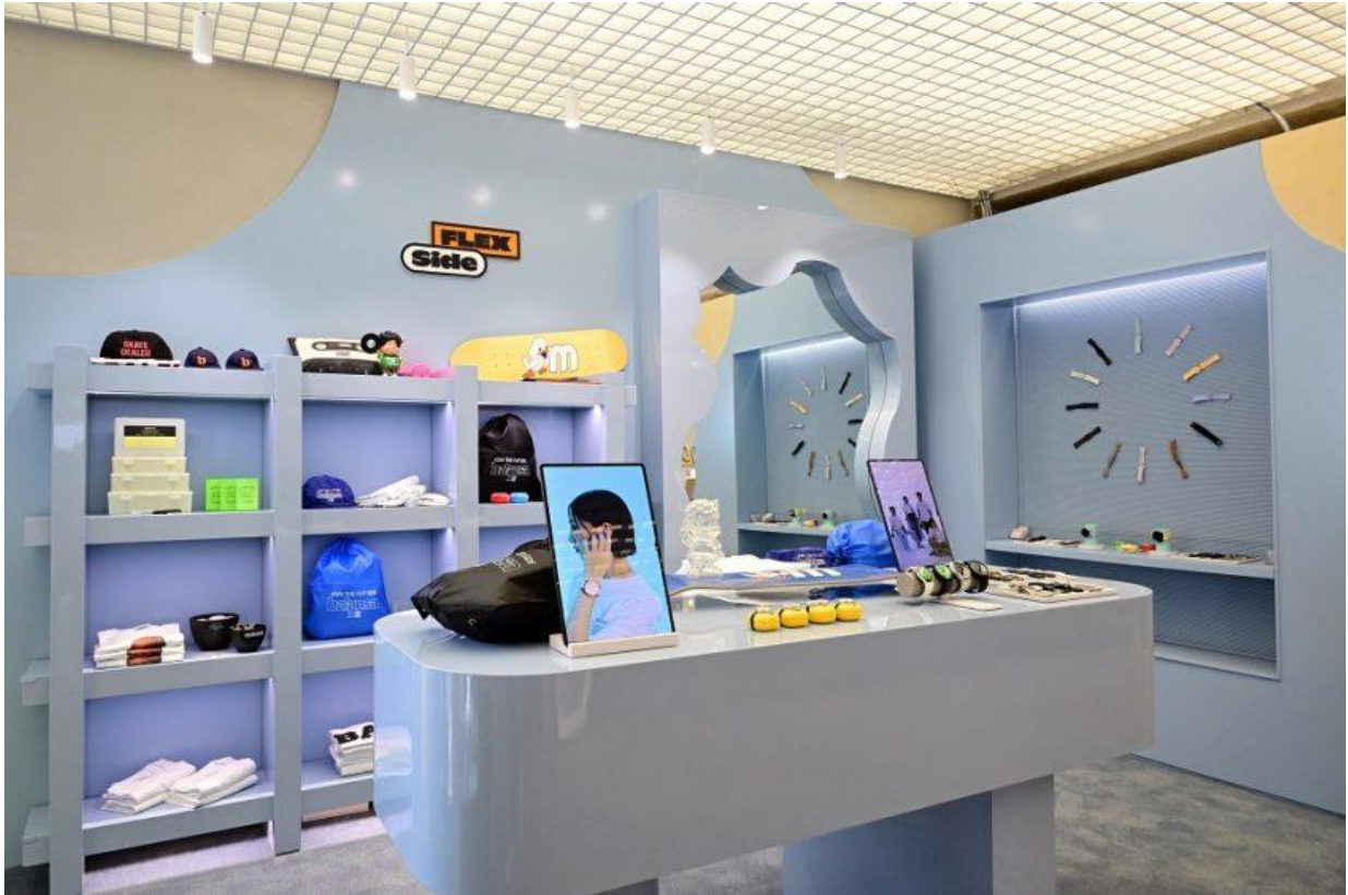
▲ The Flex Side 專區展示 Galaxy Watch6 系列的各式錶帶

位於二樓的 The Flex Side 專區，來賓可一窺 Galaxy Watch6 系列錶帶的多變風貌，為個人穿搭增添時尚色彩。來賓可戴上 Galaxy Watch6 系列產品，在自拍區的大鏡子前拍照，或試戴不同的錶帶，享受流行飾品專櫃般的購物體驗。