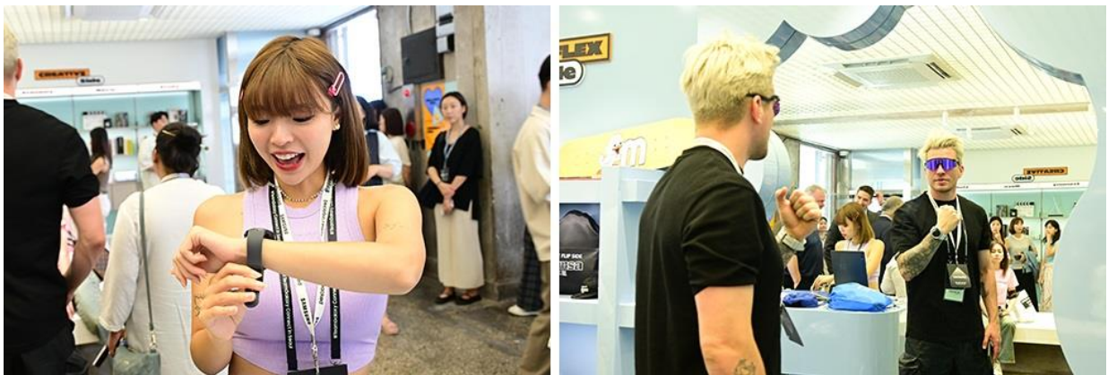
▲ 來賓可試戴 Galaxy Watch6 系列各式各樣的個性化錶帶，傳達自我時尚宣言

此外，來賓可在兩個仿更衣室造型的 Galaxy 拍照亭，試用 Galaxy Z Flip5 搭載的 1200 萬畫素的高解析度後置鏡頭、封面螢幕快拍和 FlexCam 功能。來賓可透過模擬雜誌封面、或三星與義大利創意工作室 TOILETPAPER 聯手打造的邊框造景，拍攝玩味十足的照片。