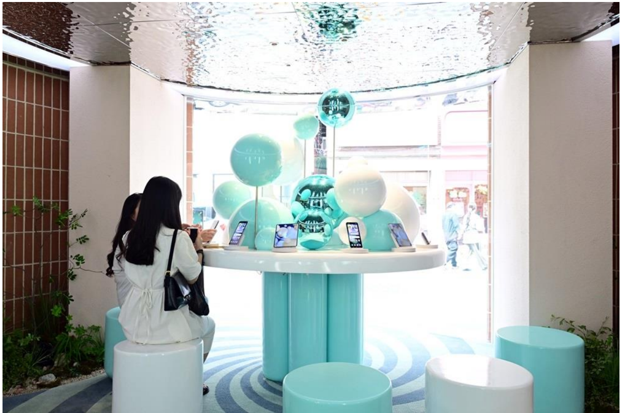
▲ ( 自上至下 ) Flip Side Market DOOR to Seongsu 及館內展示

來自新加坡的科技記者結束各展館的參觀行程後，發表個人感言：「參加三星於 COEX 舉辦的 Galaxy Unpacked 發表會之後，我迫不及待想一睹 Galaxy Z Flip5 風采。Flip Side Market 讓我透過創意方式體驗 Galaxy Z Flip5，堪稱一次美妙的經歷。」