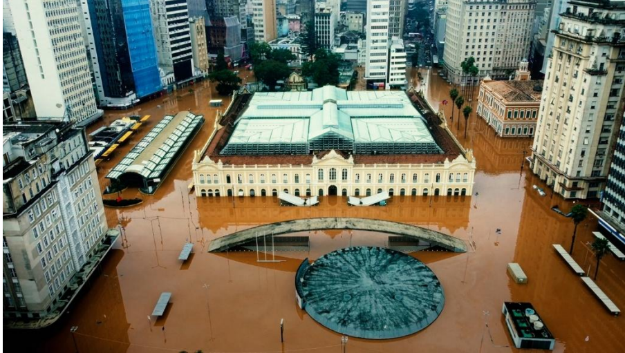
▲ 2024 年巴西南大河州的洪災影響近 240 萬人，並對阿雷格里港在內的 478 座城市造成嚴重破壞。

她回憶道：「我內心感到無比沉痛。看到許多小時候去過的場所，例如公園與博物館，全被摧毀。」