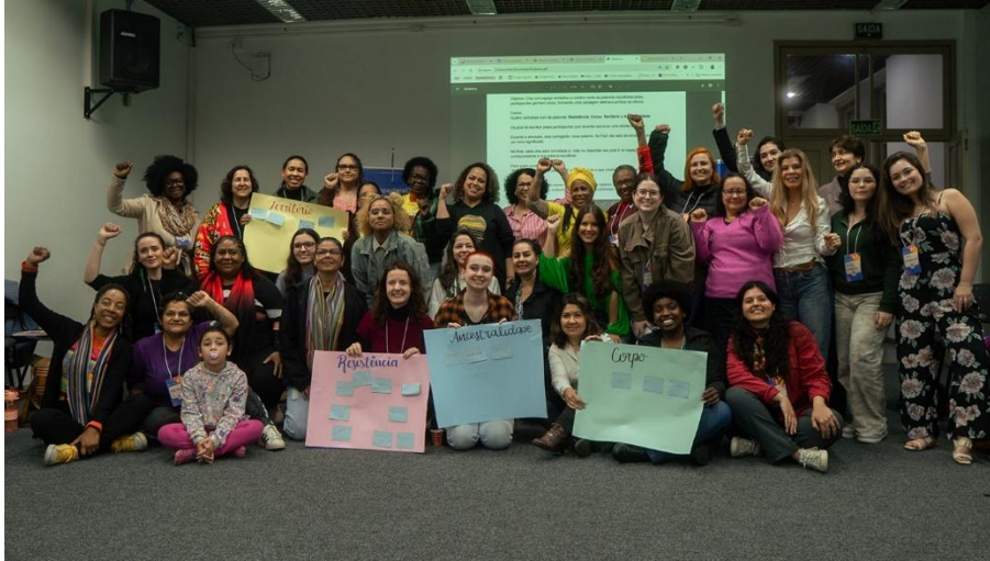
▲ 女性領袖參加 EmpoderaClima 的氣候復原力工作坊，學習面對未來氣候災害所需的技能與策略。