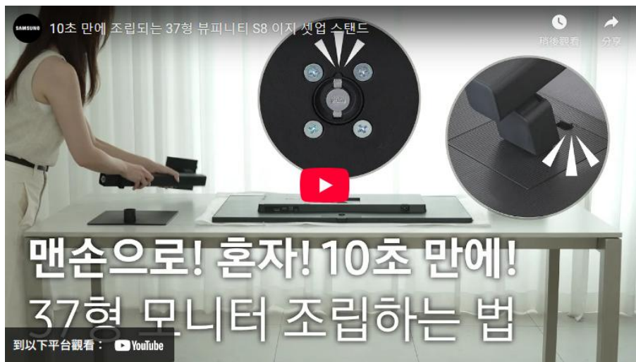
▲ 簡易安裝支架組裝僅需約 10 秒

使用簡易安裝支架 ( Easy Setup Stand )，即使是缺乏經驗的使用者，也能在約 10 秒內完成螢幕的組裝與安裝，且無需額外工具或螺絲。只要將支架固定於底座並旋轉 90 度鎖定，接著滑入螢幕背面即可完成。