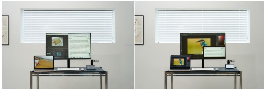
▲（由左至右）ViewFinity S8 的 PBP 模式與 PIP 模式

顯示器支援多裝置連線，內建鍵盤、視訊與滑鼠（KVM）切換器。讓使用者能以單一組週邊裝置同時控制兩台裝置，而分割畫面（picture-by-picture，PBP）與子母畫面（picture-in-picture，PIP）功能則強化了多工作業能力。