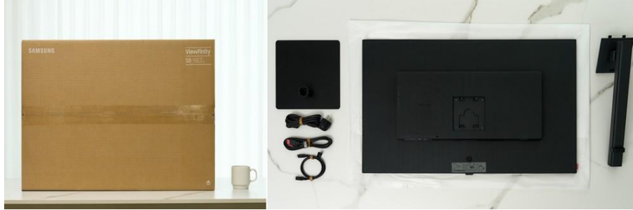
▲ ViewFinity S8 以便捷設計帶來從開箱到使用皆無憂的安裝體驗

使用簡易安裝支架 ( Easy Setup Stand )，即使是缺乏經驗的使用者，也能在約 10 秒內完成螢幕的組裝與安裝，且無需額外工具或螺絲。只要將支架固定於底座並旋轉 90 度鎖定，接著滑入螢幕背面即可完成。