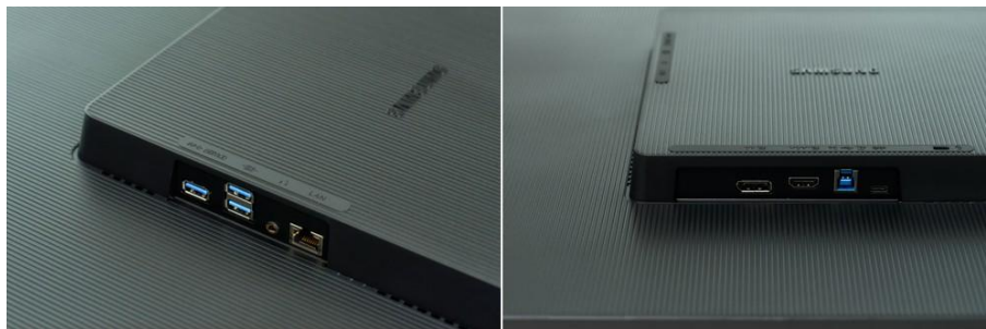
▲（由左至右）ViewFinity S8 的左後側連接埠與底部連接埠。

螢幕配備 USB-C 連接埠與內建 LAN 連接埠，支援 90W 充電、同步資料傳輸與乙太網路連接，打造更高效且具彈性的工作環境。