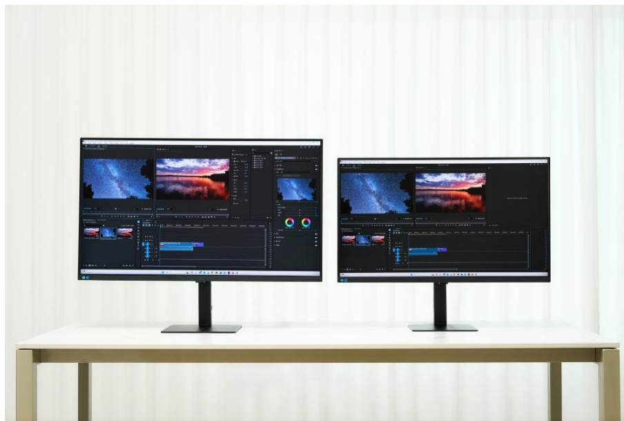
▲ (由左至右) 37吋 ViewFinity S8 與 32吋 ViewFinity S8 對照, 影片編輯顯示更精細的細節

對細節要求嚴謹的工作 (如影片編輯) 需要精準度與寬廣顯示空間, 37吋智慧聯網螢幕正好同時兼具。更大的尺寸讓細微之處清晰可見, 進而讓專案更具層次深度與精緻度。同時, 寬廣的工作區域讓使用者能並排開啟多個來源影片與資料夾, 大幅簡化創作流程。