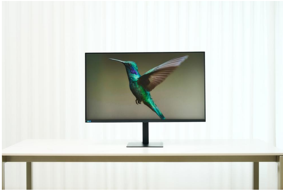
▲ ViewFinity S8，全球首款 37 吋智慧聯網螢幕

三星擴大 ViewFinity S8 ( S80UD 型號 ) 產品陣容，推出全球首款 37 吋 (註一) 機型，為適用於工作環境中的智慧聯網螢幕樹立新標準。這款全新中型尺寸的顯示器補充了現有的 32 吋和 43 吋選項，具備卓越的易讀性、最佳觀看距離與舒適視野。三星新聞中心深入解析 ViewFinity S8，展示其最新外觀設計的優勢。