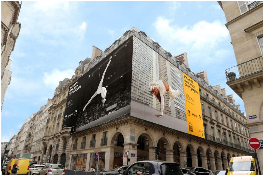
▲ 羅浮宮金字塔：75001 巴黎市聖多諾黑路 187 號

Simon Depardon 表示，「非常榮幸能參與此次策展，這是我人生中第一次將拍攝心血與父親的作品聯袂展出，此創作不僅記錄四位在各自領域出類拔萃的法籍選手，同時我也想透過影像傳達每位運動員的人格特點。Galaxy S24 智慧型手機擁有出色性能，為我們開啟許多藝術創作的機會，並與這座城市並肩同行。」