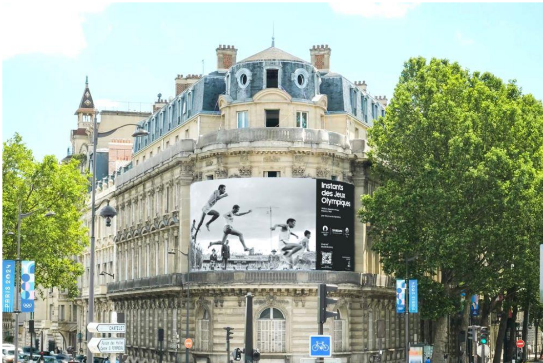
▲協和廣場：75006 巴黎市聖日耳曼大道 288 號

「奧運精彩畫面隨拍隨傳 #withGalaxy ( Olympic Games Instants Shared #withGalaxy ) 」活動現已於巴黎各大著名景點展出，介紹三星 Galaxy 團隊之際，齊力讚頌耀眼花都指標性建築及賽事之美