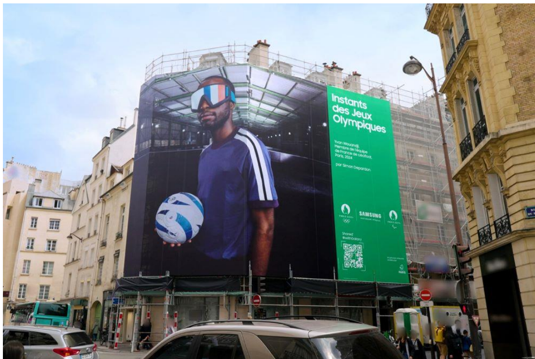
▲聖日耳曼：75006 巴黎市波拿巴路 51 號