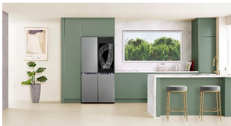
2024 Bespoke 4 門 Flex™ 冰箱 AI Family Hub™+ 機型展示圖。

此外，用戶可藉由 Tap View (感應連結) (註七) 功能將 Galaxy 智慧型手機輕鬆投放到 Family Hub™ 螢幕，大幅提升便利性；亦可在冰箱螢幕上打開 YouTube，獲得更多資訊並暢享娛樂體驗。