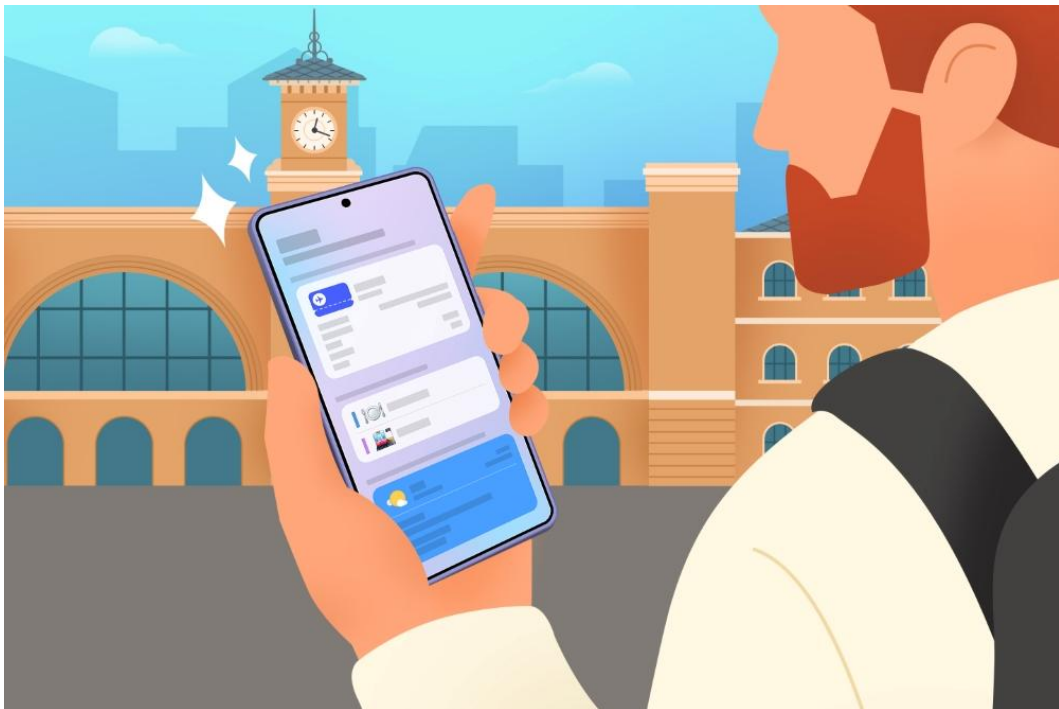
▲ Samsung Care+ 的全方位保障服務，為 Galaxy 用戶帶來更安心的使用體驗

憑藉 Samsung Care+ 完整的服務網路與專業支援，即使旅途中發生意外，也能迅速獲得協助。原本可能打亂期待已久假期的小插曲，也因此化為旅程中的短暫意外。Samsung Care+ 為旅途提供更全面的安心保障，讓用戶能更專注於享受當下，留下美好回憶。