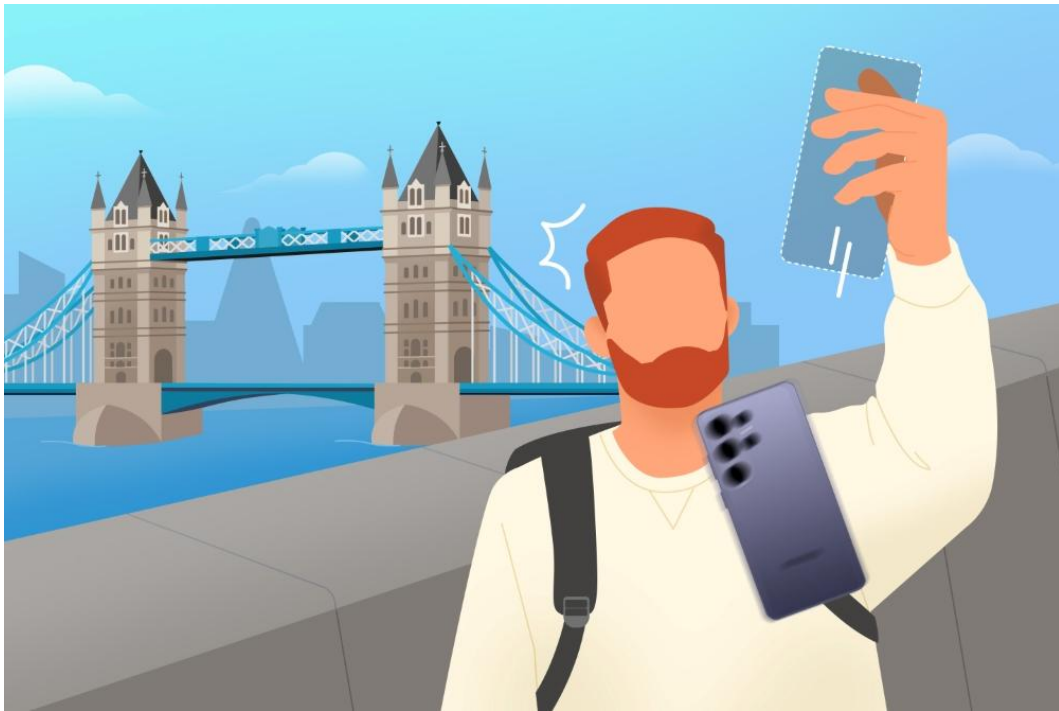
▲ 旅途中發生裝置意外損壞，可能讓旅程瞬間陷入焦慮

這幾乎是每位旅人最害怕發生的情況，但類似意外其實比想像中更常見。根據 Samsung Care+ (註一) 數據顯示，七月與八月的理賠申請量較全年平均高出 30% (註二) 。當手機儲存著登機證、飯店預訂資訊與導航地圖等重要資料時，一旦裝置損壞，甚至可能打亂整趟旅程。