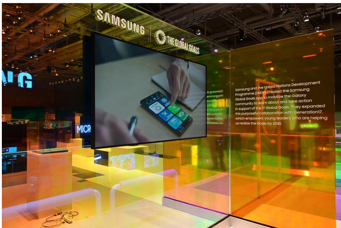
▲ 為在 2030 年前達成三星全球目標，三星與聯合國開發計畫署 ( UNDP ) 合作展開數項計畫，包括開發 Samsung Global Goals 應用程式以及啟動 Generation17 計畫等。