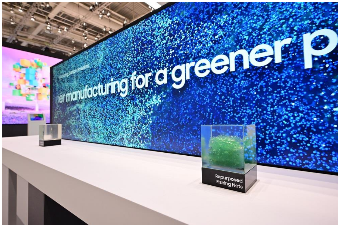
▲「永續日常區」展示三星為提升產品永續性，將裝置依據製造、配銷、使用與報廢的生命週期階段進行分類等努力。此外，展區也介紹包含 Galaxy Upcycling 升級再造計畫、環保包裝、太陽能電池遙控器等三星 10 大環保行動。