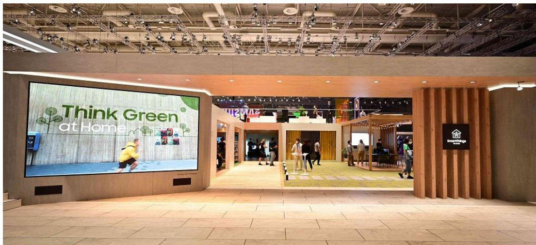
▲ 三星「SmartThings Home 展區」邀請參訪者體驗如何借助整合家電與裝置，實踐更為環保的日常生活。