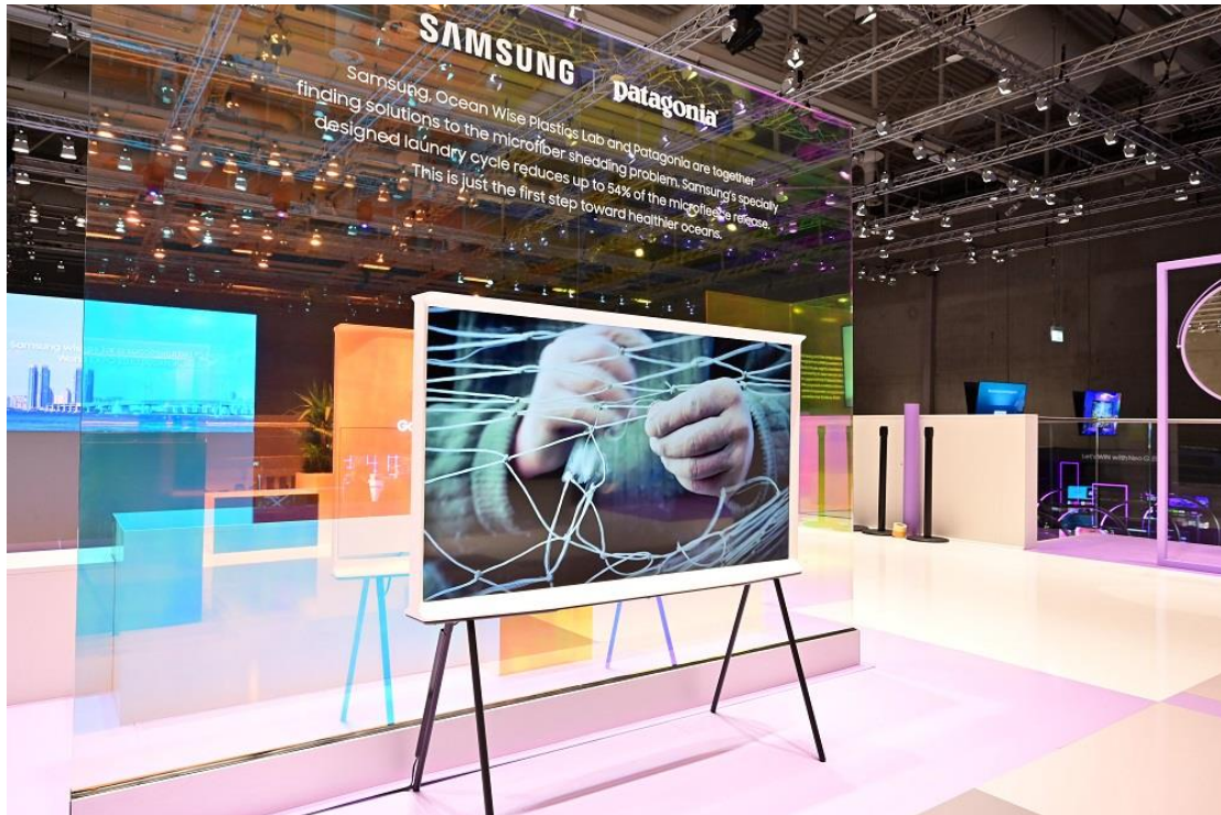
▲ 三星與全球戶外品牌 Patagonia 合作打造全新 Bespoke 洗衣機，有效減少塑膠微粒影響。