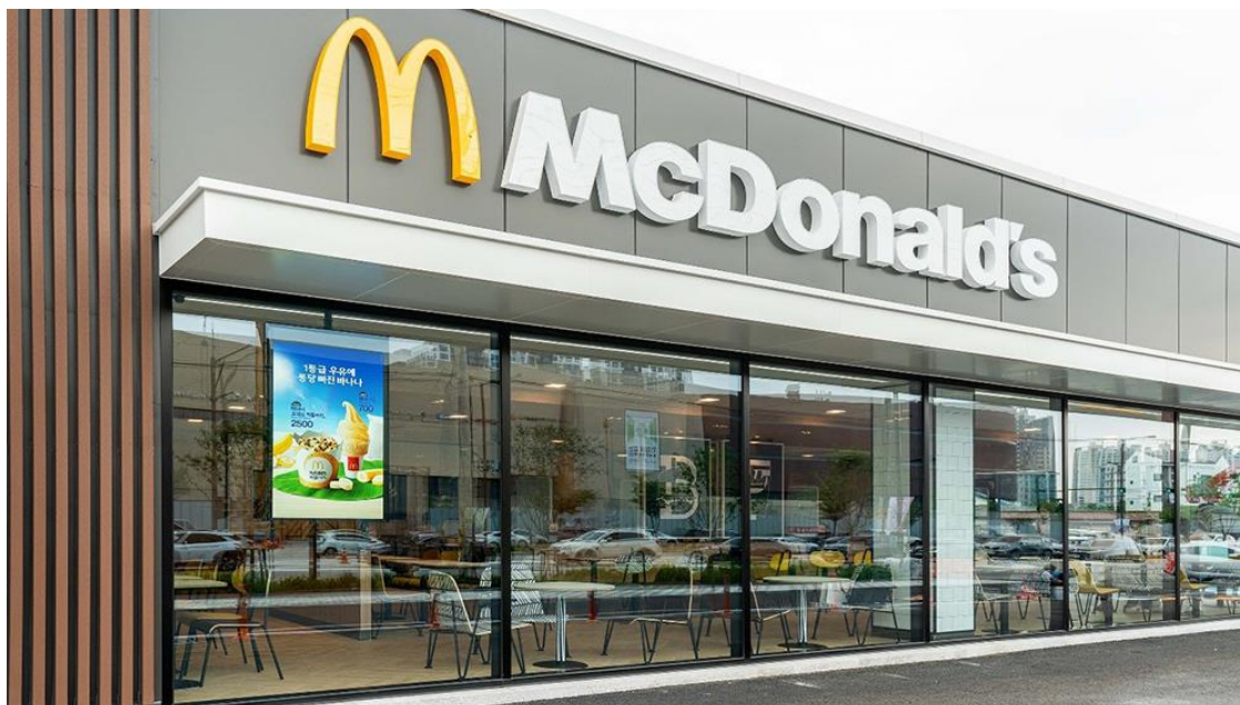
安裝於南韓麥當勞門市的三星大型商用顯示器 SMART Signage

數位顯示器的優點不勝枚舉，除了美觀度提升，在把關企業荷包、為看板注入百變的靈活性，以及實現真誠與互利的消費者關係上，大型商用顯示器是最具效果與效率的解決方案。隨著資訊時代的不斷發展，三星大型商用顯示器為零售業者提供絕佳平台，使其成為消費者溝通領域的佼佼者。