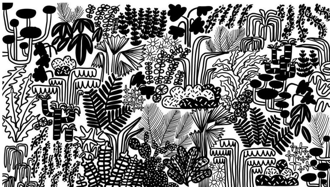
▲ 《植物牆》( 2020 )