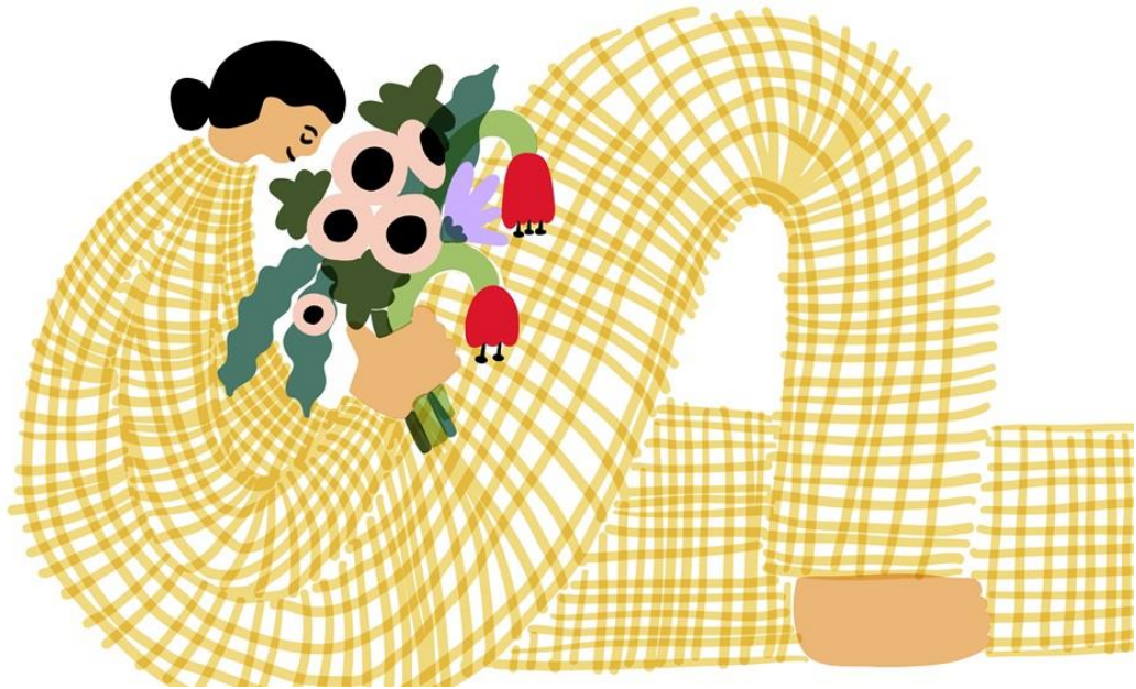
▲ 《九月綻放》( 2023 )