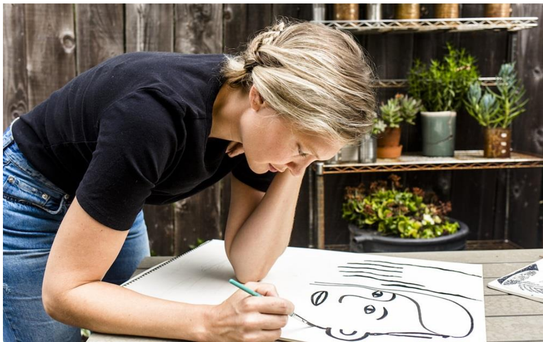
▲ Carissa Potter

她渴望有意義的連結在她的作品中表露無遺，藉由文字與繪畫的結合，創作出打動觀眾的作品。三星新聞中心專訪 Carissa Potter，談到她的藝術之旅以及她如何透過藝術與人們連結。