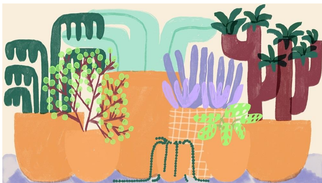
▲ 《植物家族》( 2024 )