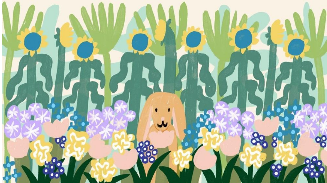
▲ 《兔子之戀》( 2024 )

冬天結束時，我們尋找新的生命、能量與活力，以及值得慶祝和期待的事物。《兔子之戀》和《獻給母親的花》皆呈現出我們的渴望，並提醒我們未來將發生的事。季節性儀式對於理解時空非常重要，這些意像在很多方面告訴我們正處在正確位置，無須漂流。