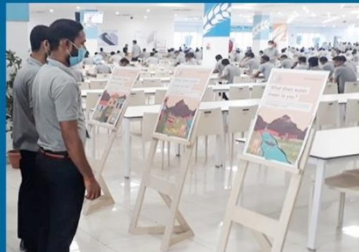
*印度、墨西哥、波蘭、巴西、埃及、南美三星電子