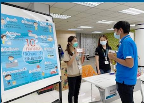
*越南、泰國、印尼、中國、斯洛伐克、俄羅斯、墨西哥、波蘭三星電子