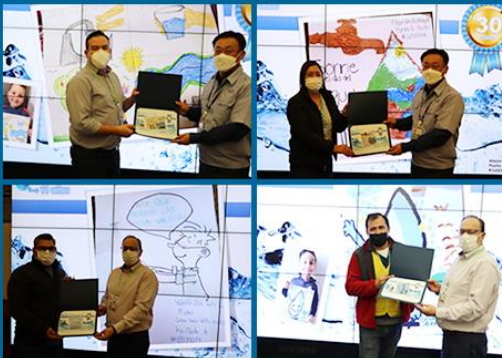
*印度、墨西哥、匈牙利、俄羅斯、美國三星電子