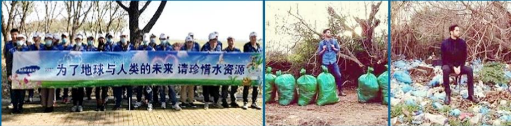
*越南、中國三星電子