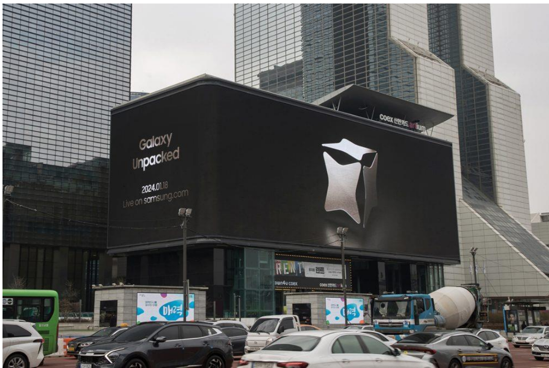
▲ 1 月 5 日在韓國首爾 COEX 展示的 Galaxy Unpacked 2024 數位戶外廣告看板。

三星藉此活動誠摯邀請全球觀眾探索行動創新打造的極致體驗，更即將顛覆用戶既有的生活、聯繫與創作方式。請點擊下方影片連結先睹為快，感受發表會風采，並準備好在 台灣時間 1 月 18 日的 Galaxy Unpacked 2024 中，見證三星前所未有的絕妙鉅作。