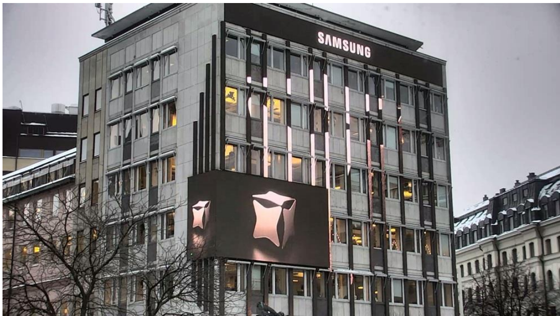
▲ 1月5日在瑞典斯德哥爾摩 Stureplan 廣場展示的 Galaxy Unpacked 2024 數位戶外廣告看板。