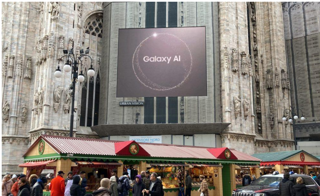
▲ 1月5日在義大利米蘭主教座堂廣場 ( Piazza del Duomo ) 展示的 Galaxy Unpacked 2024 數位戶外廣告看板。