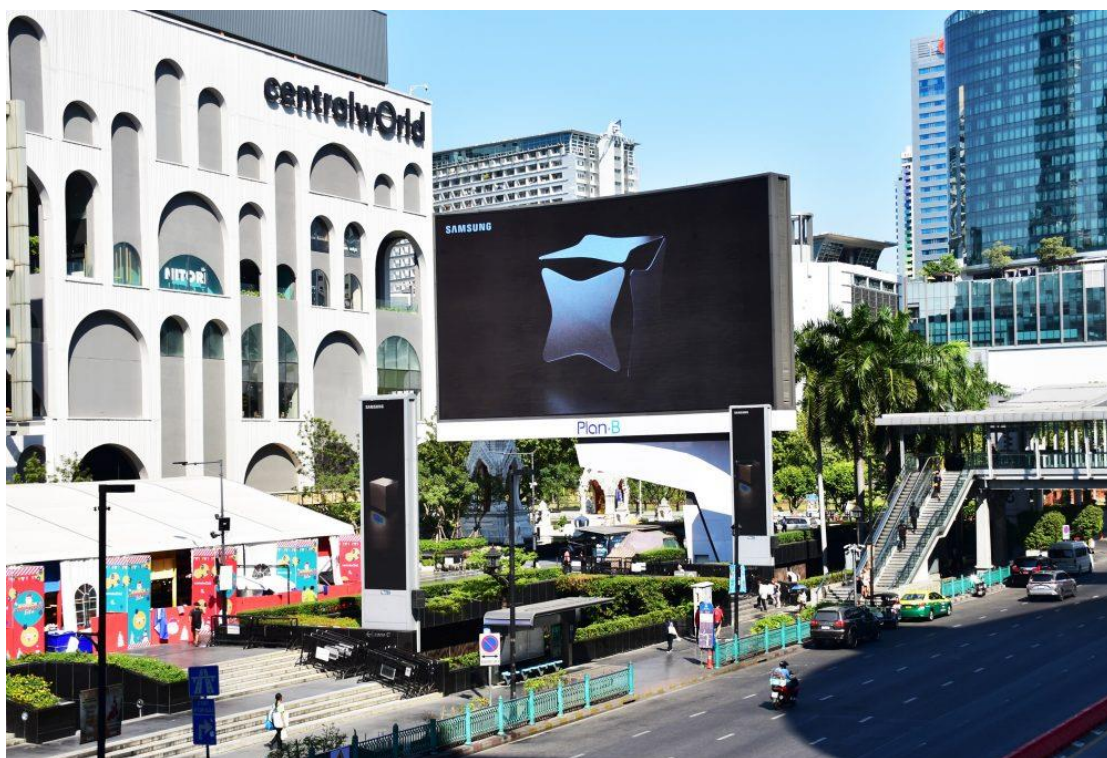
▲ 1月5日在泰國曼谷 CentralWorld 百貨展示的 Galaxy Unpacked 2024 數位戶外廣告看板。