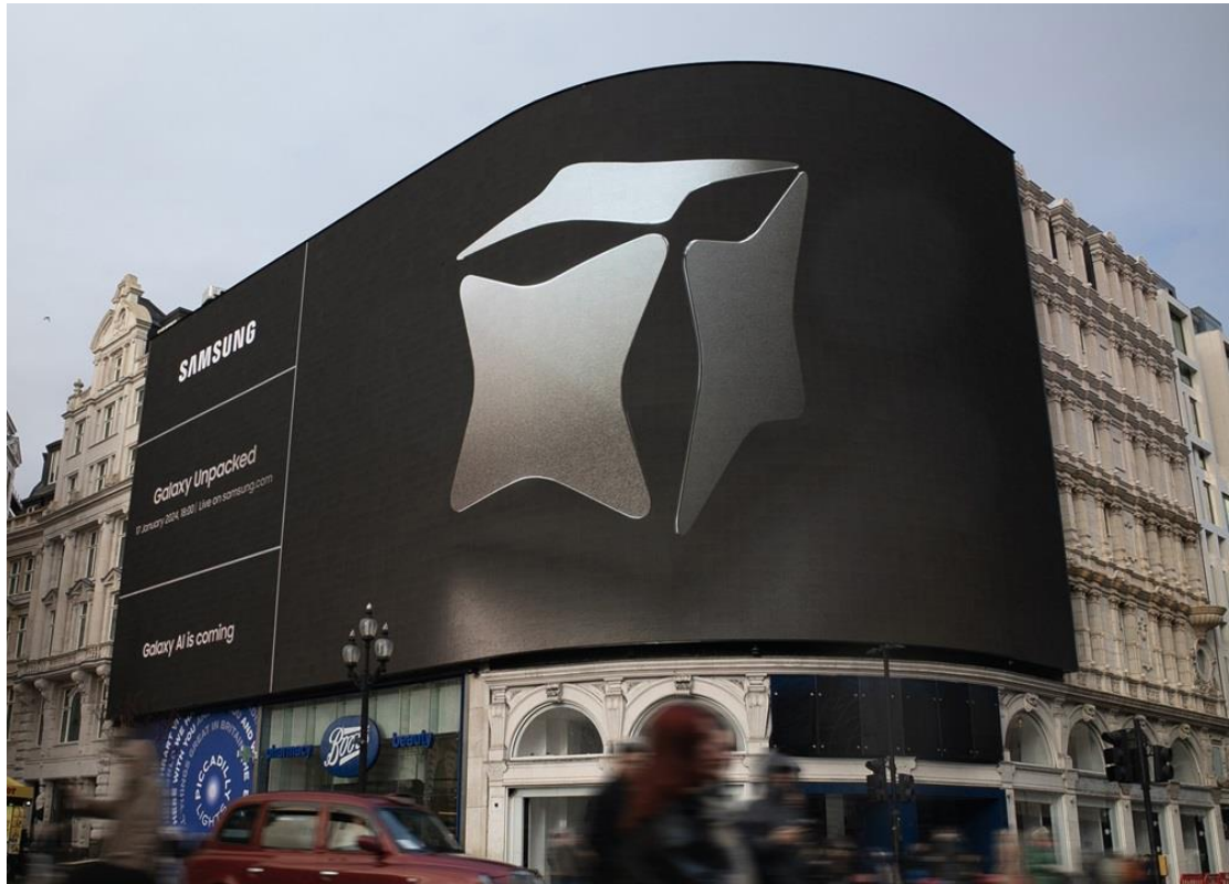
▲ 1月5日在英國倫敦皮卡迪利圓環（Piccadilly Circus）展示的 Galaxy Unpacked 2024 數位戶外廣告看板。