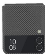
黑色 Aramid 保護殼