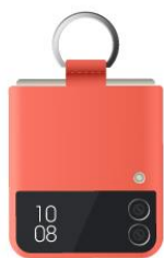
珊瑚橘矽膠薄型背蓋 (附指環扣)