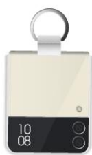
透明保護殼 (附指環扣)