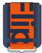
藍色矽膠薄型背蓋 (附指環帶)