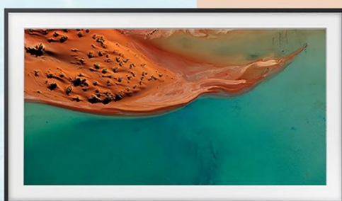
《沙》(Sand · 2016)