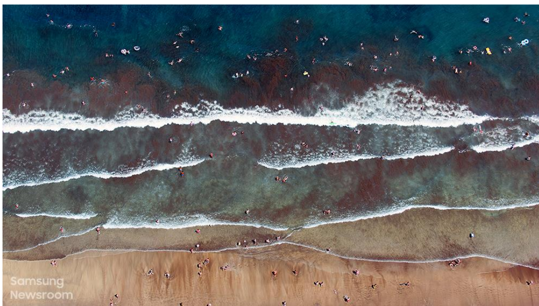
▲ 《海灘海岸線》( Playa Shoreline · 2015 )

而科技即為確保色彩能忠實呈現的幕後功臣。The Frame 美學電視透過量子點技術呈現 100% 色域，不僅可顯示逼真色彩，更能忠實傳達藝術家的理念。Clarke 表示：「過往我習慣使用世界頂級印表機與博物館等級的紙質，因此當我首次透過 The Frame 美學電視看到自己的作品時，我震懾不已。極致的色彩呈現，就如同實體照片。」