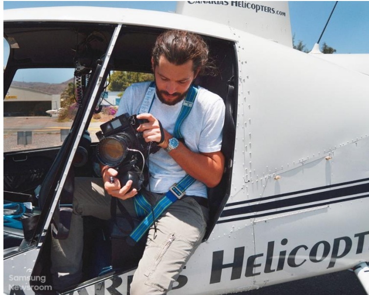
▲ 攝影師 Tommy Clarke