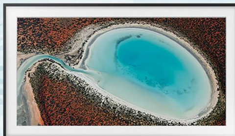
《潟湖》(Lagoon · 2016)