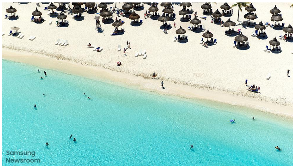
▲ 《竹製陽傘》( Bamboo Parasols · 2019 )

藝術市集八月主題為「野性自由」( Wild and Free )，主打世界知名攝影師 Tommy Clarke 的空拍作品，引領觀眾飽覽如夢似幻的優美景色。三星新聞中心與 Clarke 進行訪談，深入了解他的創作歷程與作品。