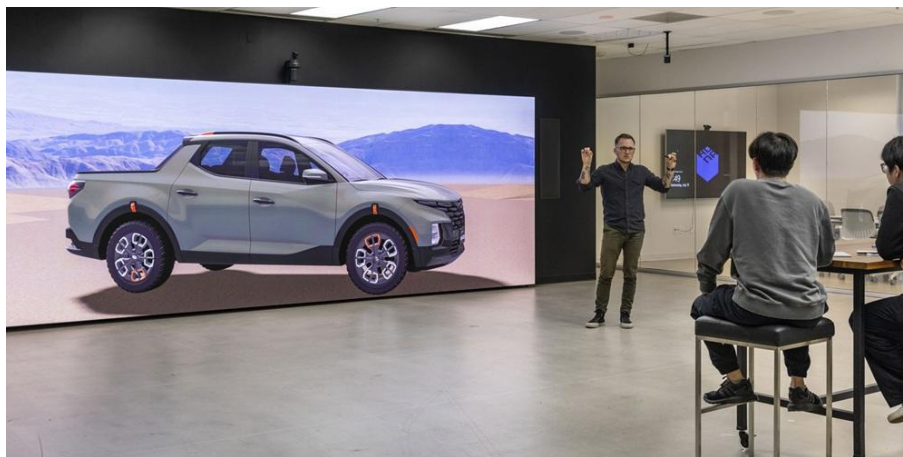
▲ 位於密西根州 Hyundai 美國技術中心的 The Wall

在密西根州 Hyundai 美國技術中心 ，Hyundai 與三星合作改造大廳與工作空間。最終成果為配置三星模組化 MicroLED 顯示器 The Wall，成為其北美總部的視覺焦點。在 CEC 實際體驗與配置 The Wall，協助 Hyundai 將設計願景與技術需求相符，從而簡化決策流程並降低導入風險。