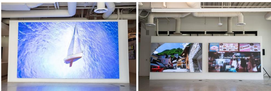
▲ 爾灣 CEC 展示多款不同像素間距的 LED 顯示解決方案

最新案例展現了這種體驗的強大影響力。原本單純為了比較 98 吋顯示器而來的參觀，很快延伸為更宏觀的願景：「客戶最終擴展規劃了七面 LED 牆，應用於會議室、展示中心與安全營運中心。客戶在我們的顯示器上看到自家的影像與影片時，尤其是 0.9mm COB (Chip On Board) LED，進一步看見了全新商機。親身體驗這項技術，使人更能清楚理解先進顯示器如何重塑空間並提升使用者體驗。」