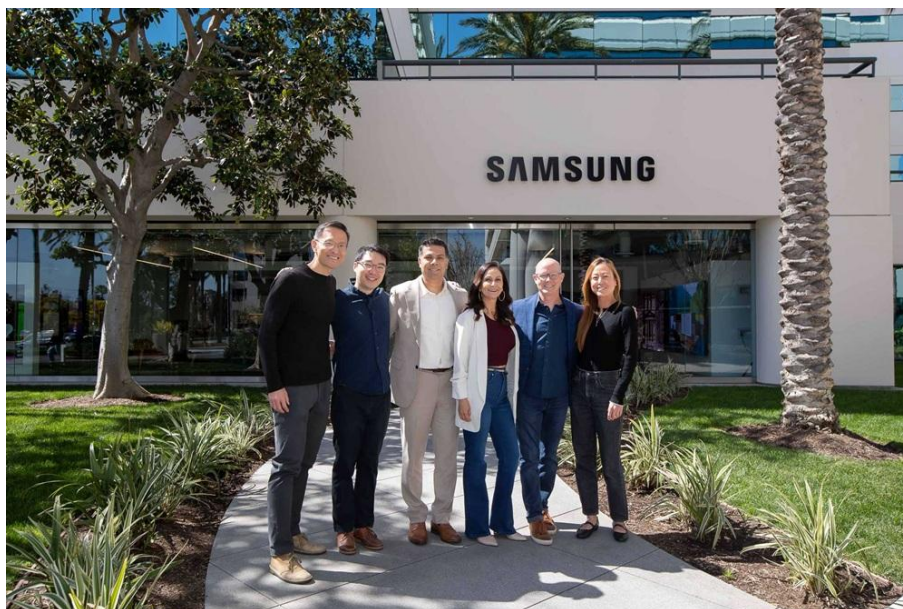
▲ 爾灣 CEC 團隊專注於理解每位客戶的需求，並提供能發揮最大效益的解決方案

這些案例彰顯 CEC 如何同時支援企業與個人，協助他們體驗、評估並展現三星顯示創新的完整潛能。CEC 的價值在於其團隊與流程。透過培育合作展望更多可能、驗證未來發展，並部署能夠推動實際成果的解決方案。