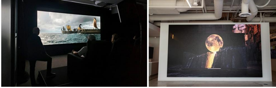
▲ 爾灣 CEC 設有一面全新 5 公尺 Onyx Cinema LED 螢幕，已於 2025 年 7 月揭幕（左圖），以及配置 The Wall for Virtual Production

CEC 亦為創意、行銷與技術團隊提供資源。客戶可在 CEC 親身體驗最新 Onyx Cinema LED 的卓越效能，或透過 Vu One Mini 測試虛擬製作流程，探索全新的敘事可能性，並能上傳客戶提供的素材以進行操作。這些實際體驗能讓創意與技術決策者能在最終採購前，更全面地評估相關技術。