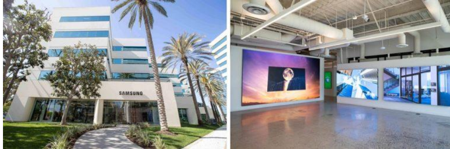
▲ 三星加州爾灣互聯體驗中心

為企業規劃顯示器展示空間並非易事。展示空間在營造氛圍與引導現場互動上具有關鍵影響力。然而，每家企業都有其獨特需求，面對眾多的選項往往難以抉擇。三星在全球各地設立的專業顯示器展示中心，透過多元的顯示解決方案與設計經驗，協助企業在規劃展示空間時做出最佳選擇。