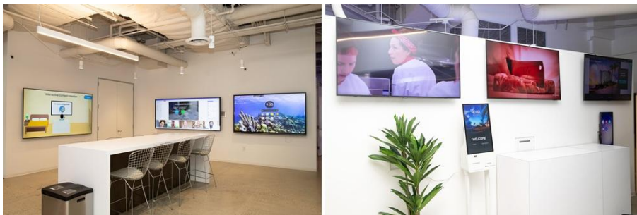
▲ 爾灣 CEC 旅宿業專區展示 SmartThings Pro

Armar 表示：「爾灣 CEC 是一個理想的場域，可即時展示我們如何依照客戶需求量身打造顯示解決方案，並為其帶來實質價值。看到客戶在親身體驗我們的產品後，眼神中流露的信任，或許是我最喜歡的時刻。」