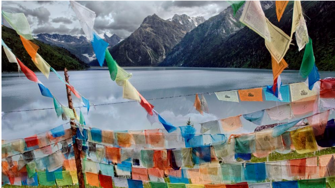
▲ 攝影作品《Prayer Flags》；2005 年攝於西藏。

我在印度喀什米爾的達爾湖畔，與花販度過了兩周時間。鮮花採買與饋贈，是當地的風俗民情，亦是生活美學與經濟不可或缺的一部分。花販的木船 shikaris (註一) 載滿盛開的鮮花，給人一種沉穩安定的寧靜感，與周圍城鎮的喧囂，形成鮮明的對比。