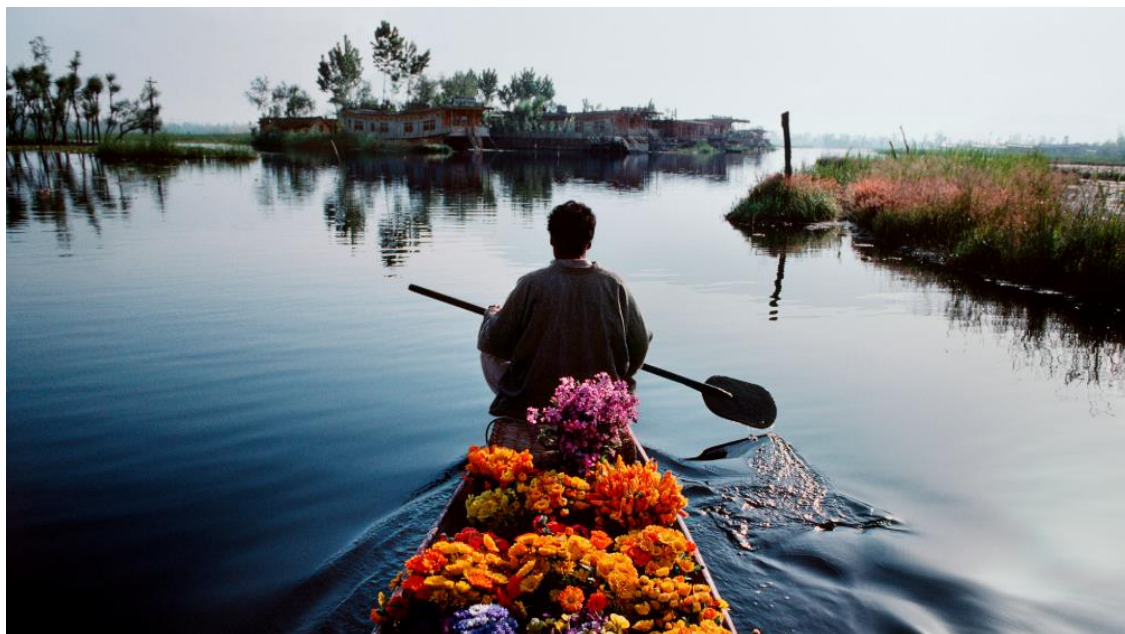
▲ 攝影作品《Dal Lake,》；1999 年攝於喀什米爾，斯里納加爾 (Srinagar)。

我在印度喀什米爾的達爾湖畔，與花販度過了兩周時間。鮮花採買與饋贈，是當地的風俗民情，亦是生活美學與經濟不可或缺的一部分。花販的木船 shikaris (註一) 載滿盛開的鮮花，給人一種沉穩安定的寧靜感，與周圍城鎮的喧囂，形成鮮明的對比。