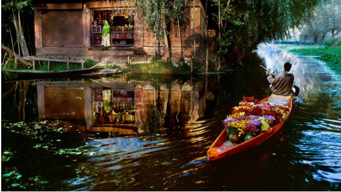
▲ 攝影作品《Boat in India》；1999 年攝於喀什米爾，斯里納加爾（Srinagar）。