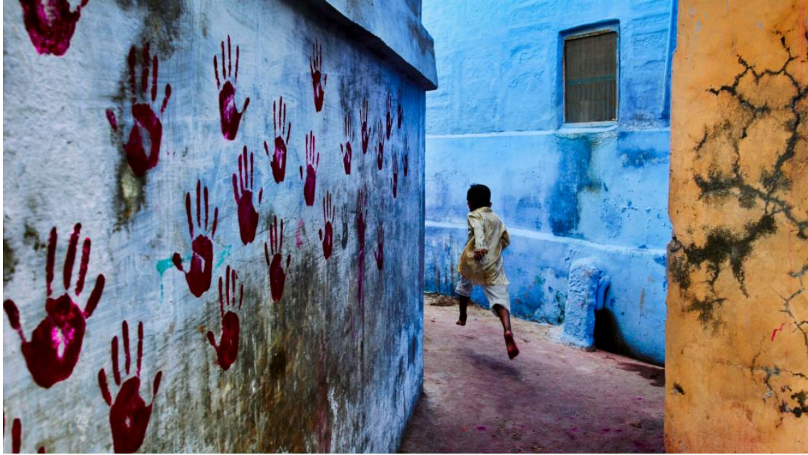
▲ 攝影作品《Boy Playing》；2007 年攝於印度，焦特布爾（Jodhpur）。