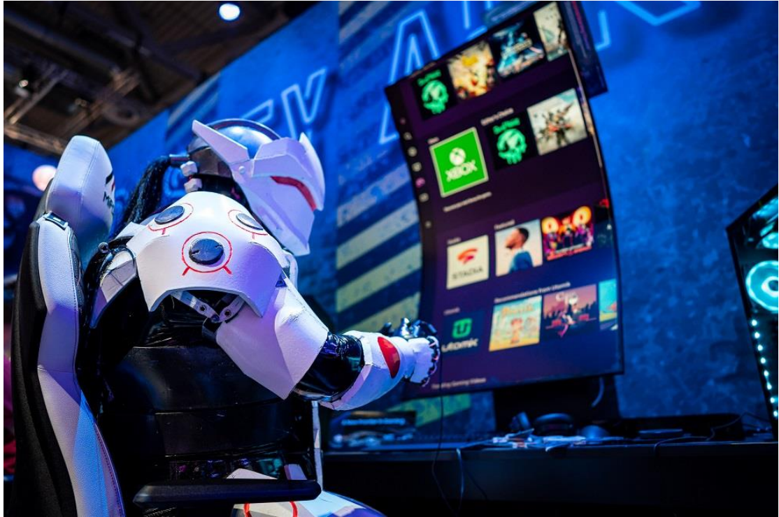
▲ Samsung Gaming Hub 屬於一站式平台，玩家不需外接遊戲主機、電腦或其它遊戲配備，就能暢玩雲端遊戲。參觀者正透過 Odyssey Ark 體驗 Samsung Gaming Hub。