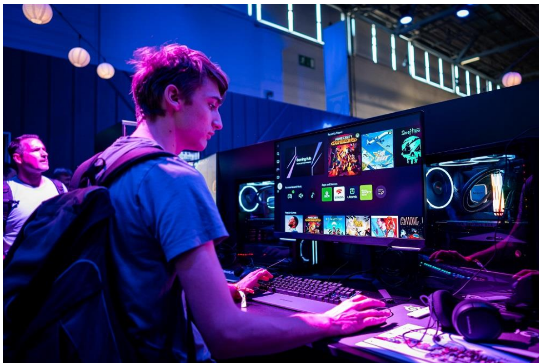
▲參觀者透過 Odyssey G7 ( G70B ) 與 Odyssey G6 ( G65B ) 體驗 Samsung Gaming Hub 。