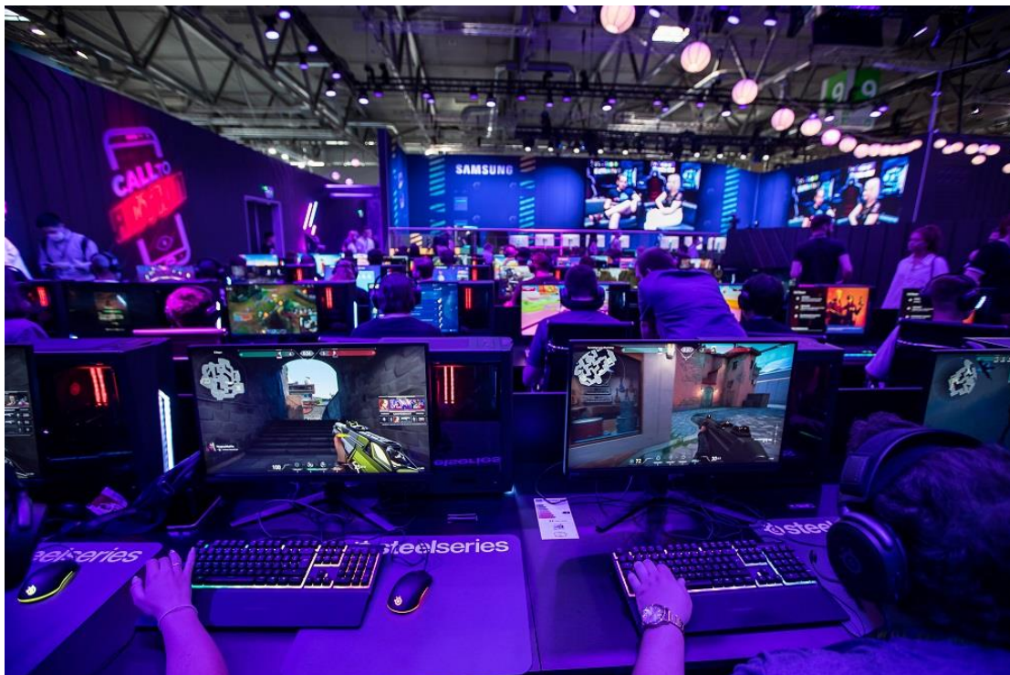
▲ Gamescom 2022 三星展館 Odyssey City 現場實況。三星精心規劃數個展區，讓參觀者親身體驗 Odyssey 系列產品，一窺三星電競螢幕的未來樣貌。