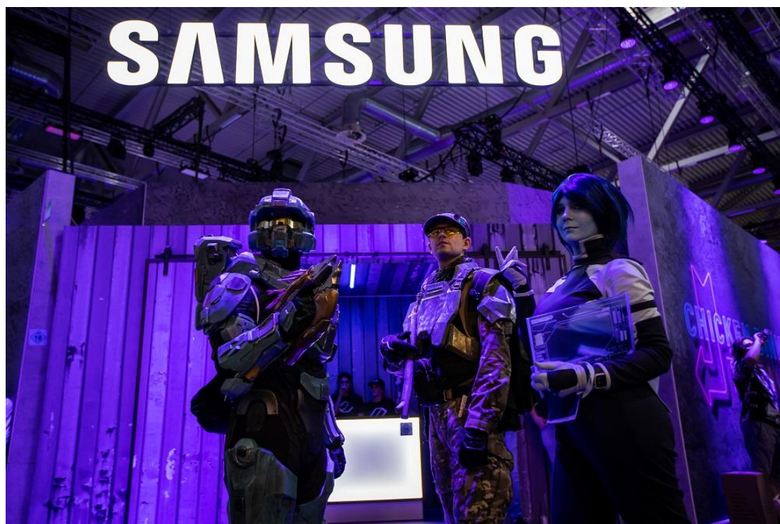
▲ Gamescom 2022 於科隆國際展覽中心的第九中央展廳舉行。Cosplayer 現身會場並於三星展館入口處合