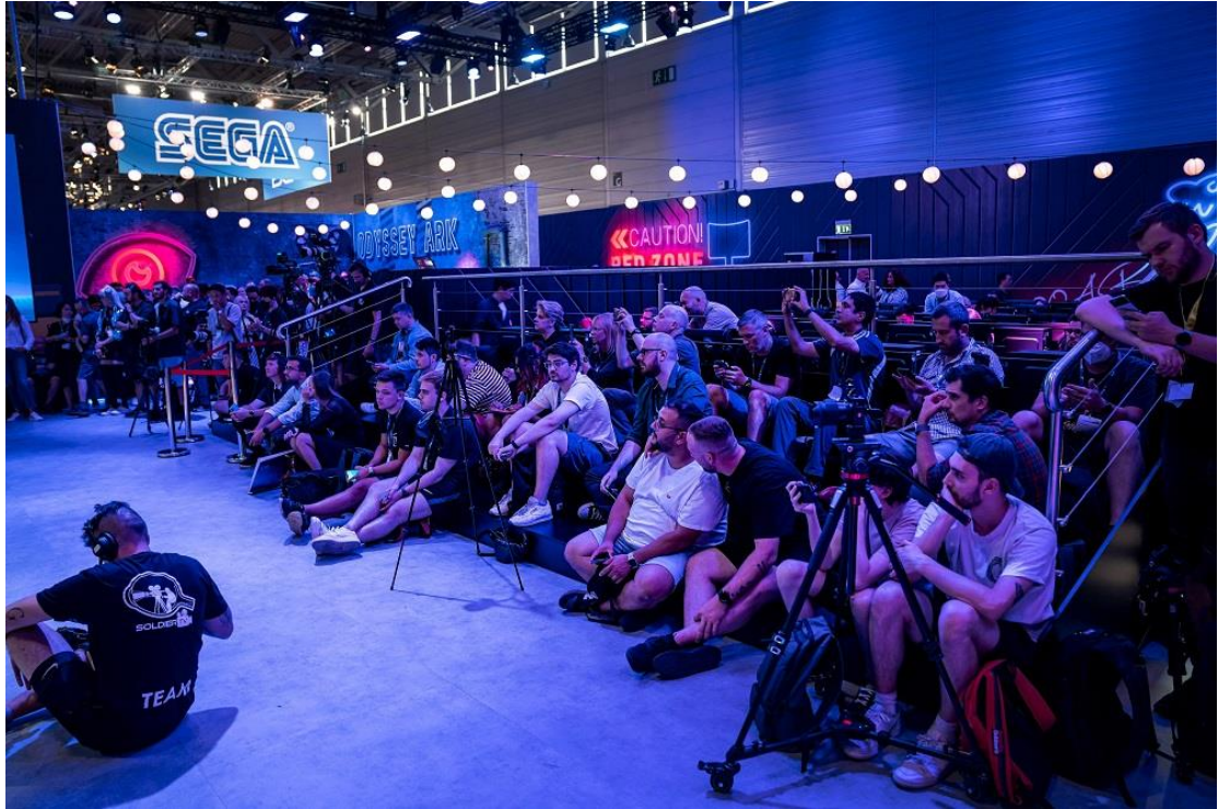
▲三星在 8 月 24 日的媒體活動上，發表 Odyssey Ark 與 Samsung Gaming Hub。