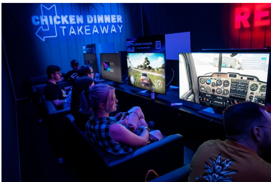
▲參觀者透過 Neo QLED ( QN95B ) 體驗 Samsung Gaming Hub 。