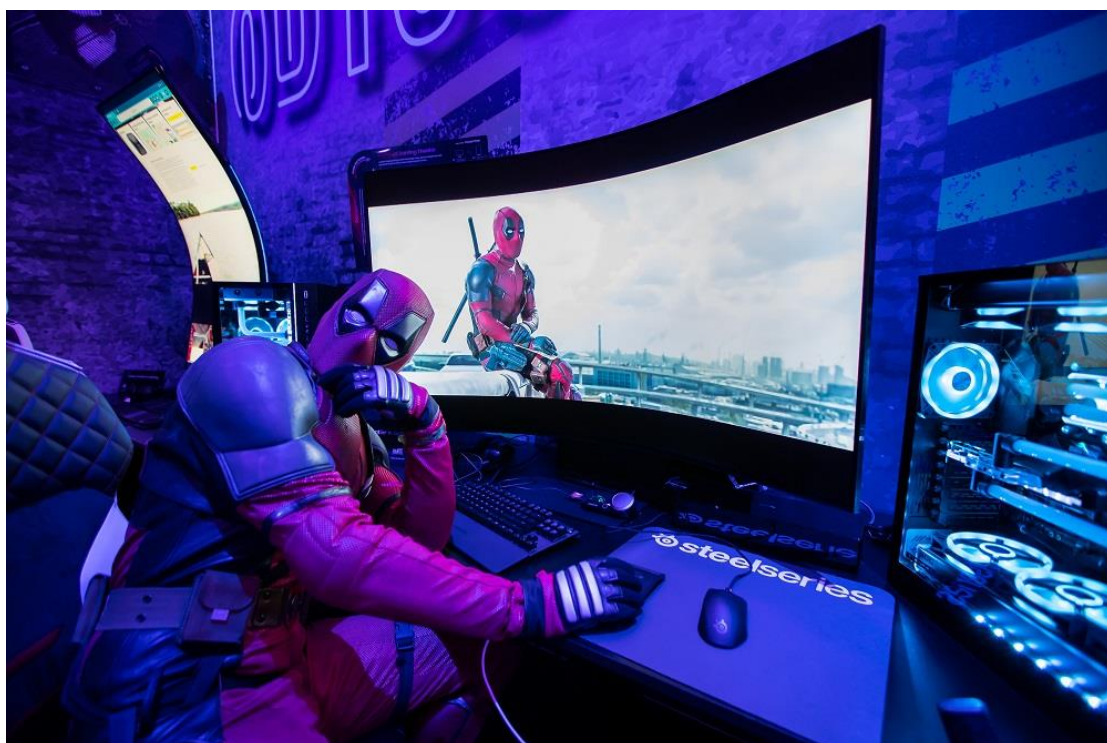
▲ Odyssey Ark 透過多重視窗、座艙模式、4K 解析度和 165Hz 高畫面更新頻率，為玩家打造身歷其境的完美體驗。該款螢幕令人目眩神迷的設計，緊抓眾人目光。