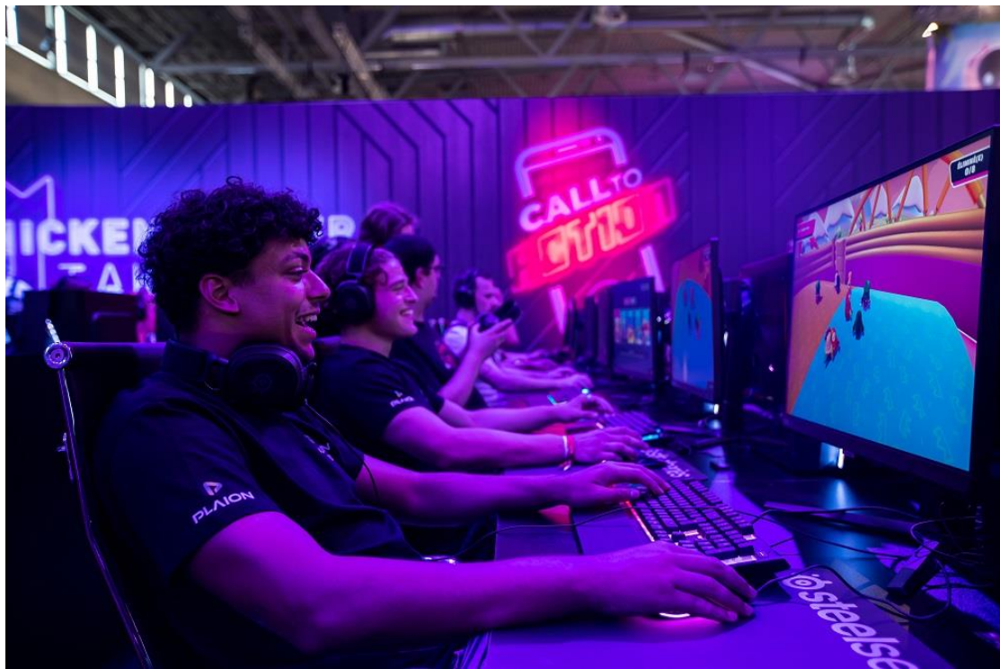
▲ 參觀者體驗完整 Odyssey 陣容，包括 Odyssey Neo G7。