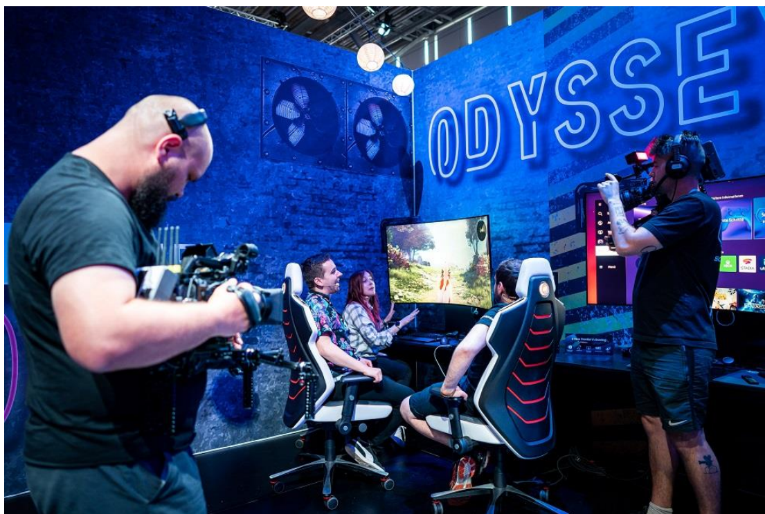
▲來自世界各地的電競遊戲網紅，於「Odyssey Ark Zone」體驗區拍攝影片並熱烈討論 Odyssey Ark。