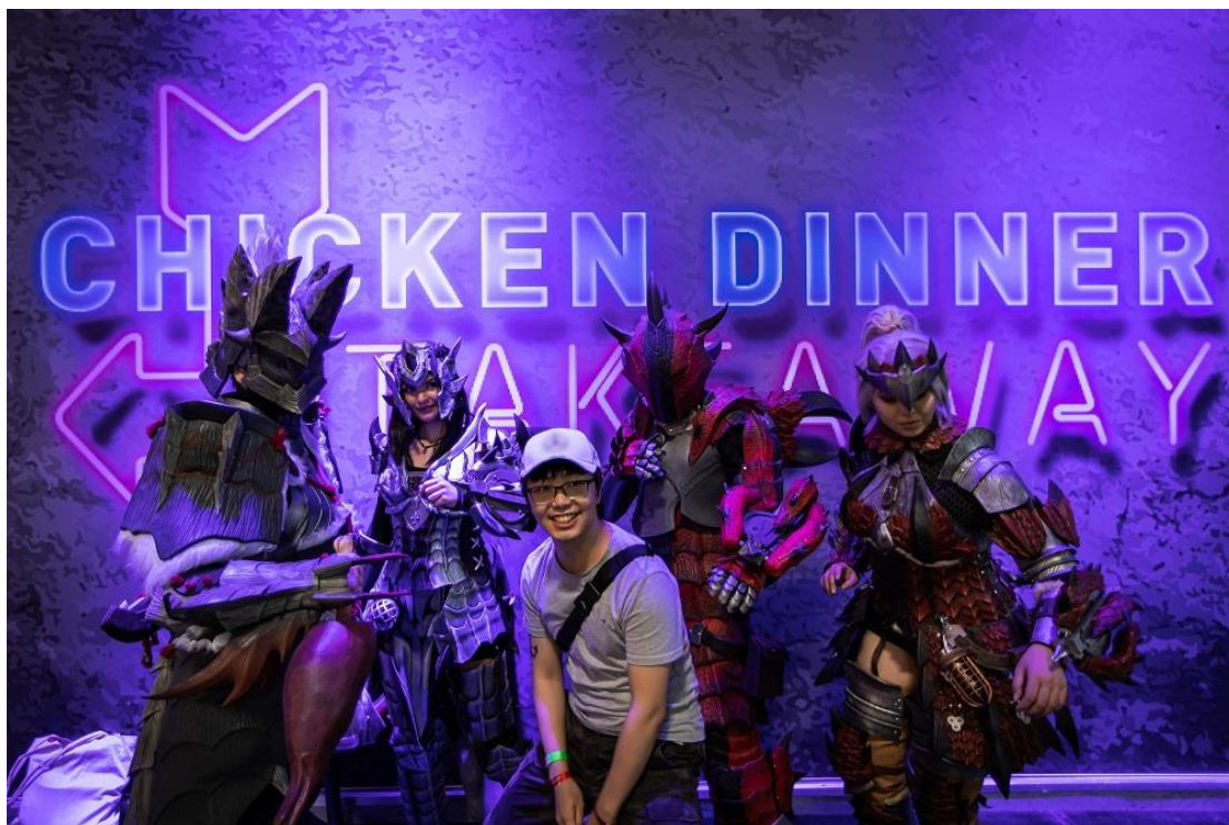
▲ Cosplayer 扮成自己最喜愛的遊戲與電影角色，成為三星展館的吸睛亮點。