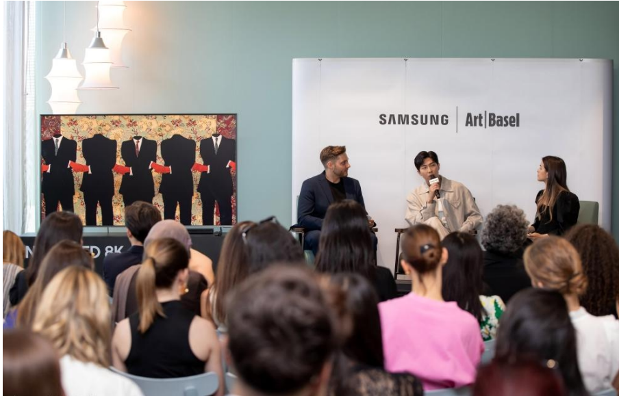
▲ RM 於 2025 年巴塞爾藝術展出席座談會，分享他對藝術的觀點與見解

他表示：「希望未來有一天能透過三星 Art TV 以數位形式分享其收藏作品，讓全球更多人一同欣賞，尤其是那些難以親訪博物館或藝廊的觀眾。若不是居住在首爾，實際上很難親身走進韓國的博物館或藝廊，感受藝術的魅力。若有朝一日能藉由三星 Art TV 架起一座『藝術橋樑』，讓人們『只需按下一個按鈕，就能進入全新的藝術世界』，將是一件極具意義的事。」