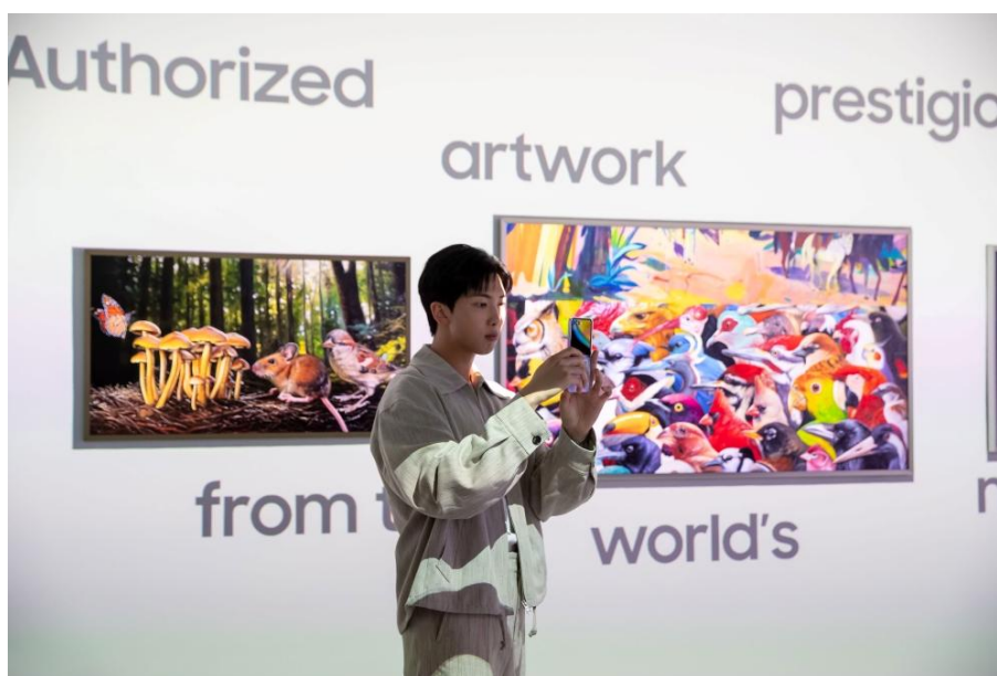
▲ RM 於 ArtCube 互動區內拍照留念