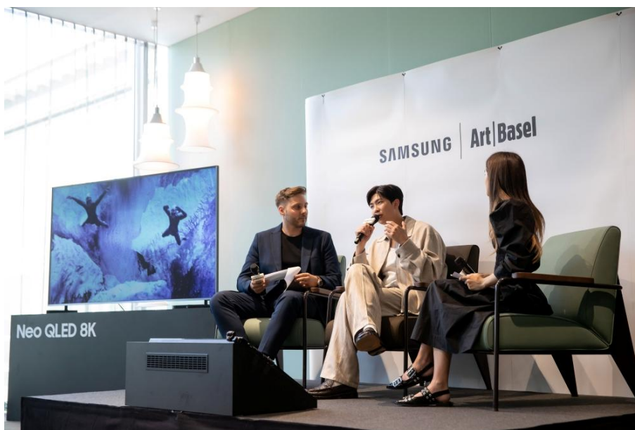
▲ RM 出席 2025 年巴塞爾藝術展座談會

身為藝術創作者、收藏家與文化意見領袖，RM 長期以來積極分享他對視覺藝術的熱愛，涵蓋參觀博物館的心得、對藝術家的見解，以及日益豐富的個人收藏，與全球觀眾產生共鳴。在三星 ArtCube 互動展區中，RM 反思了在數位時代中將藝術融入日常生活的意義、提升藝術普及率的重要性，以及科技如何為全球藝術探索帶來嶄新契機。