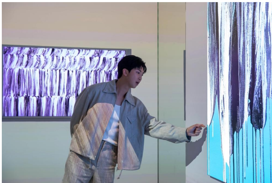
▲ RM 欣賞 ArtCube 互動區展出的藝術作品

身為藝術創作者、收藏家與文化意見領袖，RM 長期以來積極分享他對視覺藝術的熱愛，涵蓋參觀博物館的心得、對藝術家的見解，以及日益豐富的個人收藏，與全球觀眾產生共鳴。在三星 ArtCube 互動展區中，RM 反思了在數位時代中將藝術融入日常生活的意義、提升藝術普及率的重要性，以及科技如何為全球藝術探索帶來嶄新契機。