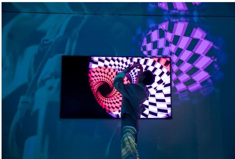
▲ RM 於 ArtCube 互動區駐足欣賞藝術作品