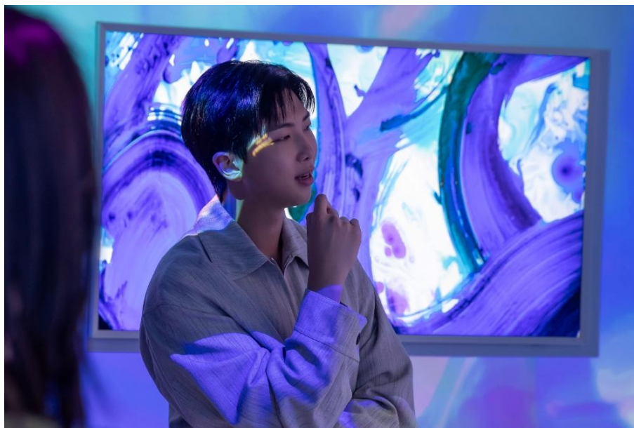
▲ RM 於 ArtCube 互動區欣賞展出的藝術作品

RM 以其對藝術與文化的細膩觀察為人所知，本次亦藉由出席活動分享個人觀點。RM 表示藝術深刻影響其世界觀，而三星 Art TV 則為大眾提供將藝術融入日常生活的新契機，使藝術欣賞變得更加容易親近。