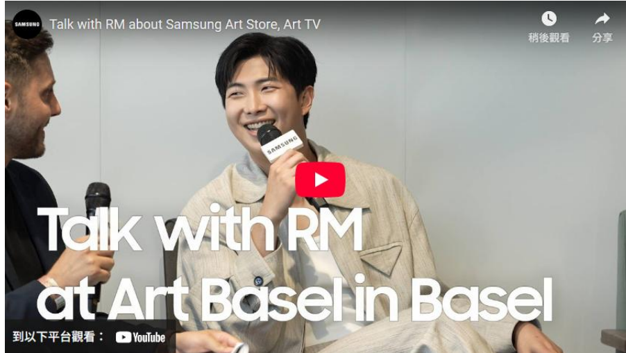
▲ 巴塞爾藝術展「與 RM 對話」座談會

透過 Art TV，三星持續重新定義人們與藝術之間的連結方式，讓牆面化作持續演變的畫布，將居家空間轉化為富有策展意涵的藝廊場域。