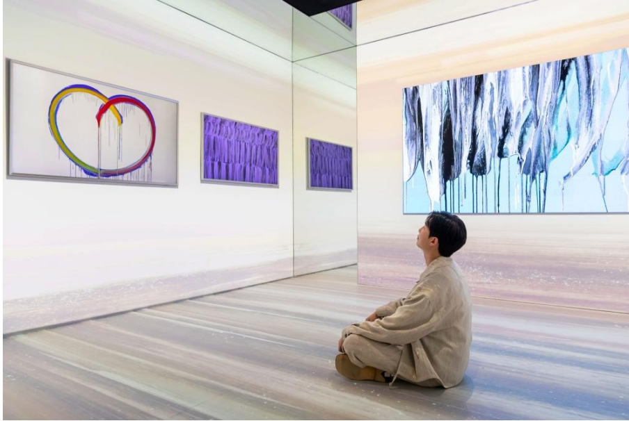
▲ RM 欣賞李健鏞的藝術作品

RM 表示透過三星 Art TV 多元豐富的探索功能與精選藝術收藏，他得以接觸更廣闊的創意世界，進一步激發其創作靈感，並重新思考自身對視覺文化的理解。三星藝術市集讓觀眾跳脫由演算法所塑造的既定喜好與觀看習慣，開啟更具包容性與深度的藝術視野。