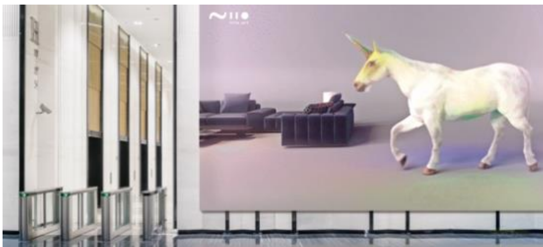
三星與 Niio.Art 平台的飯店大廳合作案例（Jonathan Monaghan 的作品《No Longer Dead》）

http://displaysolutions.samsung.com/partners/strategic-partners/niio