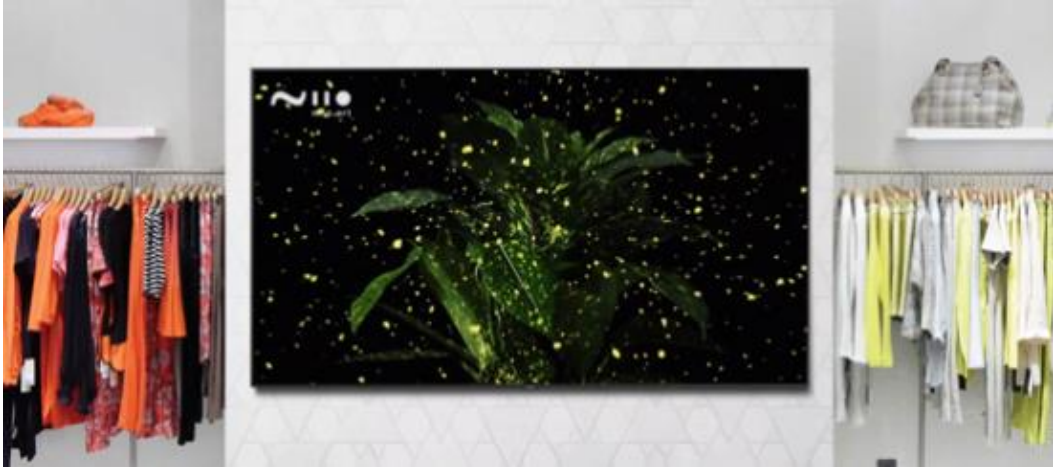
Pascual Sisto 的作品《Aucuba Expanded》。