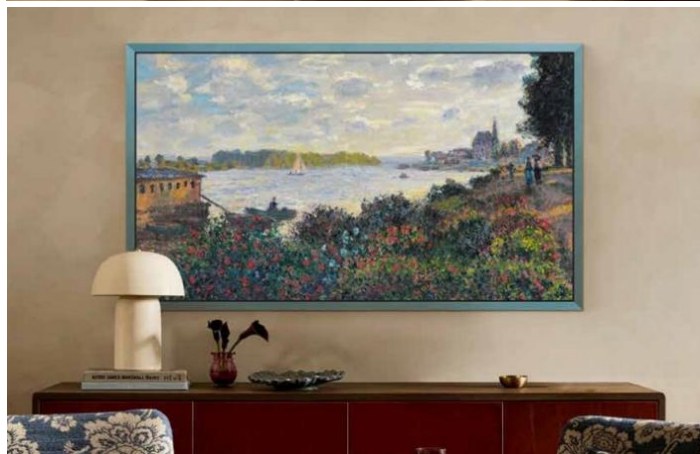
▲ S95H OLED 採用磁吸式裝飾邊框設計，提供多樣色彩與材質選擇，以滿足不同生活風格與居家需求