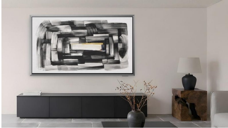
▲ S95H OLED 榮獲 2026 紅點設計大獎「Best of the Best」最高榮譽 (註二)

問： S95H OLED 智慧顯示器跳脫傳統無邊框設計，更強調其作為設計物件的存在感，這種設計理念的轉變源自於何處？