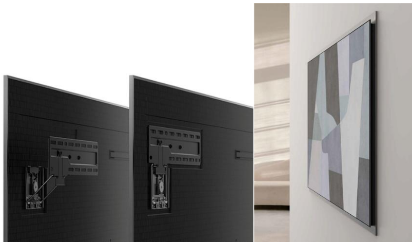
▲ S95H 透過縮小壁掛架尺寸並整合於機身背面設計，使產品能更緊密貼合牆面安裝。

因此，我們將揚聲孔、散熱孔等必要結構巧妙整合於顯示器與外框之間，在完整保有功能性的同時，也避免干擾使用者視線。透過此設計，S95H 能更緊密貼合牆面，營造宛如畫作懸掛於空間中的藝廊式視覺效果。