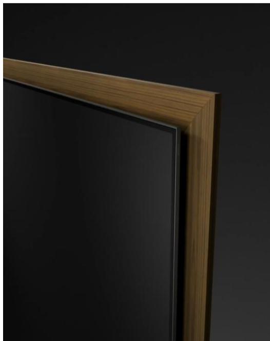
▲ S95H OLED 在保有 OLED 顯示器極致纖薄特色的同時，亦大膽展現全方位金屬背板設計

Cho： 我們希望同時提升空間氛圍與觀影沉浸感。我們大膽地將金屬背板結構外露，藉此柔化螢幕與周遭環境之間的視覺反差，使產品能更自然融入空間，如同室內設計的一部分。同時，我們將螢幕與外框區分為不同層次，進一步強化沉浸式體驗。螢幕層凸顯 S95H 的 OLED 技術與畫質優勢，而外框層則讓產品更自然地融入居家生活空間。