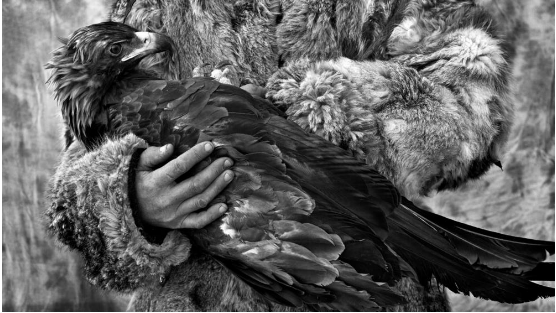
▲ 金鵬 ( 2013 )

Mohan 受訪時表示：「The Frame 美學電視讓觀眾有機會以原創者的角度，細細品味藝術作品。透過其細節與色彩的層次變化，為影像注入活靈活現的生命力。The Frame 美學電視改變人們與藝術的互動方式，使觀眾得以湊近觀賞，窺見藝術家原始的創作意念。」