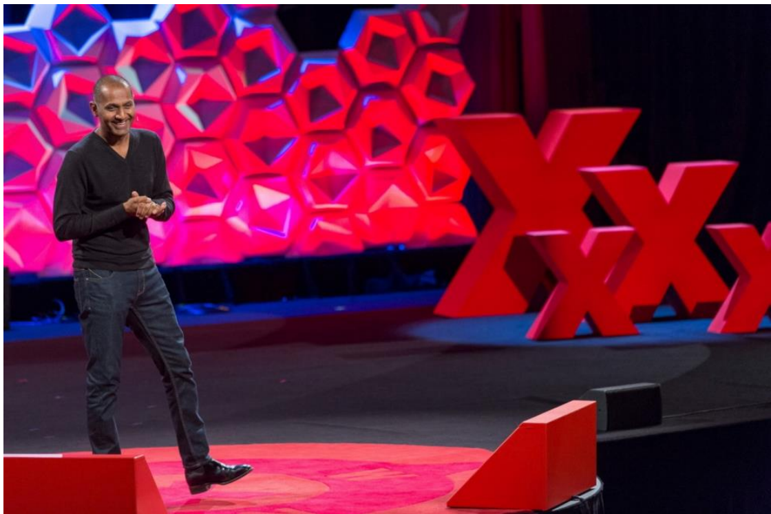
▲ 攝影師 Palani Mohan - Katie Barget 攝於 TEDxSydney | CC BY-NC-ND 2.0

Mohan 運用鏡頭訴說眾生百態，拍攝題材廣泛且無設限；從蒙古邊疆的威武獵鷹，到香港的人文風情，皆為知名作品之一。