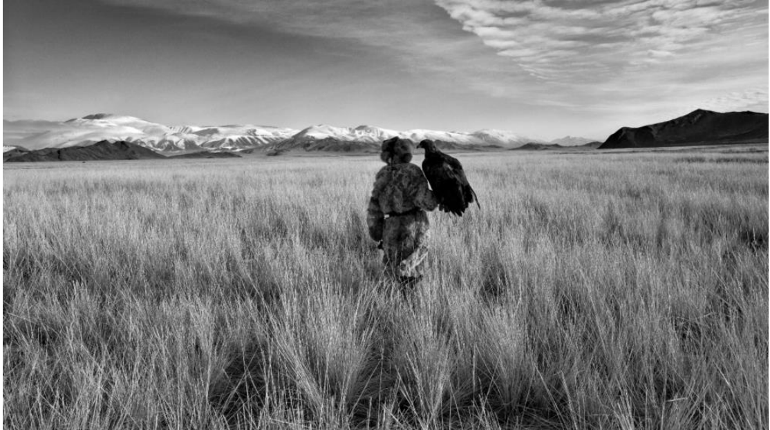
▲ 高草上的勇士與鷹 ( 2013 )

Mohan 常因工作行走天下，造訪陌生的地方、遇見新的人群。Mohan 於疫情爆發前，一年出外景的時間可達六個月；現在他則長時間定點駐足，細細品味當地之美。