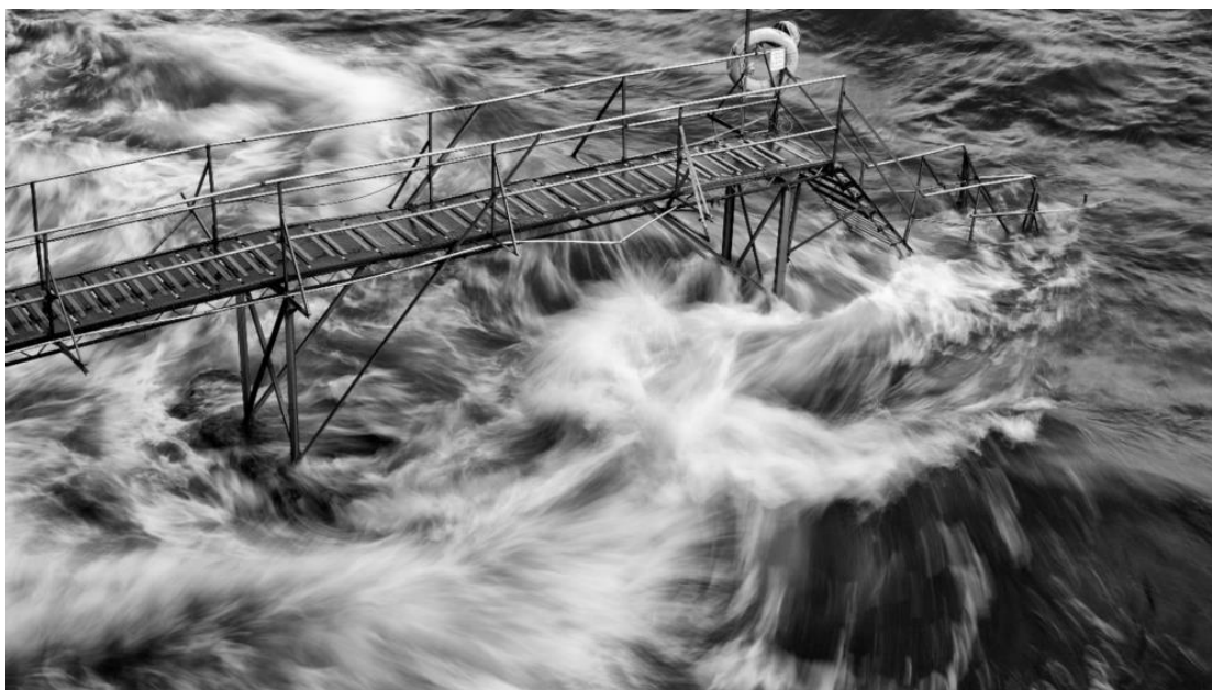
▲ 如蛟龍翻騰的浪花 ( 2019 )

相較於其他攝影師特別重視場景的色彩表現，Mohan 選擇透過黑白兩色呈現耐人尋味的作品，使觀眾更能專注於拍攝主體的細節。