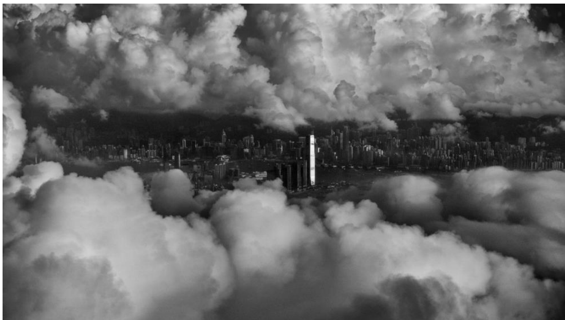
▲ 雲層中的香港 ( 2016 )