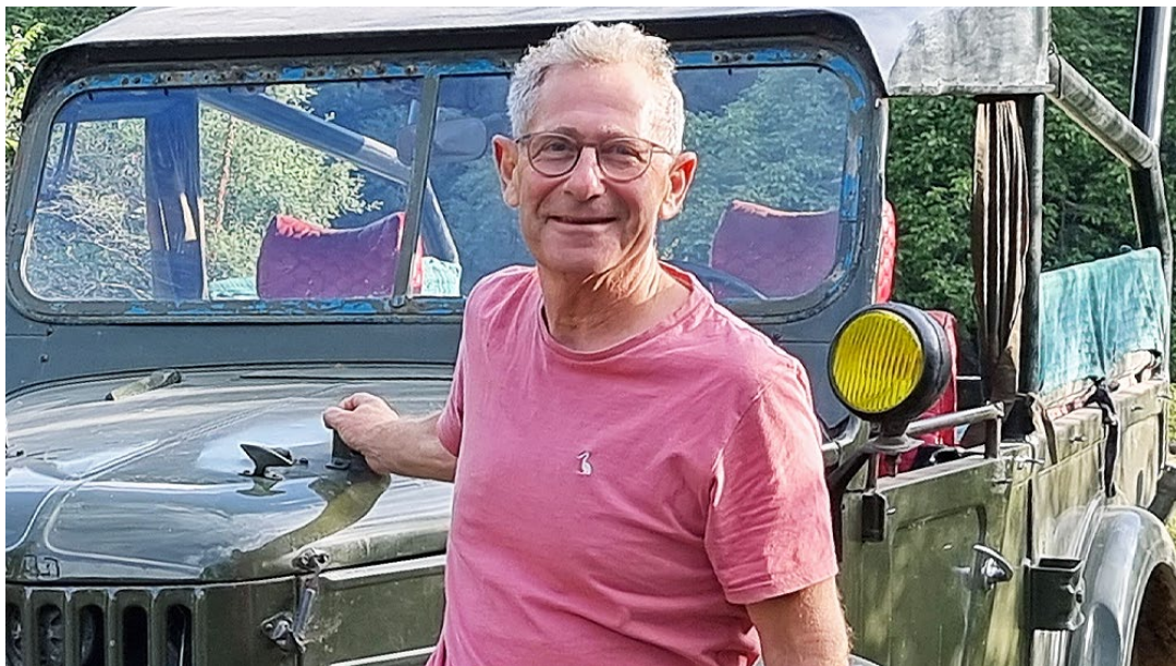
▲ Stuart Franklin

三星新聞中心近距離專訪 Franklin，暢談其藝術創作的心路歷程，以及他如何看待將藝術帶入嶄新、異想空間的數位轉型。