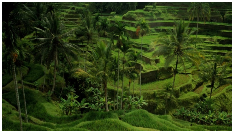
▲Stuart Franklin 攝影作品 - 印尼稻田 ( 2000 拍攝 )

近期的拍攝作品永遠是我的首選，因此我或許會推薦今年在西班牙、義大利、吉爾吉斯拍攝的作品，或是將於 11 月前往柬埔寨、峇里島捕捉的畫面。我也推薦我在 1999 年為 Celebrations of Earth 企劃前往峇里島拍攝的照片 - 那些唯美的綠色稻田，至今仍令我魂牽夢縈。此外，還有在韓國取景的作品等，想推薦的作品太多，著實難以取捨。