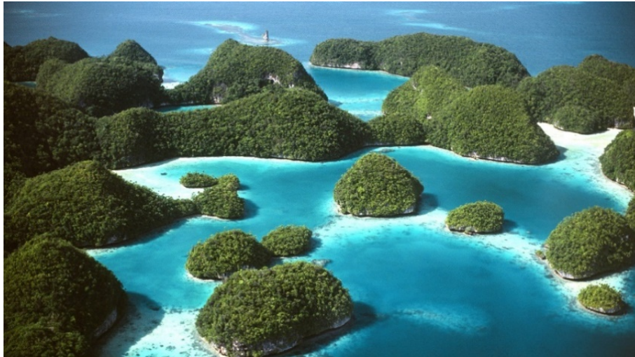
▲ Stuart Franklin 攝影作品 - 加羅林群島 ( 2000 )

問：加羅林群島 ( 2000 ) 是您在 The Frame 美學電視上的作品集當中最受歡迎的其一作品。請您簡單介紹一下這幅作品。它何以令人深深著迷？