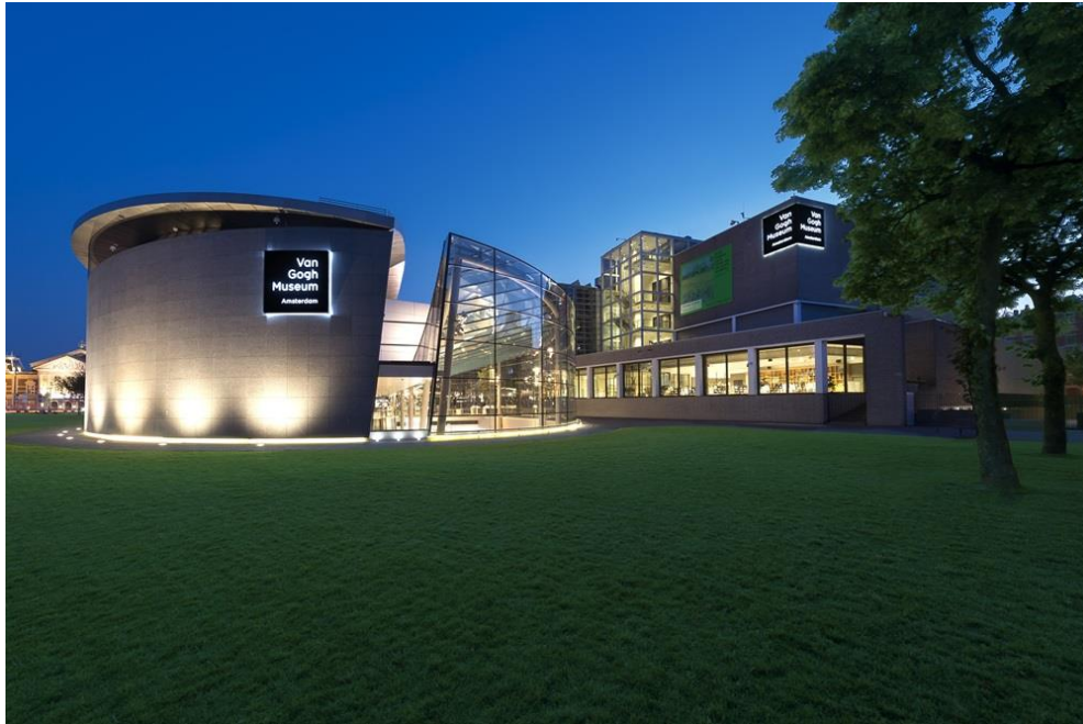
▲ 阿姆斯特丹梵谷博物館。

歷史上少有與文森·梵谷齊名且備受愛戴的藝術家。從《盛開的杏花》到《向日葵》，乃至其著名的自畫像和引人入勝的印象主義傑作，皆以大膽的用色和戲劇性的筆觸聞名於世。而荷蘭阿姆斯特丹的梵谷博物館擁有世界上最多的梵谷藝術館藏，致力於收藏梵谷及其同時代藝術家的作品。