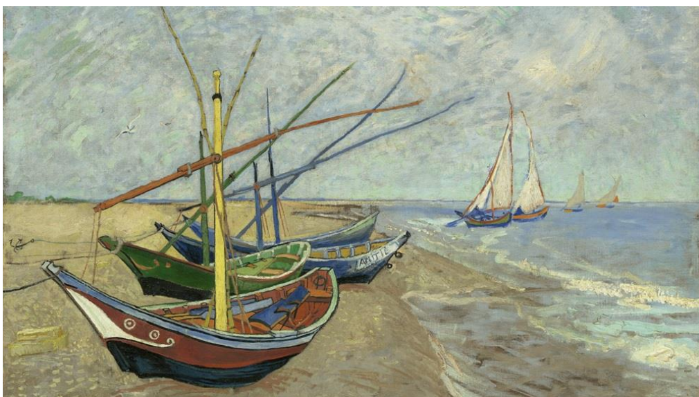
▲ 《在聖馬迪拉莫海邊的漁船》( 1888 )。

下一件作品是《在聖馬迪拉莫海邊的漁船》，湛藍的大海和天空，與色彩豐富的船隻相映成趣，在 The Frame 美學電視的完美演繹下風采畢露。電視的鮮豔色調使場景栩栩如生，突顯了畫作活靈活現的本質。