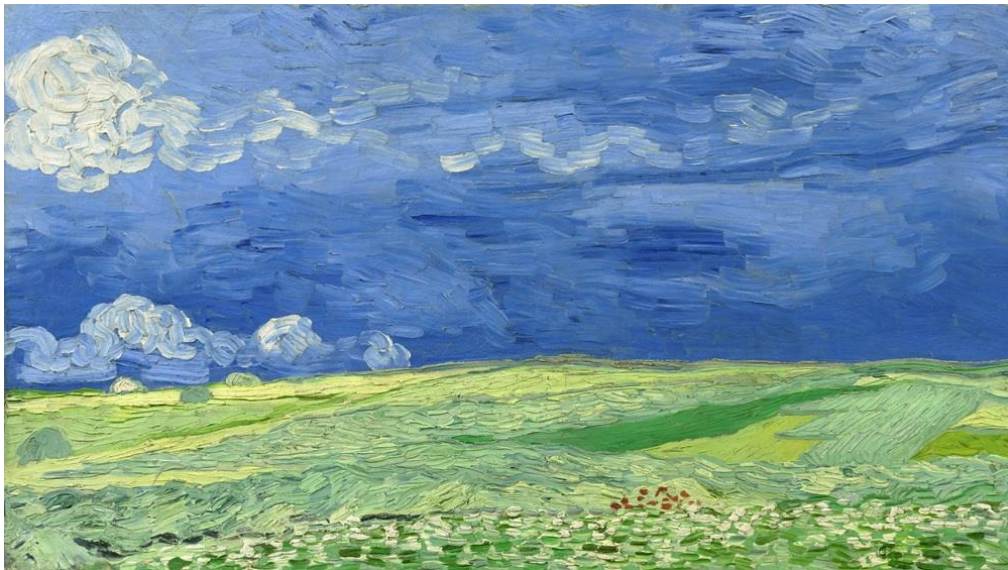
▲ 《雷雨雲下的麥田》( 1890 )。

我第一幅想推薦的是《雷雨雲下的麥田》，陰鬱黑暗的天空與金黃色的麥田形成衝擊感十足的畫面，透過 The Frame 美學電視的絕美色彩對比，能夠忠實還原出梵谷最初的濃烈情感與悸動。