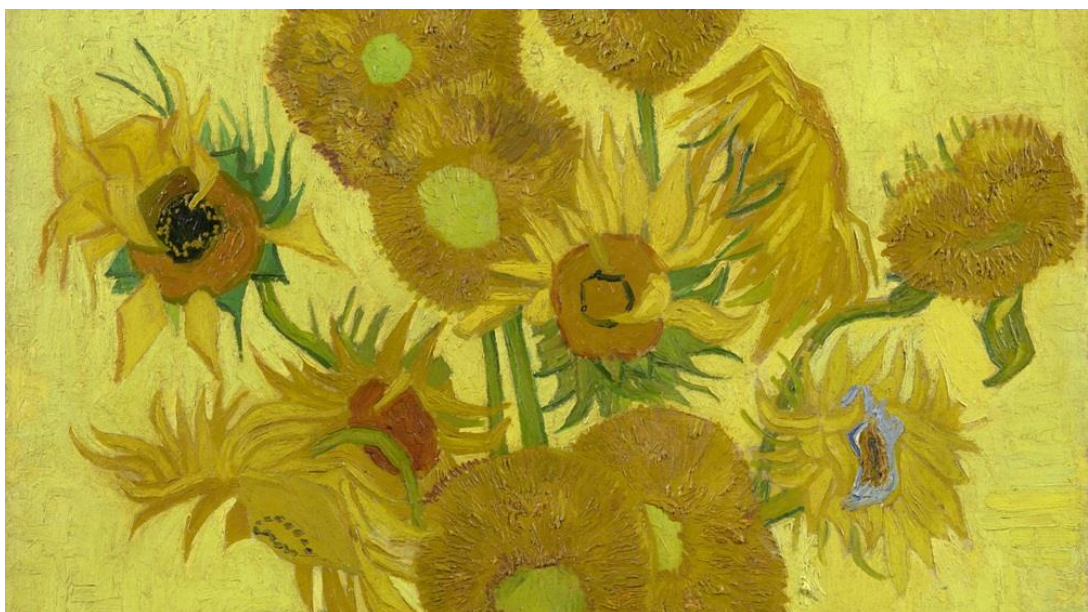
▲《向日葵》( 1889 )。

為慶祝成立 50 週年，博物館正在籌辦各式特別展覽、活動和教育計劃，回顧過往成果並展望未來對藝術界的貢獻。歡迎所有人共襄盛舉參與合作活動和展覽，例如持續至 2024 年的 寶可夢 聯名特展。今年年初，我們亦舉辦 向日葵藝術節 紀念此特別時刻。