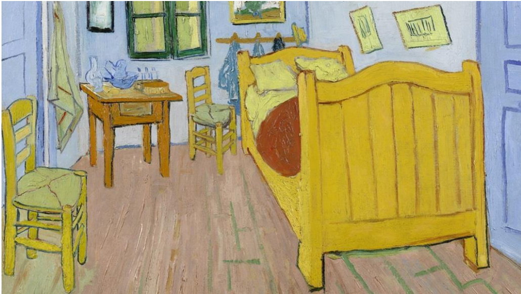
▲ 《在亞爾的臥室》( 1888 )。