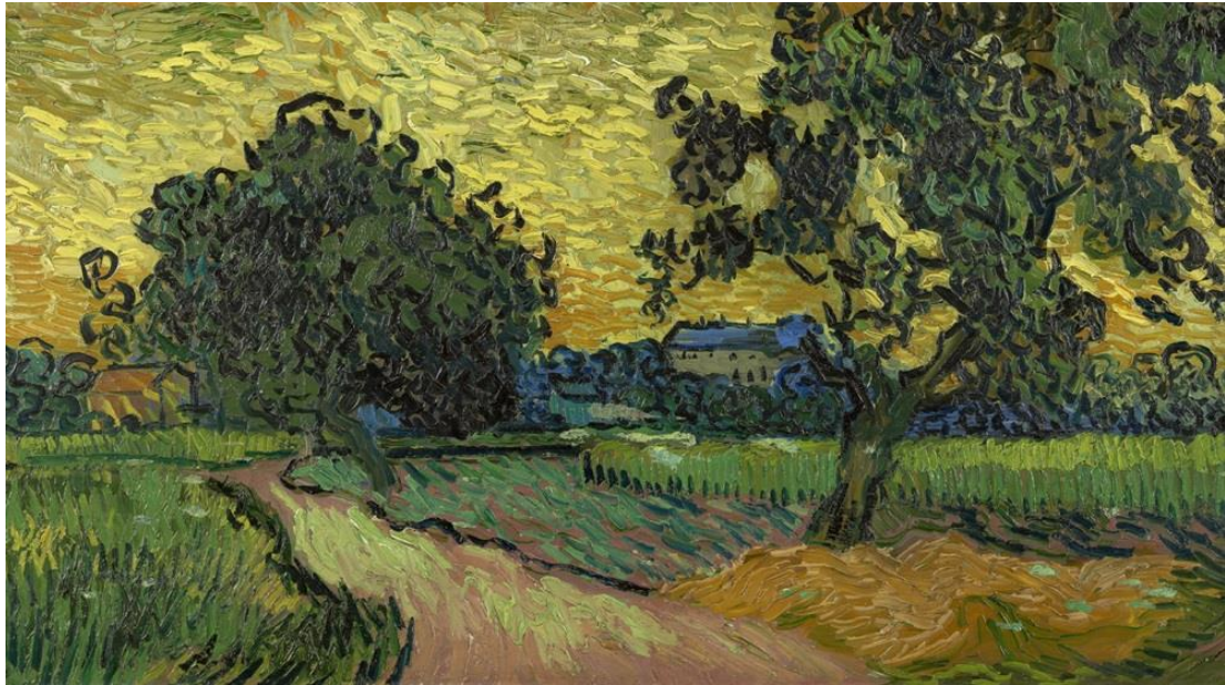
▲《日暮風光》( 1890 )。

第三件我選擇《日暮風光》，畫中描繪傍晚的天空和鄉村景致。The Frame 美學電視精準捕捉微妙的色彩差異，使這幅田園畫作在任何空間都能成為最佳點綴。