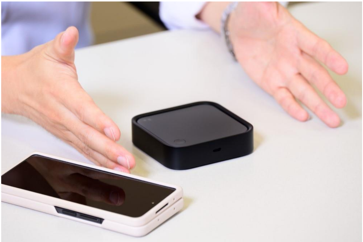
▲ 借助 SmartThings Station，即使手機掉到床底下，也能輕鬆尋獲。

產品規劃師 Kiyong Kwon 談到：「我們將 SmartThings Station 的開發重點放在提升跨裝置的互聯性，讓用戶輕鬆串聯各式裝置，享受暢行無阻的智慧家居體驗。」