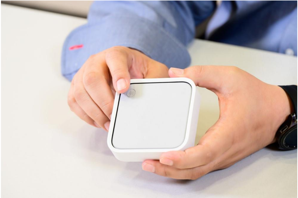
▲ SmartThings Station 上方的智慧鍵