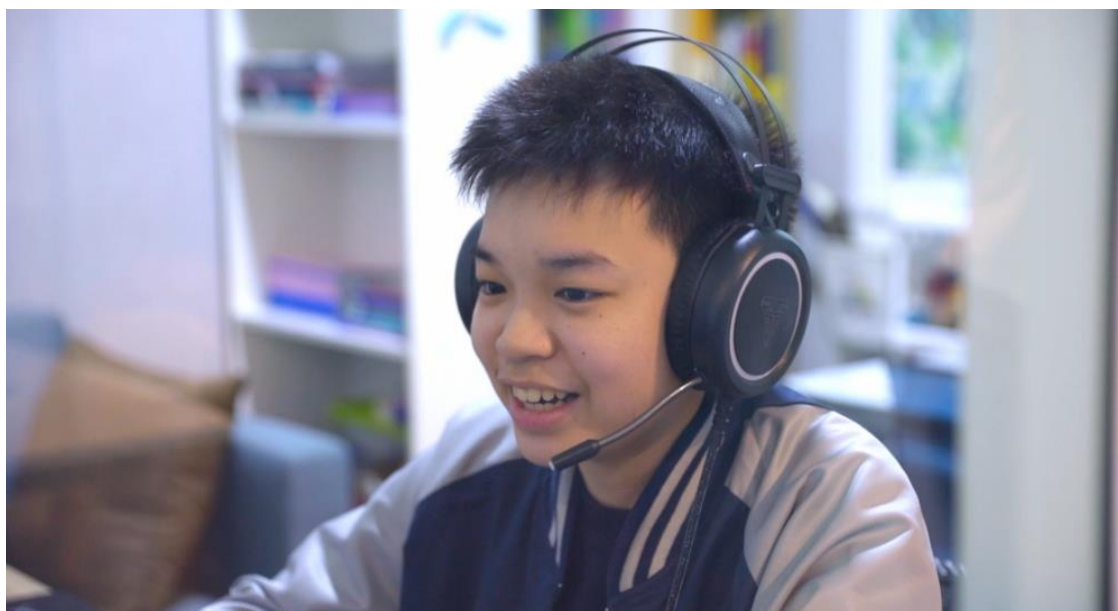
三星創新校園 - 泰國分校的學員參與線上課程