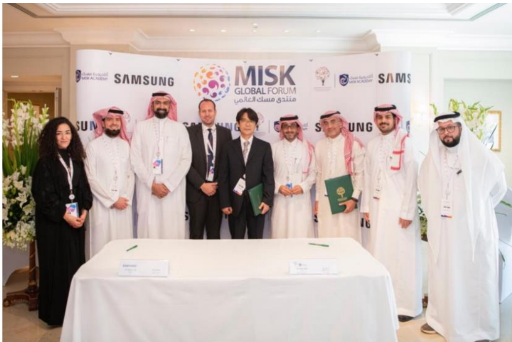
2019 年 11 月，三星電子以培育沙國年輕人才為目標，和 Misk Academy 代表團簽署備忘錄 ( MoU )。

今年，三星電子以資助和培育沙國年輕人才為目標，在沙烏地阿拉伯啟動最新的「三星創新校園」計劃，並將物聯網 ( IoT ) 和 AI 列為今年度的教學重點，藉由培養年輕學子的進階與專業技能，為他們的成功人生奠定穩固的基石。