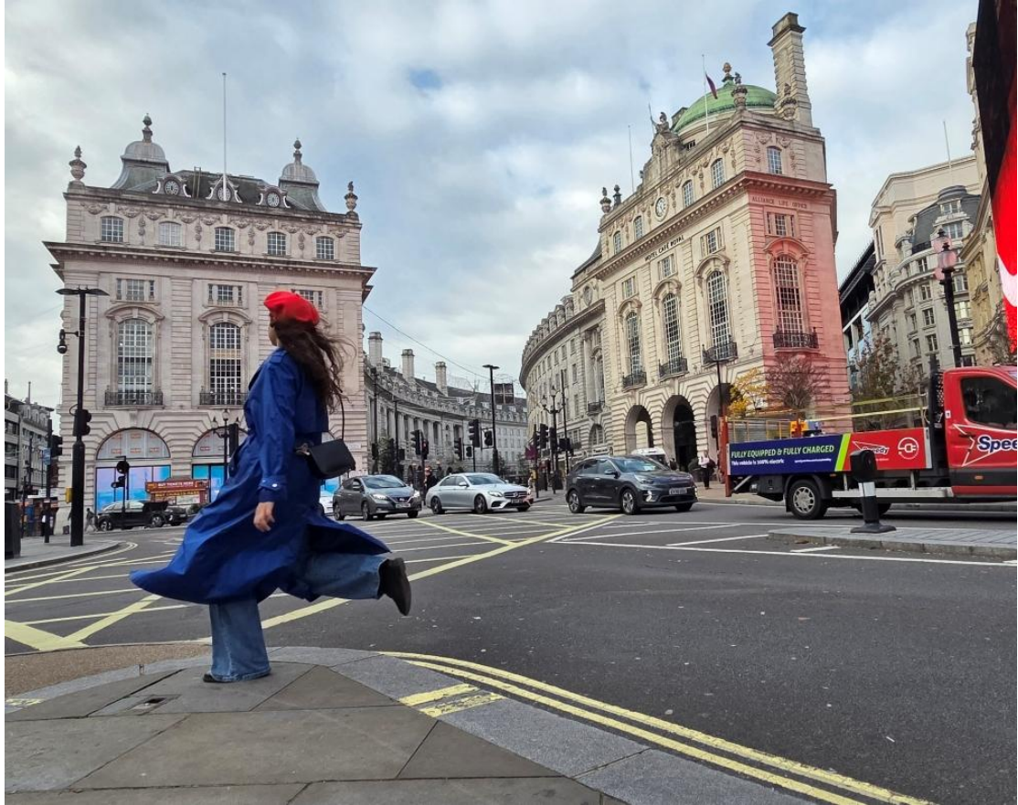
▲ 使用前：以 Galaxy Z Fold7 拍攝、尚未經過編修的皮卡迪利圓環照片