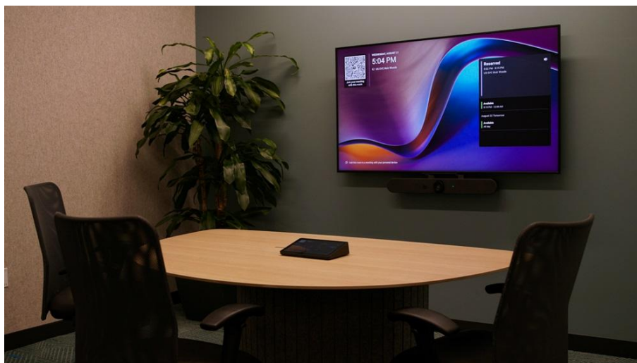
▲ 三星與羅技協助企業克服技術挑戰，提升生產力，打造高效靈活的工作環境。

三星與羅技 共同承諾，將環境永續理念融入每項產品設計。兩家公司開發的解決方案可在閒置時自動進入待機模式或關閉，有助於減少能源消耗。三星 SmartThings Pro 可遠端控制並監測聯網辦公設備的效能與各項環境指標。羅技則積極推動氣候策略，並落實「永續設計」( Design for Sustainability ) 原則，其產品中有 75% 使用再生回收塑膠，66% 具備碳足跡標籤，且 94% 的電子碳足跡來自直接與間接採購的可再生能源。