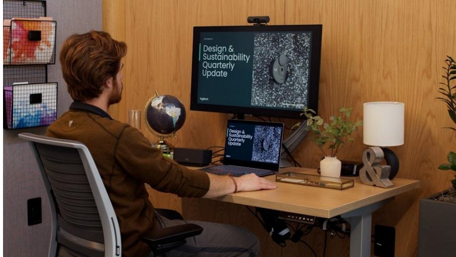
▲ 三星與羅技持續致力於將永續設計融入每項產品，並協助企業有效管理能源消耗。

三星與羅技 共同承諾，將環境永續理念融入每項產品設計。兩家公司開發的解決方案可在閒置時自動進入待機模式或關閉，有助於減少能源消耗。三星 SmartThings Pro 可遠端控制並監測聯網辦公設備的效能與各項環境指標。羅技則積極推動氣候策略，並落實「永續設計」( Design for Sustainability ) 原則，其產品中有 75% 使用再生回收塑膠，66% 具備碳足跡標籤，且 94% 的電子碳足跡來自直接與間接採購的可再生能源。