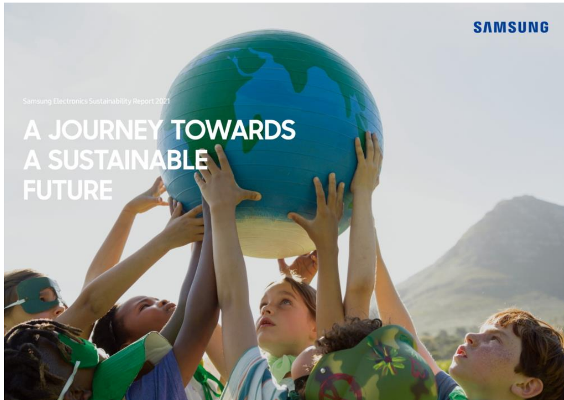
▲三星電子 2021 年《永續發展報告》封面