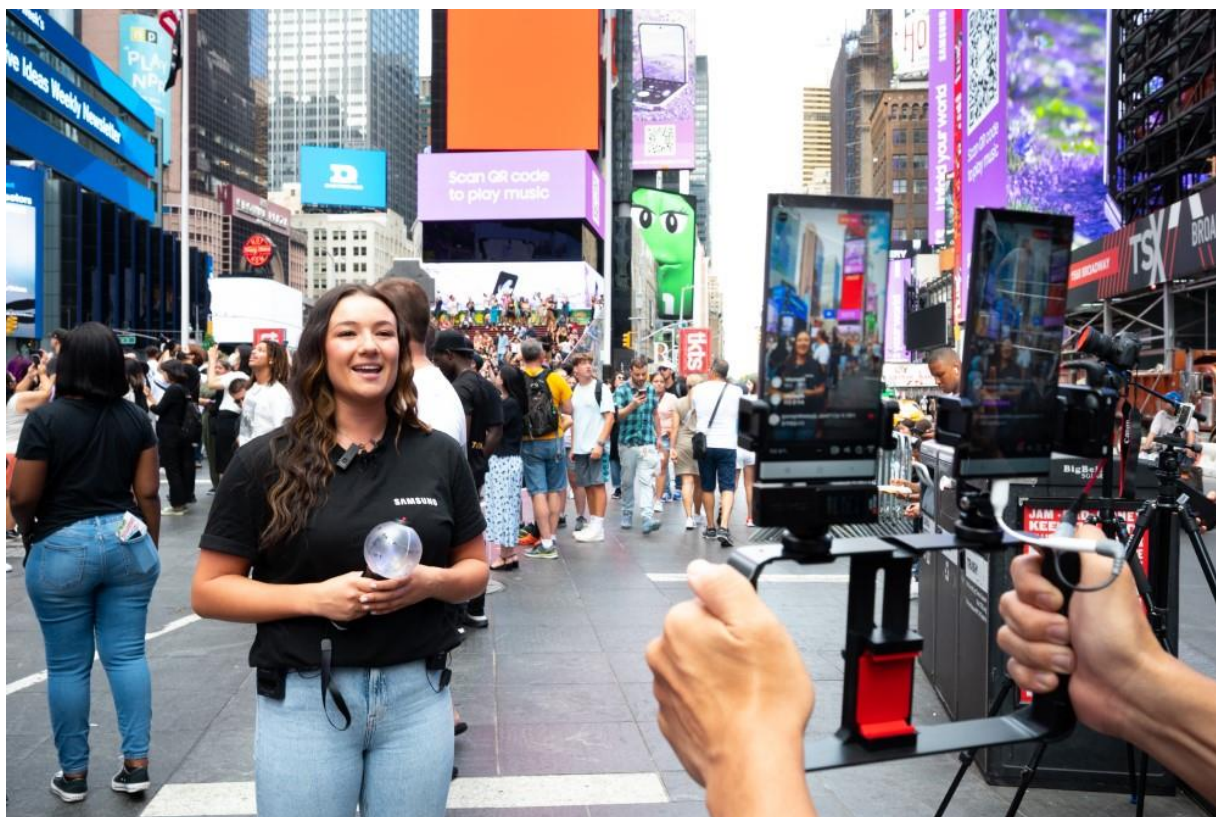
▲三星新聞中心透過 Instagram Live 直播，帶領觀眾前往紐約時代廣場直擊 Galaxy Unpacked 2022 活動現場