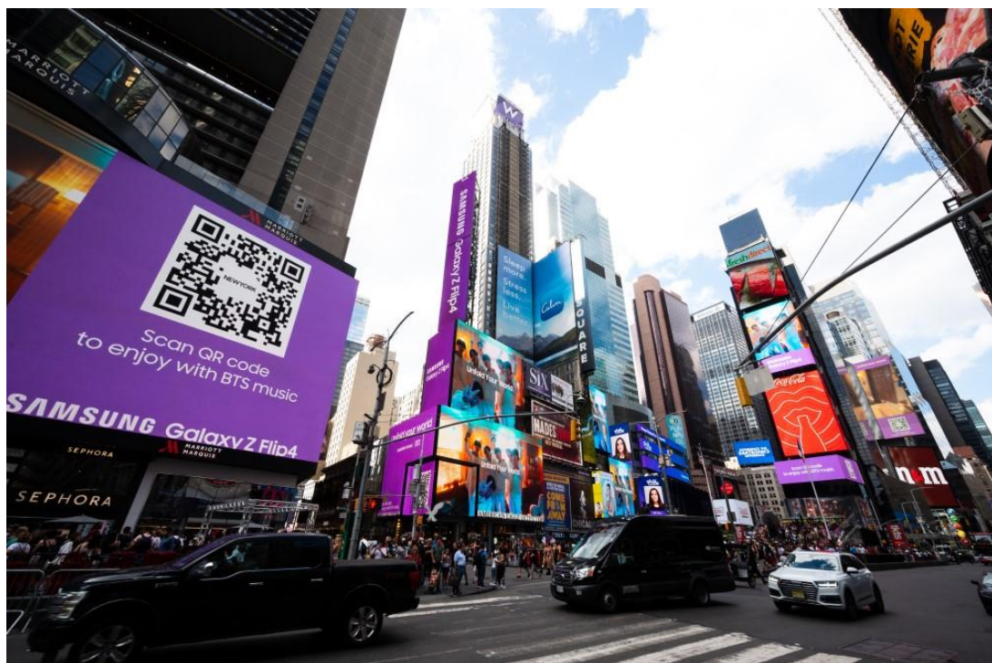
▲ Galaxy 用戶掃描廣告看板上的 QR code 後，智慧型手機將自動同步播放大螢幕中 BTS 的音樂