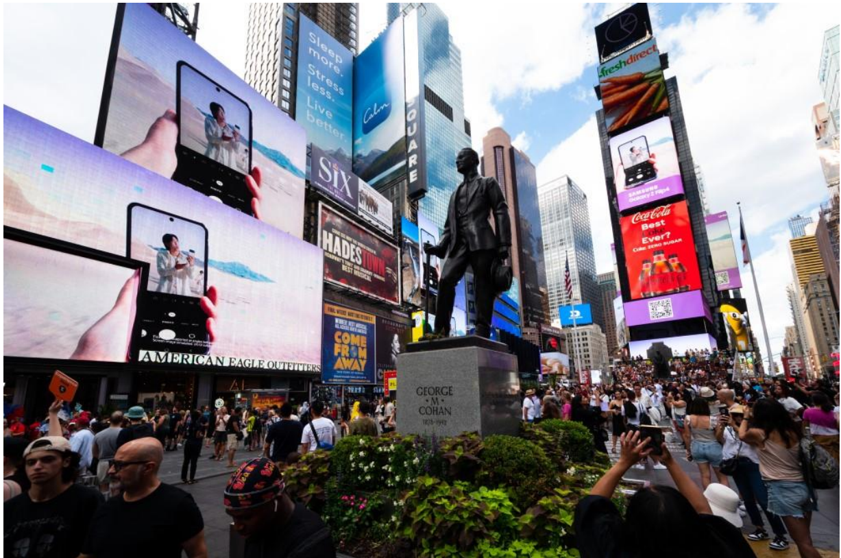
▲ Galaxy Unpacked 2022 期間，以 BTS《Yet To Come ( The Most Beautiful Moment ) 》與《Over the Horizon 2022 by SUGA of BTS》為配樂的數位宣傳影片，於紐約時代廣場巨型螢幕上首播