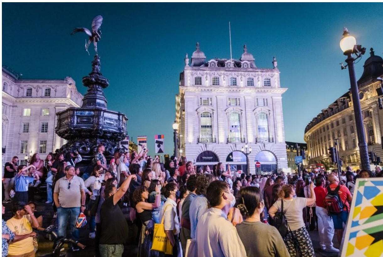
▲Galaxy Unpacked 2022 期間，眾多觀眾聚集在倫敦皮卡地里圓環廣場，