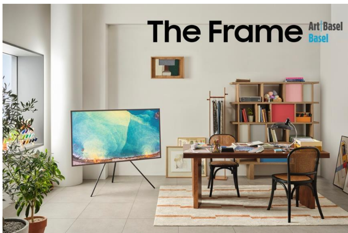
▲ The Frame 成為 2024 巴塞爾藝術展的官方視覺顯示器。

註一：Samsung The Frame Lounge 位於 2024 巴塞爾藝術展巴塞爾展會 Unlimited 展廳旁的 Messe Basel Hall 1。標題與地點如有變更，恕不另行通知。