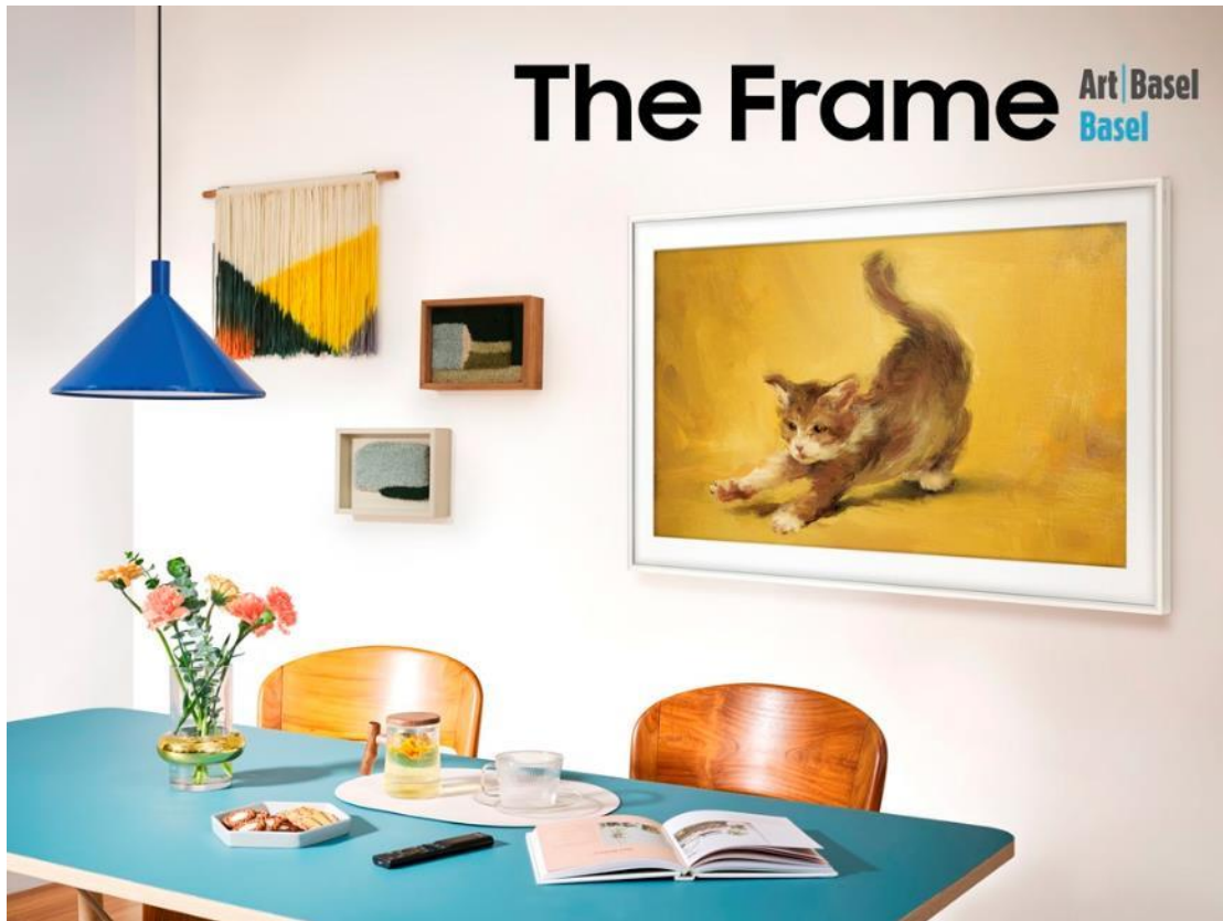
▲ 三星設計生活系列「The Frame」成為巴塞爾藝術展首款官方視覺顯示器。

今年，巴塞爾藝術展 巴塞爾展會 將於 6 月 13 日至 16 日在 Messe Basel 舉行，共計來自 40 個地區的 286 間藝廊參展。