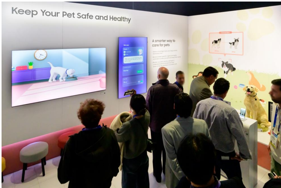
▲ 觀展者觀看 SmartThings 功能的示範，此解決方案可偵測動作並監控活動狀態，為親人提供先進的安全照護