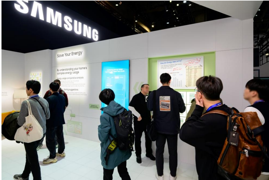
▲ 居家效率展區 ( Home for Efficiency ) 重點介紹 AI 節能技術和客製化的智慧家庭解決方案

三星在 CES 2025 的展位上展示了「AI for All」全民 AI 願景下的劃時代解決方案，涵蓋從節能技術到先進的親人照護功能。三星電子致力於推動智慧家庭發展透過 AI 創新技術改變日常生活，並以安全、便利與樂趣為核心，讓用戶能夠騰出更多時間，專注於最重要的人與事。