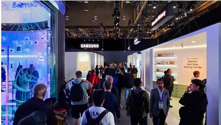
▲ 展覽空間展示 SmartThings 互聯設備如何創造智慧生態圈，靈活配合用戶的生活風格巧妙運作

三星新聞中心深入介紹最新的創新成果如何透過智慧、個人化和聯網解決方案徹底改變日常生活。