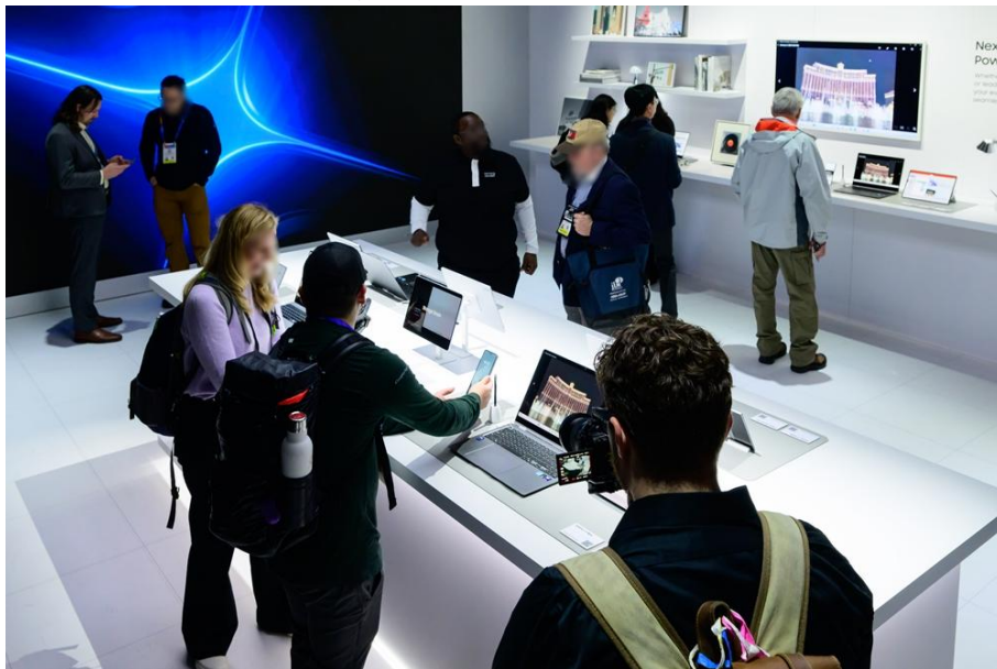
▲ 居家生產力展區 ( Home for Productivity )

居家生產力展區 ( Home for Productivity ) 重點介紹採用 Galaxy AI 技術的最佳化工作和學習工具。觀展者體驗即將推出的 Galaxy Book5 Pro 的 AI Select 功能，可立即搜尋螢幕特定區域，或從影像中擷取文字，快速輕鬆獲取資訊。