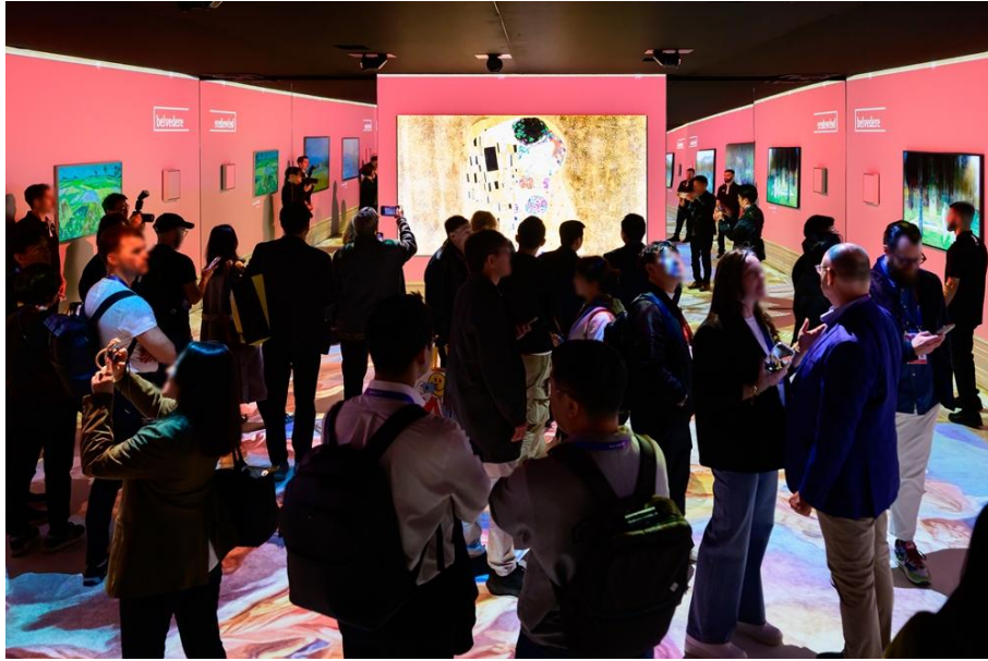
▲ 居家藝術展區 ( Home for Art )