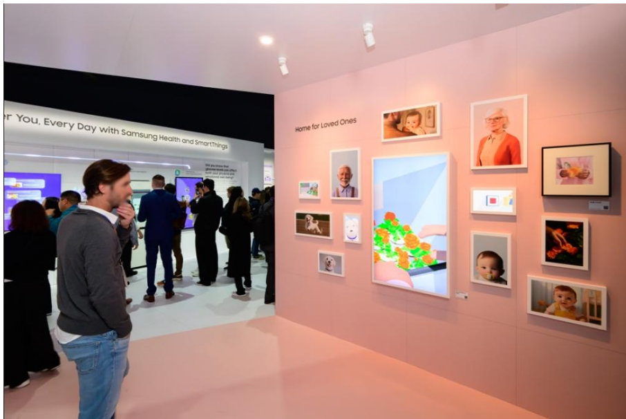
▲ 居家親情展區 ( Home for Loved Ones )

居家親情展區 ( Home for Loved Ones ) 向觀展者介紹各種居家 AI 解決方案，能協助照顧家人、寵物和植物。SmartThings 整合先進的連線感應器，可偵測跌倒等事件，並將緊急警報傳送至預先核准的互聯設備，例如家人的手機、電視和 Family Hub™冰箱。