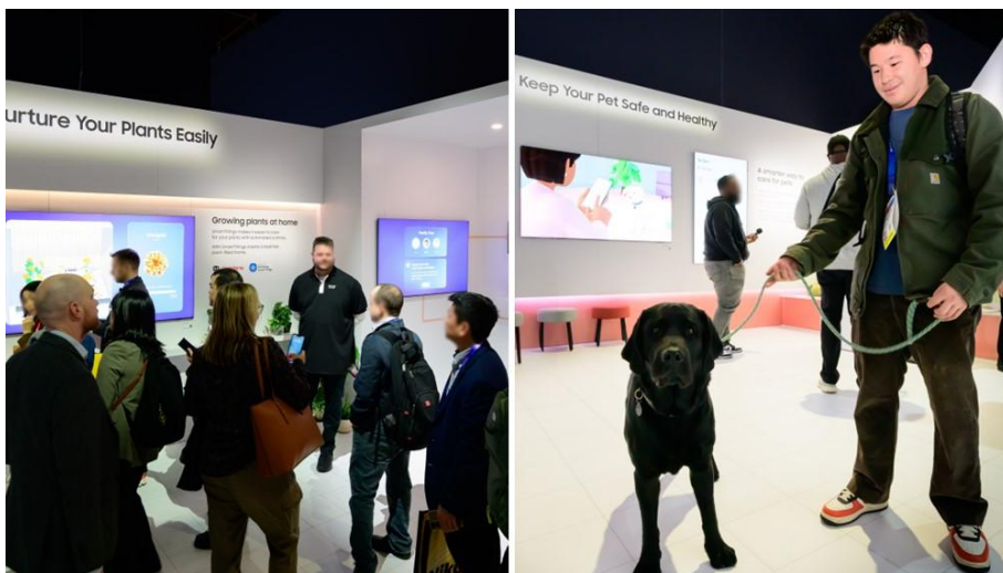
▲ 居家親情展區 ( Home for Loved Ones ) 展示智慧型寵物照護解決方案

居家親情展區 ( Home for Loved Ones ) 向觀展者介紹各種居家 AI 解決方案，能協助照顧家人、寵物和植物。SmartThings 整合先進的連線感應器，可偵測跌倒等事件，並將緊急警報傳送至預先核准的互聯設備，例如家人的手機、電視和 Family Hub™冰箱。